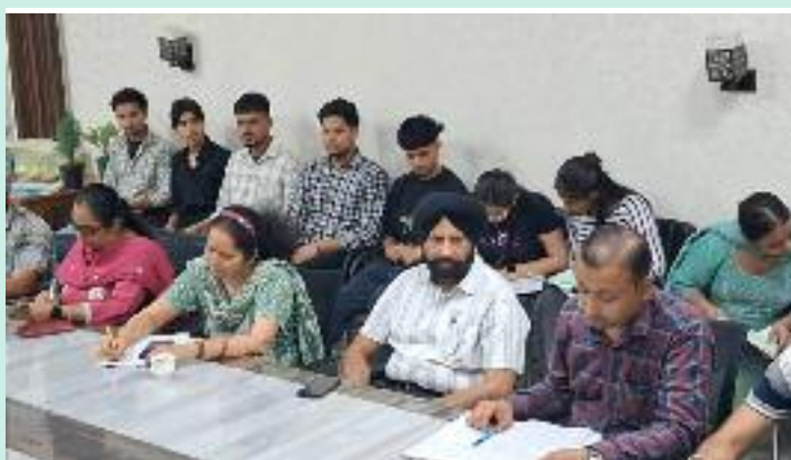
ਸਕੀਮਾਂ ਵੀ ਸਫਲਤਾ ਸਹਿਤ ਚੱਲ ਰਹੀਆਂ ਹਨ ਜਿਨ੍ਹਾਂ ਨਾਲ ਇਲਾਕੇ ਦੇ ਹੋਣਹਾਰ ਅਤੇ ਵੱਖ-ਵੱਖ ਵਰਗਾਂ ਦੇ ਲੋੜਵੰਦ ਵਿਦਿਆਰਥੀਆਂ ਨੂੰ ਵੀ ਵੱਡਾ ਲਾਭ ਮਿਲਦਾ ਹੈ। ਉਹਨਾਂ ਕਿਹਾ ਕਿ ਕਾਲਜ ਵਿਚ ਬੀ ਐੱਸ

ਦਾਖਲੇ ਸਬੰਧੀ ਵਿਸ਼ੇਸ਼ ਦਾਖਲਾ ਅਤੇ ਕਾਉਂਸਲਿੰਗ ਸੈੱਲ ਵੀ ਚੱਲ ਰਿਹਾ ਹੈ ਅਤੇ ਪਿੰਡਾਂ ਵਿੱਚ ਸਥਾਪਤ ਦਾਖਲ ਕੇਂਦਰਾਂ ਵਿੱਚ ਪੁੱਜ ਕੇ ਵੀ ਵਿਦਿਆਰਥੀ ਆਪਣੇ ਪੰਜਦੀਦਾ ਕੋਰਸਾਂ ਵਿੱਚ ਦਾਖਲੇ ਹਾਸਿਲ ਕਰ ਰਹੇ ਹਨ। ਉਹਨਾਂ ਦੱਸਿਆ ਕਿ ਕਾਲਜ ਵਲੋਂ ਪੋਸਟ ਮੈਟਰਿਕ ਸਕਾਲਰਸ਼ਿਪ ਅਧੀਨ ਯੋਗ ਐਸਸੀ, ਐਸਟੀ ਵਿਦਿਆਰਥੀਆਂ ਤੋਂ ਸਿਰਫ ਯੂਨੀਵਰਸਿਟੀ ਫੀਸ ਹੀ ਲਈ ਜਾ ਰਹੀ ਹੈ ਅਤੇ ਸੰਸਥਾ ਵਿੱਚ ਹੋਰ ਵੱਖ ਵੱਖ ਵਜ਼ੀਫਾ ਰਾਸ਼ੀ