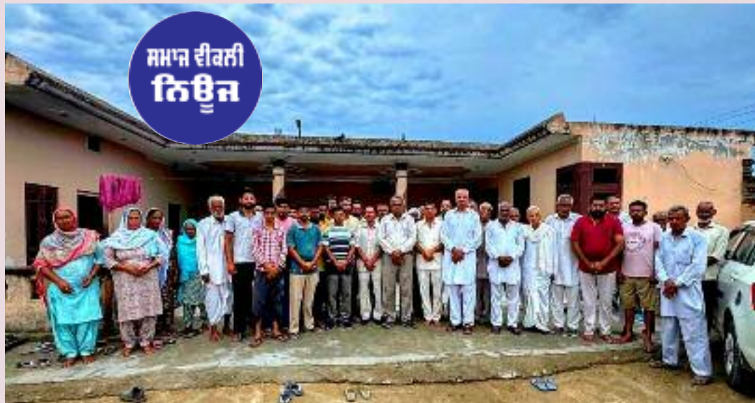
ਗਿਆ ਹੈ। ਪੰਜਾਬ ਭਰ ਵਿੱਚ 'ਆਮ ਐਮੀਨੈਂਸ' ਅਤੇ ਪਿੰਡਾਂ ਵਿੱਚ ਨਵੇਂ ਖੇਡ ਸਟੇਡੀਅਮ ਬਣਾਏ ਜਾ ਰਹੇ ਹਨ। ਨਸ਼ਾ ਤਸਕਰਾਂ ਅਤੇ ਬੇਅਦਬੀ ਦੇ ਦੋਸ਼ੀਆਂ ਖਿਲਾਫ ਸਖ਼ਤ ਕਾਨੂੰਨੀ

ਆਉਣ ਵਾਲੇ 650ਵੇਂ ਜਨਮ ਦਿਵਸ ਨੂੰ ਸਮਰਪਿਤ ਐਲ.ਈ.ਡੀ. ਸਕ੍ਰੀਨਾਂ ਵਾਲੀਆਂ ਵੈਨਾਂ ਰਾਹੀਂ ਪਿੰਡਾਂ ਵਿੱਚ ਗੁਰੂ ਸਾਹਿਬ ਦੇ ਜੀਵਨ, ਉੱਚੇ ਫਲਸਫੇ ਅਤੇ ਸਿੱਖਿਆਵਾਂ 'ਤੇ ਅਧਾਰਤ 30 ਮਿੰਟ ਦੀ ਵਿਆਪਕ ਦਸਤਾਵੇਜ਼ੀ ਫਿਲਮ ਦਿਖਾਈ ਜਾਵੇਗੀ। ਹਰ ਘਰ ਨੂੰ 300 ਯੂਨਿਟ ਮੁਫਤ ਬਿਜਲੀ ਦਿੱਤੀ ਜਾ ਰਹੀ ਹੈ। ਇਸ ਤੋਂ ਇਲਾਵਾ 18 ਸਾਲ ਤੋਂ ਵੱਧ ਉਮਰ ਦੀਆਂ ਮਹਿਲਾਵਾਂ ਨੂੰ ਐਸ ਸੀ ਵਰਗ: 1500 ਰੁਪਏ ਅਤੇ ਜਨਰਲ ਵਰਗ: 1000 ਰੁਪਏ ਮਾਸਿਕ ਵਿੱਤੀ ਸਹਾਇਤਾ ਦਿੱਤੀ ਜਾ ਰਹੀ ਹੈ। ਬਜ਼ੁਰਗਾਂ ਲਈ ਮੁਫਤ 'ਤੀਰਥ ਯਾਤਰਾ ਸਕੀਮ' ਅਤੇ ਕੰਢੀ ਖੇਤਰ ਦੇ ਕਿਸਾਨਾਂ ਲਈ 'ਲਿਫਟ ਇਰੀਗੇਸ਼ਨ' ਰਾਹੀਂ ਨਹਿਰੀ ਪਾਣੀ ਪਹੁੰਚਾਇਆ