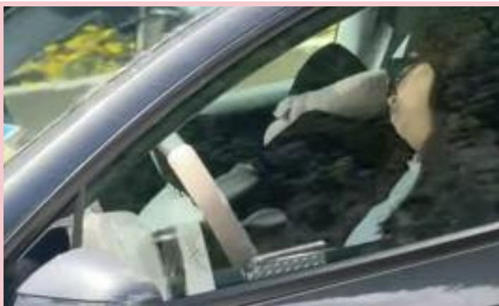
ਟੈਸਲਾ ਕਾਰ ਵਿੱਚ ਡਰਾਈਵਰ ਦੇ ਕਬਿਤ ਤੌਰ 'ਤੇ ਸੁੱਤੇ ਹੋਣ ਸਬੰਧੀ ਵਾਇਰਲ ਵੀਡੀਓ ਦੀ ਇੱਕ ਝਲਕ।

ਬਾਅਦ ਪੁਲਿਸ ਨੇ ਮਾਮਲੇ ਦੀ ਜਾਂਚ ਸ਼ੁਰੂ ਕਰ ਦਿੱਤੀ ਹੈ। ਵੀਡੀਓ ਬਣਾਉਣ ਵਾਲੀ ਕਾਰਲੇ ਕਿੰਗ ਨੇ ਦਾਅਵਾ ਕੀਤਾ ਕਿ ਟੈਸਲਾ ਕਾਰ ਲਗਭਗ 100 ਕਿਲੋਮੀਟਰ ਪ੍ਰਤੀ ਘੰਟਾ ਦੀ ਰਫਤਾਰ ਨਾਲ ਚੱਲ ਰਹੀ ਸੀ। ਉਸ ਨੇ ਇਹ ਵੀ ਕਿਹਾ ਕਿ ਕਾਰ ਦੀ ਪਿਛਲੀ ਸੀਟ 'ਤੇ ਦੋ ਬੱਚੇ ਵੀ ਸਵਾਰ ਸਨ।