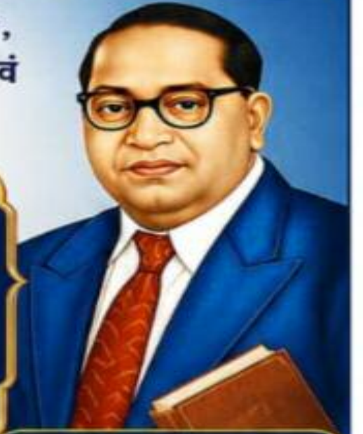
बाबासाहेब डॉ भीमराव अंबेडकर

वर्षों तक बाबासाहेब डॉ भीमराव अंबेडकर जी के करीबी रहे , महान अंबेडकरवादी विचारधारा भीम पत्रिका के संस्थापक एवं आजीवन संपादक सामाजिक न्याय के पुरोधा