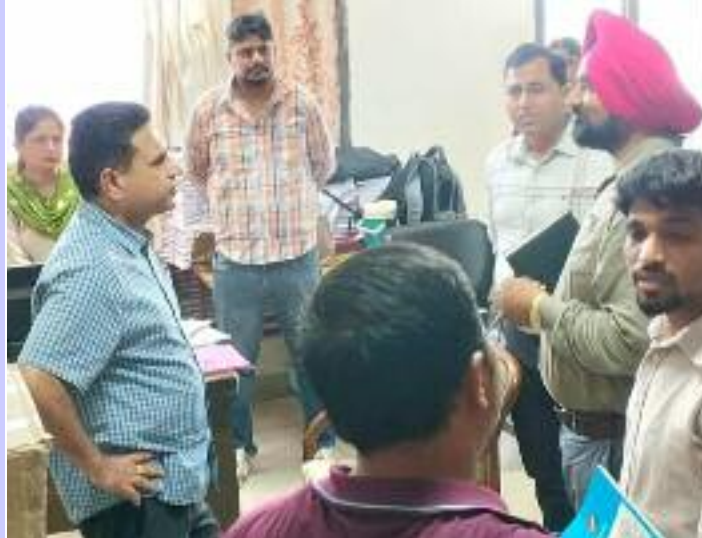
ਪ੍ਰਾਪਤ ਹੋਣ ਵਾਲੀ ਹਰ ਕਾਲ ਦਾ ਤੁਰੰਤ ਅਤੇ ਸੰਤੁਸ਼ਟੀਜਨਕ