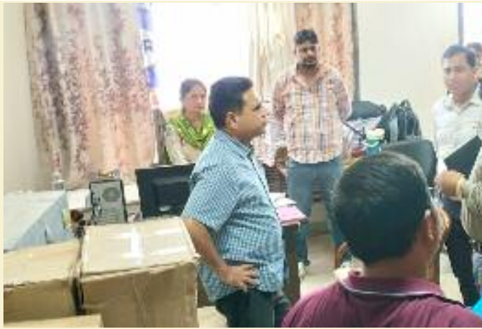
ਮੋਨੀਟਰਿੰਗ ਸੈੱਲ ਪ੍ਰਿੰਟ, ਸਬੰਧੀ ਪ੍ਰਸਾਰਿਤ ਹੋਣ ਵਾਲੀ ਇਲੈਕਟ੍ਰਾਨਿਕ ਅਤੇ ਸੋਸ਼ਲ ਮੀਡੀਆ 'ਤੇ ਐੱਸ.ਆਈ.ਆਰ. ਅਤੇ ਕਿਸੇ ਵੀ ਗੁੰਮਰਾਹਕੁੰਨ ਜਾਂ

ਸਮੀਖਿਆ ਦੌਰਾਨ ਉਨ੍ਹਾਂ ਸਬੰਧਤ ਅਧਿਕਾਰੀਆਂ ਨੂੰ ਨਿਰਦੇਸ਼ ਦਿੱਤੇ ਕਿ ਐੱਸ.ਆਈ.ਆਰ. ਨਾਲ ਸਬੰਧਤ ਹਰ ਪੁੱਛਗਿੱਛ, ਸ਼ਿਕਾਇਤ ਅਤੇ ਬੇਨਤੀ ਦਾ ਨਿਰਧਾਰਤ ਸਮਾਂ-ਸੀਮਾ ਅੰਦਰ ਪੂਰੀ ਪਾਰਦਰਸ਼ਤਾ, ਨਿਰਪੱਖਤਾ ਅਤੇ ਸੰਵੇਦਨਸ਼ੀਲਤਾ ਨਾਲ ਨਿਪਟਾਰਾ ਕਰਨਾ ਯਕੀਨੀ ਬਣਾਇਆ ਜਾਵੇ। ਵਧੀਕ ਜ਼ਿਲ੍ਹਾ ਚੋਣ ਅਫ਼ਸਰ ਨੇ ਕਿਹਾ ਕਿ ਵੋਟਰ ਹੈਲਪਲਾਈਨ-1950 'ਤੇ ਪ੍ਰਾਪਤ ਹੋਣ ਵਾਲੀ ਹਰ ਕਾਲ ਦਾ ਤੁਰੰਤ ਅਤੇ ਸੰਤੁਸ਼ਟੀਜਨਕ