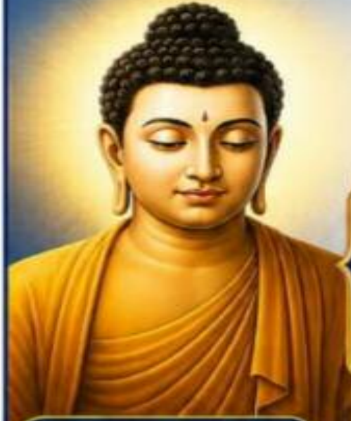
तथागत गौतम बुद्ध

वर्षों तक बाबासाहेब डॉ भीमराव अंबेडकर जी के करीबी रहे , महान अंबेडकरवादी विचारधारा भीम पत्रिका के संस्थापक एवं आजीवन संपादक सामाजिक न्याय के पुरोधा