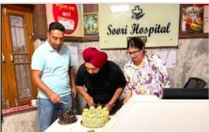
ਵਧਾਈਆਂ ਦਿੱਤੀਆਂ ਅਤੇ ਆਪਣੀਆਂ ਸ਼ੁਭਕਾਮਨਾਵਾਂ ਸਾਂਝੀਆਂ ਕੀਤੀਆਂ। ਸਮਾਗਮ ਦੌਰਾਨ ਹਸਪਤਾਲ ਪ੍ਰਬੰਧਕਾਂ

ਅਤੇ ਸਟਾਫ਼ ਵੱਲੋਂ ਸਾਂਝੇ ਤੌਰ 'ਤੇ ਇਹ ਪ੍ਰਣ ਲਿਆ ਗਿਆ ਕਿ ਉਹ ਭਵਿੱਖ ਵਿੱਚ ਵੀ ਮਾਨ-ਵਤਾ ਦੀ ਸੇਵਾ ਲਈ ਪੂਰੀ ਤਨਦੇਹੀ ਨਾਲ ਡਟੇ ਰਹਿਣਗੇ ਅਤੇ ਮਰੀਜ਼ਾਂ ਨੂੰ ਪਹਿਲਾਂ ਨਾਲੋਂ ਵੀ ਹੋਰ ਵਧੇਰੇ ਚੰਗੇ, ਸੁਚੱਜੇ ਅਤੇ ਆਧੁਨਿਕ ਢੰਗ ਨਾਲ ਸਿਹਤ ਸਹੂਲਤਾਂ ਮੁਹੱਈਆ ਕਰਵਾਉਂਦੇ ਰਹਿਣਗੇ। ਇਸ ਮੌਕੇ ਹਸਪਤਾਲ ਦਾ ਸਮੂਹ ਸਟਾਫ਼ ਹਾਜ਼ਰ ਸੀ, ਜਿਨ੍ਹਾਂ ਨੇ ਮੈਡੀਕਲ ਖੇਤਰ ਵਿੱਚ ਆਪਣਾ ਬਿਹਤਰੀਨ ਯੋਗਦਾਨ ਪਾਉਣ ਦਾ ਅਹਿਦ ਲਿਆ।