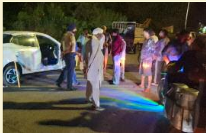
ਪਹੁੰਚੇ ਅਤੇ ਮਾਮਲੇ ਦੀ ਜਾਂਚ ਸ਼ੁਰੂ ਕੀਤੀ। ਆਖਿਰਕਾਰ ਪੁਲਿਸ ਪ੍ਰਸ਼ਾਸਨ ਦੇ ਦਖਲ ਅਤੇ ਸਖਤੀ ਤੋਂ ਬਾਅਦ ਗੱਡੀ ਸਵਾਰ ਨੌਜਵਾਨਾਂ ਨੂੰ ਆਪਣੀ ਗਲਤੀ ਦਾ ਅਹਿਸਾਸ ਹੋਇਆ ਅਤੇ ਉਨ੍ਹਾਂ ਨੇ ਟੋਲ ਪ੍ਰਬੰਧਕਾਂ ਕੋਲੋਂ ਆਪਣੀ ਇਸ ਹਰਕਤ ਲਈ ਮੁਆਫੀ ਮੰਗੀ। ਟੈਕਸੀ ਸਵਾਰਾਂ ਵੱਲੋਂ ਮੁਆਫੀ ਮੰਗੇ ਜਾਣ ਤੋਂ ਬਾਅਦ ਹੀ ਇਹ ਭਖਿਆ ਹੋਇਆ ਮਾਮਲਾ ਪੂਰੀ ਤਰ੍ਹਾਂ ਸ਼ਾਂਤ ਹੋ ਸਕਿਆ।