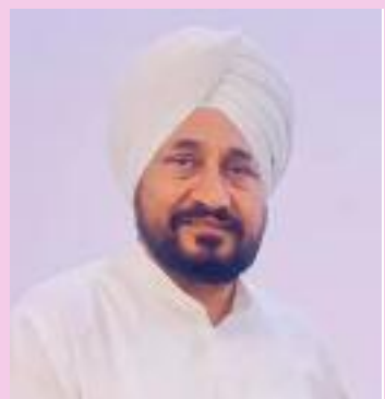
ਵਰਕਰਾਂ ਵਿੱਚ ਭਾਰੀ ਉਤਸ਼ਾਹ ਪਾਇਆ ਜਾ ਰਿਹਾ ਹੈ। ਇਸ ਵਿਸ਼ੇਸ਼ ਚੋਣ ਕਮੇਟੀ ਦੇ