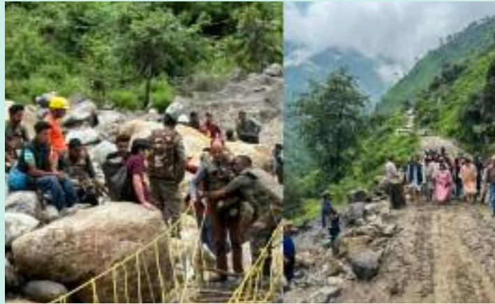
ਦਿੱਤੀ। ਰਾਜ ਆਫ਼ਤ ਦੇ ਅਨੁਸਾਰ, ਮੰਡੀ ਵਿੱਚ 28, ਪ੍ਰਤੀਕਿਰਿਆ ਸੰਚਾਲਨ ਕੇਂਦਰ ਕੁੱਲ ਵਿੱਚ 12 ਅਤੇ ਲਾਹੌਲ

ਆਉਣ ਦੇ ਬਾਵਜੂਦ, ਰਾਹਤ ਦੀ ਕੋਈ ਉਮੀਦ ਨਹੀਂ ਸੀ। ਸਥਾਨਕ ਮੌਸਮ ਵਿਭਾਗ ਨੇ 4 ਜੁਲਾਈ ਨੂੰ ਛੱਡ ਕੇ 2 ਤੋਂ 6 ਜੁਲਾਈ ਦੇ ਵਿਚਕਾਰ ਕੁਝ ਖੇਤਰਾਂ ਵਿੱਚ ਭਾਰੀ ਤੋਂ ਬਹੁਤ ਭਾਰੀ ਮੀਂਹ ਲਈ ਸੰਤਰੀ ਚੇਤਾਵਨੀ ਜਾਰੀ ਕੀਤੀ ਹੈ। ਕਈ ਨਦੀਆਂ ਅਤੇ ਉਨ੍ਹਾਂ ਦੀਆਂ ਸਹਾਇਕ ਨਦੀਆਂ ਵਿੱਚ ਪਾਣੀ ਦਾ ਪੱਧਰ ਵਧ ਗਿਆ। ਉਨ੍ਹਾਂ ਜ਼ਿਲ੍ਹੇ ਵਿੱਚ ਸਵਾਨ ਨਦੀ ਉਫਾਨ 'ਤੇ ਸੀ, ਜਿਸ ਕਾਰਨ ਅਧਿਕਾਰੀਆਂ ਨੇ ਲੋਕਾਂ ਨੂੰ ਨਦੀ ਦੇ ਨੇੜੇ ਨਾ ਜਾਣ ਦੀ ਸਲਾਹ