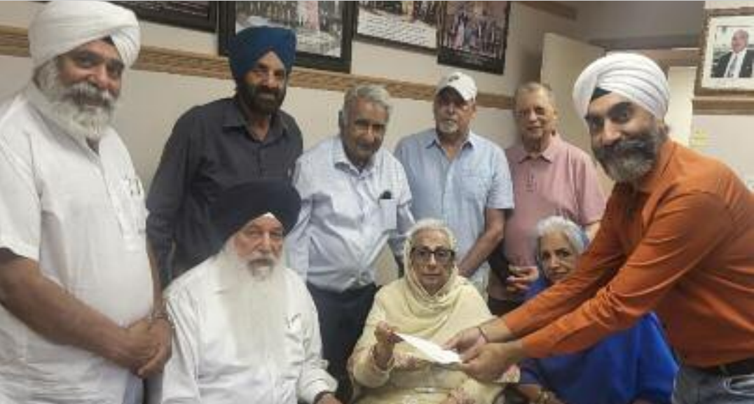
ਚੈੱਕ ਦਿੰਦੇ ਹੋਏ ਰਿਚਮੰਡ ਗੁਰਦੁਆਰਾ ਪ੍ਰਬੰਧਕ ਕਮੇਟੀ ਦੇ ਮੈਂਬਰ।