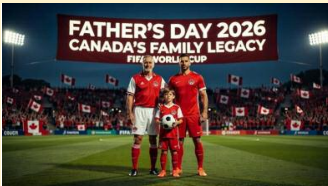
A father and his young son sit on a green sofa wearing red Canadian soccer jerseys, cheering at a large television screen displaying a vibrant green stadium during a tournament match.

National celebrations can also carry a family lesson. Canada Day is more than fireworks and flags. The FIFA World