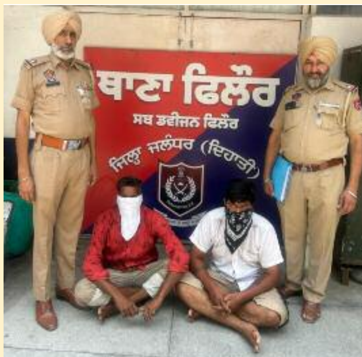
ਗਿਆ ਅਤੇ ਇਸਦੇ ਖਿਲਾਫ 61-85 ਐਨ.ਡੀ.ਪੀ.ਐਸ ਮੁਕੱਦਮਾ ਨੰਬਰ 165 ਮਿਤੀ 18.06.2026 ਜੁਰਮ 22- ਐਕਟ ਥਾਣਾ ਫਿਲੌਰ ਦਰਜ ਰਜਿਸਟਰ ਕੀਤਾ ਗਿਆ।