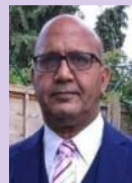
Bal Ram Sampla Geopolitics

1. https://www.parliament.scot/chamber-and-committees/votes-and-motions/S7M-00317?hl=en-