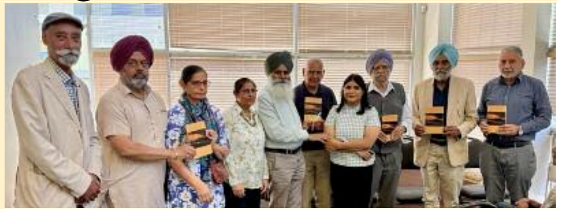
ਸਾਹਿਤਕ ਸਮਾਗਮ ਦੀਆਂ ਵੱਖ ਵੱਖ ਤਸਵੀਰਾਂ।