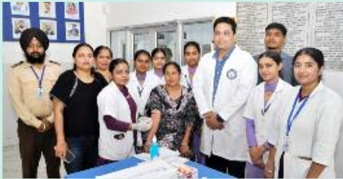
ਗੁਰੂ ਨਾਨਕ ਮਿਸ਼ਨ ਹਸਪਤਾਲ, ਢਾਹਾਂ ਕਲੇਰਾਂ ਵਿਖੇ ਲਗਾਏ ਗਏ ਥਾਇਰਾਇਡ ਅਤੇ ਸ਼ੂਗਰ ਦੇ ਮੁਫਤ ਚੈਕਅੱਪ ਕੈਂਪ ਦੌਰਾਨ ਮਰੀਜ਼ਾਂ ਦੇ ਸੈਂਪਲ ਲੈਂਦੇ ਹੋਏ ਮਾਹਿਰ ਡਾਕਟਰ ਅਤੇ ਸਟਾਫ਼।