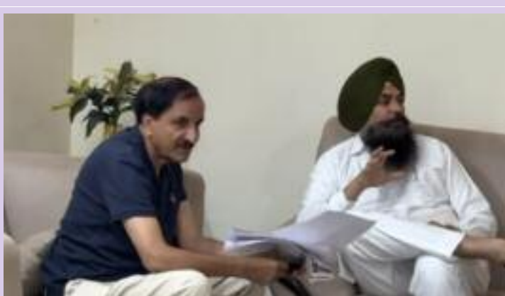
ਵਿਕਾਸ ਕਾਰਜਾਂ ਬਾਰੇ ਵਿਸਥਾਰਪੂਰਵਕ ਚਰਚਾ ਕੀਤੀ ਗਈ। ਇਸ ਮੌਕੇ ਚੇਅਰਮੈਨ ਅਤੇ ਹਾਜ਼ਰ ਸਰਪੰਚਾਂ ਨੇ ਇਲਾਕੇ