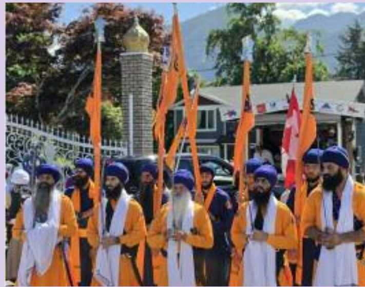
ਕੇਸਰੀ ਦਸਤਾਰਾਂ ਅਤੇ ਕੇਸਰੀ ਚੁੰਨੀਆਂ ਸਜਾਈਆਂ ਬਹੁਗਿਣਤੀ ਸੰਗਤਾਂ ਵੱਲੋਂ ਜੈਕਾਰਿਆਂ ਦੀ ਗੂੰਜ ਨਾਲ ਸਮੁੱਚਾ ਮਾਹੌਲ ਖਾਲਸਾਈ ਰੰਗ ਚ ਰੰਗਿਆ ਮਹਿਸੂਸ

ਗ੍ਰੰਥ ਸਾਹਿਬ ਜੀ ਦੀ ਪਾਵਨ ਛਤਰ-ਛਾਇਆ ਵਿੱਚ ਆਰੰਭ ਹੋਇਆ ਇਹ ਨਗਰ ਕੀਰਤਨ ਵਿਕਟੋਰੀਆ ਸਟਰੀਟ ਵਿਨੀਪੈਗ ਸਟਰੀਟ, ਕਲੇ ਵਲੋ ਡ ਐਵਨਿਊ, ਮੇਨ ਸਟਰੀਟ ਅਤੇ ਥਰਡ ਐਵਨਿਊ ਤੋਂ ਹੁੰਦਾ ਹੋਇਆ ਸ਼ਾਮ ਵੇਲੇ ਗੁਰਦੁਆਰਾ ਸਾਹਿਬ ਵਿਖੇ ਸਮਾਪਤ ਹੋਇਆ ਸ਼ਹਿਰ ਦੇ ਮੁੱਖ ਮਾਰਗਾਂ ਤੋਂ ਹੁੰਦਾ ਹੋਇਆ। ਨਗਰ ਕੀਰਤਨ ਦੌਰਾਨ ਵੱਖ-ਵੱਖ ਢਾਡੀ ਕਵੀਸ਼ਰੀ ਅਤੇ ਹੋਰਨਾਂ ਪ੍ਰਚਾਰਕਾਂ ਵੱਲੋਂ ਜਿੱਥੇ ਸੰਗਤਾਂ ਨੂੰ ਗੁਰੂ ਇਤਿਹਾਸ ਨਾਲ ਜੋੜਿਆ ਗਿਆ ਉੱਥੇ