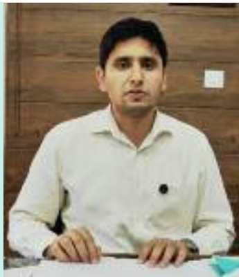
ਵੱਲੋਂ ਤਿੰਨ ਥਾਵਾਂ 'ਤੇ ਨਾਮਜ਼ਦਗੀ ਕੇਂਦਰ ਸਥਾਪਿਤ ਕੀਤੇ ਗਏ ਹਨ।