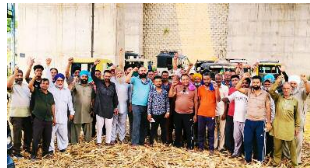
ਸਰਕਾਰ ਵੱਲੋਂ ਠੋਸੀ ਜਾ ਰਹੀ ਕੌਮੀ ਸੁਰੱਖਿਆ ਏਜੰਸੀ ਨੂੰ ਭੰਗ ਰਾਜ ਵਿੱਚ ਆਉਣ ਲਈ ਰਾਜ ਸਿੱਖਿਆ ਨੀਤੀ ਰੱਦ ਕਰਨ, ਕਰਨ ਅਤੇ ਸੀ.ਬੀ.ਆਈ. ਦੇ ਸਰਕਾਰ ਦੀ ਮਨਜ਼ੂਰੀ ਲਾਜ਼ਮੀ

ਅਤੇ ਫੈਡਰਲ ਢਾਂਚੇ ਉੱਤੇ ਤਿੱਖੇ ਹਮਲੇ ਕੀਤੇ ਜਾ ਰਹੇ ਹਨ। ਬੇਰੁਜ਼ਗਾਰੀ, ਮਹਿੰਗਾਈ ਸਿਖਰਾਂ ਫੂਹ ਰਹੀ ਹੈ। ਉਹਨਾਂ ਕਿਹਾ ਕਿ ਪੰਜਾਬ ਦੇ ਪਾਣੀਆਂ ਦਾ ਮਸਲਾ ਰਿਪੇਰੀਅਨ ਅਸੂਲ ਅਨੁਸਾਰ ਹੱਲ ਕਰਨ, ਪੰਜਾਬ ਦੇ ਹੈਂਡਵਰਕਸ ਦਾ ਪ੍ਰਬੰਧ ਪੰਜਾਬ ਦੇ ਹਵਾਲੇ ਕਰਨ, ਭਾਖੜਾ ਬਿਆਸ ਮੈਨੇਜਮੈਂਟ ਬੋਰਡ ਭੰਗ ਕਰਨ, ਦਰਿਆਈ ਪਾਣੀਆਂ ਅਤੇ ਡੈਮਾਂ 'ਚ ਕੇਂਦਰ ਦੀ ਦਖਲਅੰਦਾਜ਼ੀ ਖਤਮ ਕਰਕੇ ਇਨ੍ਹਾਂ ਨੂੰ ਸੂਬਿਆਂ ਦੇ ਅਧਿਕਾਰ ਖੇਤਰ 'ਚ ਲਿਆਉਣ, ਡੈਮ ਸੇਫਟੀ ਐਕਟ ਖਤਮ ਕਰਨ, ਪੰਜਾਬੀ ਬੋਲਣ ਵਾਲੇ ਇਲਾਕੇ ਪੰਜਾਬ ਵਿਚ ਸ਼ਾਮਲ ਕਰਨ, ਪੰਜਾਬ ਦੀ ਰਾਜਧਾਨੀ ਵਜੋਂ ਉਸਾਰੇ ਚੰਡੀਗੜ੍ਹ ਨੂੰ ਪੰਜਾਬ ਦੇ ਹਵਾਲੇ ਕੀਤਾ ਕਰਨ, ਕੇਂਦਰ