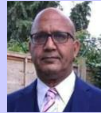
Bal Ram Sampla Geopolitics

Source 1. https://www.parliament.scot/chamber-and-committees/votes-and-motions/S7M-00317?hl=en