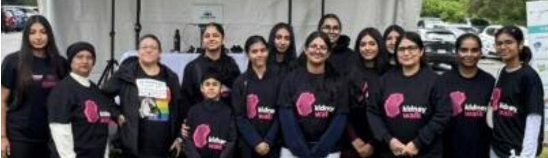
ਕੈਨੇਡੀਅਨ ਕਿਡਨੀ ਵਾਕ ਦੌਰਾਨ ਸ਼ਮੂਲੀਅਤ ਕਰਨ ਵਾਲੇ ਐਲ. ਏ. ਮੈਥੋਸਨ ਸੈਕੰਡਰੀ ਸਕੂਲ ਦੇ ਬੱਚੇ।

ਵੈਨਕੂਵਰ, 16 ਜੂਨ (ਮਲਕੀਤ ਸਿੰਘ) - ਕੈਨੇਡਾ ਦੇ ਸੂਬੇ ਬ੍ਰਿਟਿਸ਼ ਕੋਲੰਬੀਆ ਦੇ ਸਰੀ ਸ਼ਹਿਰ ਸਥਿਤ ਐਲ. ਏ. ਮੈਥੋਸਨ ਸੈਕੰਡਰੀ ਸਕੂਲ ਦੇ ਬੱਚਿਆਂ ਨੇ ਕੈਨੇਡੀਅਨ ਕਿਡਨੀ ਵਾਕ ਲਈ 1,157 ਡਾਲਰ ਇਕੱਠੇ ਕਰਕੇ ਸਮਾਜ ਸੇਵਾ ਦੀ ਮਿਸਾਲ ਪੇਸ਼ ਕੀਤੀ ਹੈ। ਜਾਣਕਾਰੀ ਅਨੁਸਾਰ ਸਕੂਲ ਦੇ ਵਿਦਿਆਰਥੀਆਂ ਅਤੇ ਸਟਾਫ ਮੈਂਬਰਾਂ ਨੇ 7 ਜੂਨ ਨੂੰ