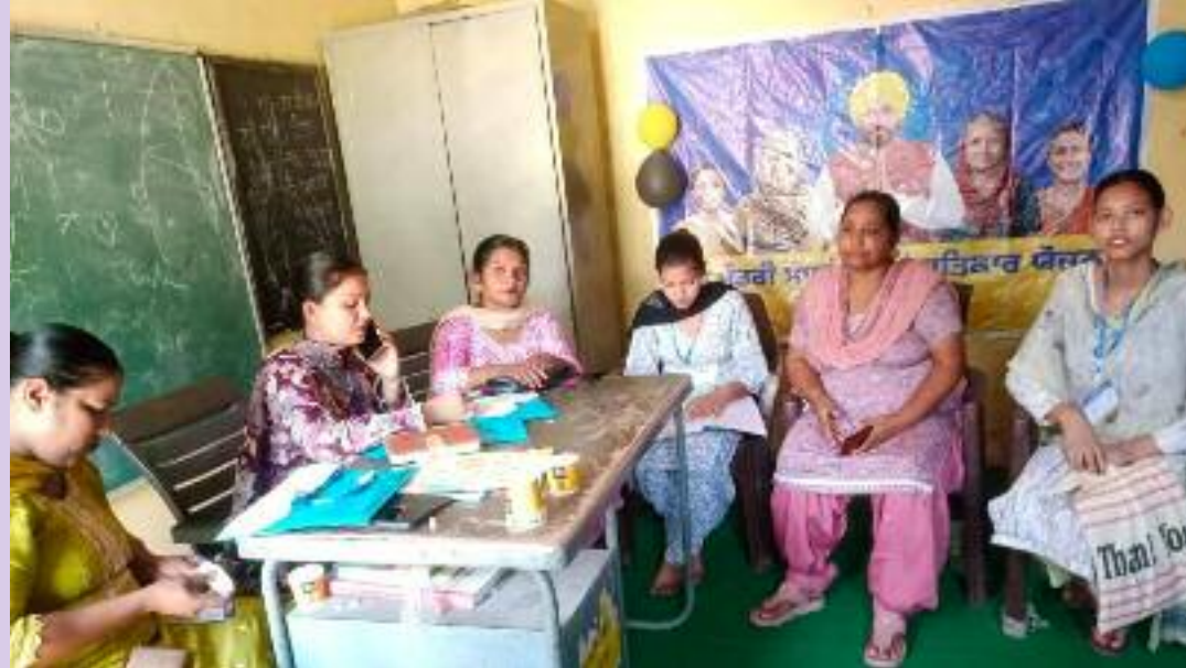
ਦੀ ਜਾਣਕਾਰੀ ਅਤੇ ਹੋਰ ਲੋੜੀਂਦੇ ਦਸਤਾਵੇਜ਼ ਦੱਸਿਆ ਕਿ ਯੋਜਨਾ ਅਧੀਨ 18 ਸਾਲ ਤੋਂ ਨਾਲ ਲਿਆਉਣ ਲਈ ਕਿਹਾ ਗਿਆ। ਉਨ੍ਹਾਂ ਵੱਧ ਉਮਰ ਦੀਆਂ ਮਹਿਲਾਵਾਂ ਅਤੇ