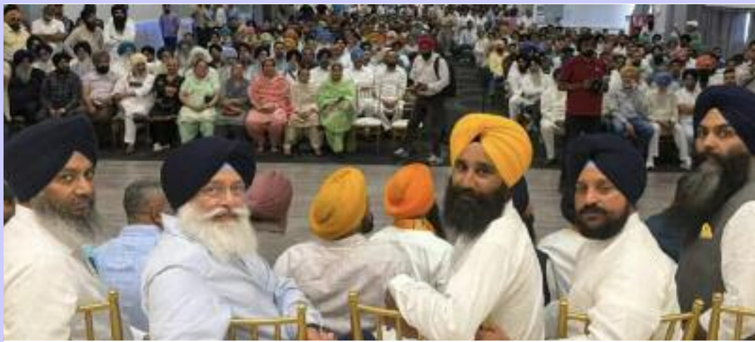
ਅਕਾਲੀ ਦਲ ਦੀ ਰੈਲੀ ਦੀ ਇੱਕ ਤਸਵੀਰ।

ਵਜਨਬੱਧ ਹੈ ਵੱਖ ਵੱਖ ਬੁਲਾਰਿਆਂ ਨੇ ਆਪਣੀਆਂ ਸੰਖੇਪ ਤਕਰੀਰਾਂ ਦੌਰਾਨ ਪੰਜਾਬ ਚ ਵਿਗੜ ਚੁੱਕੇ ਆ ਹਾਲਾਤਾਂ ਦਾ ਜ਼ਿਕਰ ਕਰਦਿਆਂ ਦਾਅਵਾ ਕੀਤਾ ਕਿ ਆਮ ਆਦਮੀ ਪਾਰਟੀ ਦੀ ਸਰਕਾਰ ਆਪਣੇ ਵਾਅਦਿਆਂ ਤੇ ਖਰੀ ਨਹੀਂ ਉਤਰੀ ਅਤੇ ਹੁਣ ਪੰਜਾਬ ਦੇ ਲੋਕ ਇਸ ਤੋਂ ਨਿਜਾਤ ਚਾਹੁੰਦੇ ਹਨ ਜਿਸ ਕਾਰਨ ਆਉਣ ਵਾਲੀਆਂ ਵਿਧਾਨ ਸਭਾ ਚੋਣਾਂ ਚ ਸ਼੍ਰੋਮਣੀ ਅਕਾਲੀ ਦਲ ਦੇ ਪ੍ਰਧਾਨ ਸੁਖਬੀਰ ਸਿੰਘ ਬਾਦਲ ਦੀ ਅਗਵਾਈ ਚ ਅਕਾਲੀ ਦਲ ਦੀ ਸਰਕਾਰ ਬਣਨੀ ਤੈਅ ਹੈਕਰਨ। ਉਨ੍ਹਾਂ ਕਿਹਾ ਕਿ ਸ਼੍ਰੋਮਣੀ ਅਕਾਲੀ ਦਲ ਪੰਜਾਬ ਦੇ ਲੋਕਾਂ ਦੀਆਂ