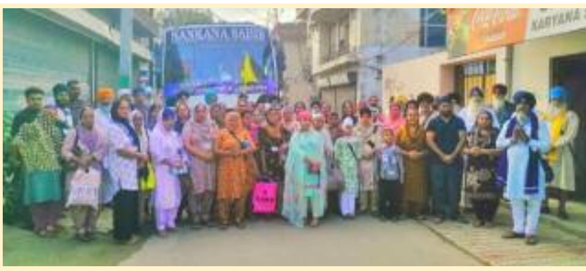
ਗੁਰਦੁਆਰਾ ਜਨਮ ਅਸਥਾਨ ਭਾਈ ਗੁਰਦੁਆਰਾ ਗੁਰੂ ਨਾਨਕ ਸਾਹਿਬ ਸਿੰਘ ਜੀ, ਗੁਰਦੁਆਰਾ ਚਾਰ ਸਾਹਿਬਜ਼ਾਦੇ, ਗੁਪਤਸਰ ਸਾਹਿਬ, ਗੁਰਦੁਆਰਾ ਗੁਰੂ ਪੁਲੀਆ, ਗੁਰਦੁਆਰਾ ਬਾਬਾ ਬੁੱਢਾ ਸਾਹਿਬ ਇੰਦੌਰ, ਗੁਰਦੁਆਰਾ ਦਾਤਾ

ਸਾਹਿਬ, ਜੋਤੀ ਸਰੂਪ ਸਾਹਿਬ, ਗੁਰੂ ਕਾ ਤਾਲ ਆਗਰਾ, ਗੁ ਦਮਦਮਾ ਸਾਹਿਬ ਆਗਰਾ, ਸ਼ੇਰ ਸ਼ਿਕਾਰ ਸਾਹਿਬ ਮਚਕੁੰਡ, ਗੁ ਸ਼ਿਵਪੁਰੀ, ਦਮਦਮਾ ਸਾਹਿਬ ਬਿਆਵਰਾ, ਗੁਰੂ ਨਾਨਕ ਘਾਟ ਉਜੈਨ, ਗੁਰਦੁਆਰਾ ਪ੍ਰਭੂ ਮਿਲਾਪ ਬਲਵਾੜਾ, ਬੜੀ ਸੰਗਤ ਸਾਹਿਬ ਬੁਰਹਾਨਪੁਰ, ਗੁਰਦੁਆਰਾ ਬਾਬਾ ਨਾਮਦੇਵ ਬਰਸੀ, ਘਰ ਬਾਬਾ ਨਾਮਦੇਵ ਜੀ, ਗੁਰਦੁਆਰਾ ਲੰਗਰ ਸਾਹਿਬ, ਤਖ਼ਤ ਸੱਚਖੰਡ ਸ੍ਰੀ ਹਜ਼ੂਰ ਸਾਹਿਬ ਤੇ ਨਾਂਦੇੜ ਸਾਹਿਬ ਹੋਰ ਗੁਰਦੁਆਰੇ, ਨਾਨਕ ਝੀਰਾ ਸਾਹਿਬ, ਗੁਰਦੁਆਰਾ ਮਾਤਾ ਭਾਗ ਕੌਰ,