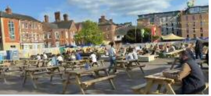
ਲੈਸਟਰ ਵਿਖੇ ਸਿਟੀ ਕੌਂਸਲ ਵੱਲੋਂ ਲਗਾਈ ਗਈ ਵਿਸ਼ਾਲ ਸਕਰੀਨ 'ਤੇ ਫੀਫਾ ਵਿਸ਼ਵ ਕੱਪ ਦੇ ਮੈਚਾਂ ਦਾ ਆਨੰਦ ਮਾਣਦੇ ਹੋਏ ਫੁੱਟਬਾਲ ਪ੍ਰੇਮੀ।