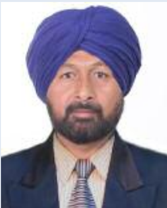
ਨੂੰ ਬੇਨਤੀ ਹੈ ਕਿ ਸਭ ਤੋਂ ਪਹਿਲਾਂ ਆਪਣੇ ਬਲਾਕ ਪ੍ਰਧਾਨਾਂ ਦੇ ਪਿੰਡਾਂ 'ਚੋਂ ਨਸ਼ਾ ਖ਼ਤਮ ਕਰਵਾਓ, ਫਿਰ

ਵਰਕਰ ਹੀ ਸੰਤੁਸਟ ਨਹੀਂ ਹੈ ਲੋਕ ਹੁਣ ਸਿਆਣੇ ਹੋ ਚੁੱਕੇ ਹਨ ਹੁਣ ਲੋਕ ਤੁਹਾਡੀਆਂ ਲੁਮਤ ਚਾਲਾਂ ਚ ਨਹੀਂ ਫਸਣਗੇ ਅਤੇ ਨਾ ਹੀ ਤੁਹਾਡੀਆਂ ਮਿਠੀਆਂ ਗੱਲਾਂ 'ਚ ਨਹੀਂ ਆਉਣਗੇ। ਆਮ ਆਦਮੀ ਪਾਰਟੀ ਦੀ ਸਰਕਾਰ ਇੱਕ ਪਾਸੇ ਦਾਅਵਾ ਕਰਦੀ ਹੈ ਕਿ ਪੰਜਾਬ 'ਚ ਨਸ਼ਾ ਖ਼ਤਮ ਹੋ ਚੁੱਕਾ ਹੈ, ਪਰ ਦੂਜੇ ਪਾਸੇ ਉਹਨਾਂ ਦੇ ਆਪਣੇ ਬਲਾਕ ਪ੍ਰਧਾਨ ਹੀ ਜਨਤਕ ਤੌਰ 'ਤੇ ਕਹਿ ਰਹੇ ਹਨ ਕਿ ਉਹਨਾਂ ਦੇ ਪਿੰਡ 'ਚ ਨਸ਼ਾ ਅਜੇ ਵੀ ਆਮ ਵਿਕ ਰਿਹਾ ਹੈ। ਇਸ ਲਈ ਮੇਰੀ ਪੰਜਾਬ ਸਰਕਾਰ