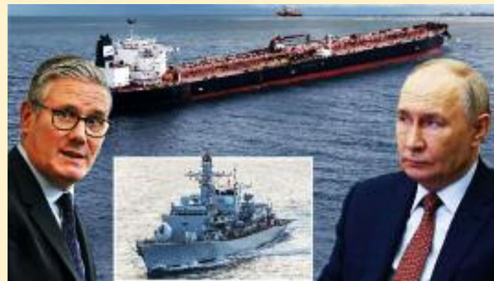
ਰੂਸੀ 'ਸ਼ੈਡੋ ਫਲੀਟ' ਦੇ ਤੇਲ ਟੈਂਕਰ ਨੂੰ ਰੋਕਣ ਲਈ ਭੇਜਿਆ ਗਿਆ ਰਾਇਲ ਨੇਵੀ ਦਾ ਜੰਗੀ ਜਹਾਜ਼ ਐਚਐਮਐਸ ਸਦਰਲੈਂਡ।

ਸ਼ਾਮਲ ਹੁੰਦੇ ਹਨ, ਜੋ ਅੰਤਰਰਾਸ਼ਟਰੀ ਪਾਬੰਦੀਆਂ ਤੋਂ ਬਚ ਕੇ ਰੂਸੀ ਤੇਲ ਦੀ ਵੁਆਈ ਕਰਦੇ ਹਨ। ਇਹ ਜਹਾਜ਼ ਅਕਸਰ ਆਪਣੇ ਟਰੈਕਿੰਗ ਸਿਸਟਮ ਬੰਦ ਕਰ ਦਿੰਦੇ ਹਨ, ਝੂਠੀ ਸਥਿਤੀ ਦਿਖਾਉਂਦੇ ਹਨ ਅਤੇ ਸਮੁੰਦਰ ਵਿੱਚ ਹੀ ਇੱਕ ਜਹਾਜ਼ ਤੋਂ ਦੂਜੇ ਜਹਾਜ਼ ਵਿੱਚ ਤੇਲ ਤਬਦੀਲ ਕਰਕੇ ਉਸ ਦੇ ਅਸਲ ਸਰੋਤ ਨੂੰ ਲੁਕਾਉਣ ਦੀ ਕੋਸ਼ਿਸ਼ ਕਰਦੇ ਹਨ। ਨਵੇਂ ਰੱਖਿਆ ਸਕੱਤਰ ਡੈਨ