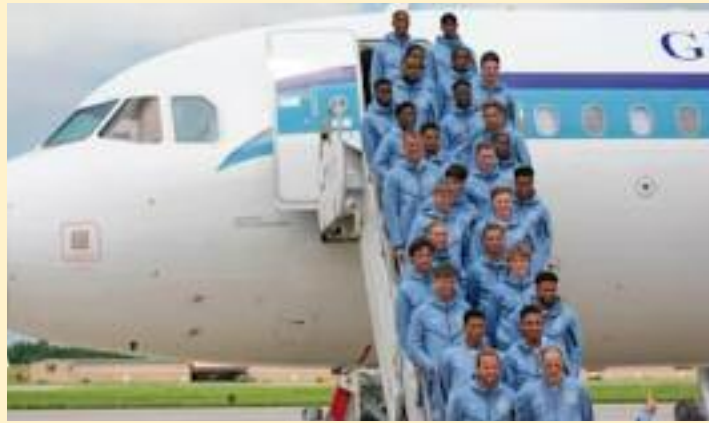
ਵਿਸ਼ਵ ਕੱਪ 2026 ਦੀਆਂ ਤਿਆਰੀਆਂ ਲਈ ਅਮਰੀਕਾ ਦੇ ਕੈਨਸਸ ਸਿਟੀ ਪਹੁੰਚੀ ਇੰਗਲੈਂਡ ਫੁੱਟਬਾਲ ਟੀਮ ਦੇ ਖਿਡਾਰੀ।

ਸਕਦੀਆਂ ਹਨ। ਕੋਚ ਥਾਮਸ ਟੂਚਲ ਦੀ ਅਗਵਾਈ ਹੇਠ ਇੰਗਲੈਂਡ ਦੀ ਟੀਮ ਫਲੋਰਿਡਾ ਵਿੱਚ ਦੋ ਦਿਨ ਬਿਤਾਉਣ ਤੋਂ ਬਾਅਦ ਕੈਨਸਸ ਸਿਟੀ ਪਹੁੰਚੀ ਸੀ, ਜਿੱਥੇ ਖਿਡਾਰੀਆਂ ਨੇ ਆਪਣਾ ਪਹਿਲਾ ਅਭਿਆਸ ਸੈਸ਼ਨ ਵੀ ਕੀਤਾ। ਹਾਲਾਂਕਿ ਕੁਝ ਘੰਟਿਆਂ ਬਾਅਦ ਹੀ ਮੌਸਮ ਵਿਭਾਗ ਨੇ ਇਲਾਕੇ ਵਿੱਚ ਭਾਰੀ ਮੀਂਹ, ਤੇਜ਼ ਹਵਾਵਾਂ ਅਤੇ ਬਵੰਡਰ ਆਉਣ ਦੀ ਸੰਭਾਵਨਾ ਜਤਾਈ।