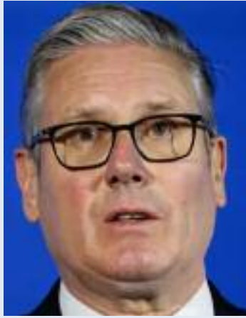
ਧਮਕਾਉਣ ਵਾਲੀ ਹਿੰਸਾ

ਜ਼ਿੰਮੇਵਾਰ ਲੋਕਾਂ ਨੂੰ ਕਾਨੂੰਨ ਦੀ ਪੂਰੀ ਸਖ਼ਤੀ ਦਾ ਸਾਹਮਣਾ ਕਰਨਾ ਪਵੇਗਾ। ਉਨ੍ਹਾਂ ਸੋਸ਼ਲ ਮੀਡੀਆ ਪਲੇਟਫਾਰਮ ਐਕਸ 'ਤੇ ਜਾਰੀ ਇਕ ਬਿਆਨ ਵਿਚ ਕਿਹਾ ਕਿ ਬੈਲਫਾਸਟ ਵਿਚ ਵਾਪਰੀਆਂ ਘਟਨਾਵਾਂ ਹੈਰਾਨ ਕਰਨ ਵਾਲੀਆਂ ਅਤੇ ਪੂਰੀ ਤਰ੍ਹਾਂ ਅਸਵੀਕਾਰਯੋਗ ਹਨ। ਸਟਾਰਮਰ ਨੇ ਕਿਹਾ ਕਿ ਭਾਈਚਾਰਿਆਂ ਨੂੰ ਡਰਾਉਣ-