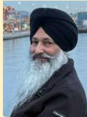
ਸਮਾਜ ਵੀਕਲੀ ਨਿਊਜ਼

'ਭੁੱਲੜ' ਆਖਦਾ ਬੰਦੇ ! ਯਾਦ ਰੱਖੀਂ, ਸੱਚਾ ਰੱਬ ਰੱਖੇ ਲਾਜ ਨਿਮਾਣਿਆਂ ਦੀ।