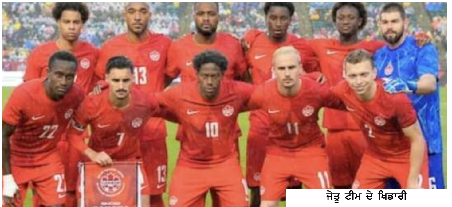
ਜੇਤੂ ਟੀਮ ਦੇ ਖਿਡਾਰੀ