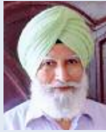
ਸਮਾਜ ਵੀਕਲੀ ਨਿਊਜ਼

ਆਮ ਬੰਦੇ ਦਾ ਜੀਣਾ ਦੁੱਭਰ , ਜਦ ਕਰਦੀਆਂ ਸਰਕਾਰਾਂ । ਹੜ੍ਹ ਵਾਂਗੂੰ ਆ ਜਾਣ ਬਾਜ਼ਾਰੀਂ , ਚੁੰਨੀਆਂ ਤੇ ਦਸਤਾਰਾਂ । ਫਿਰ ਇੱਕੋ ਹੱਲ ਰਹਿ ਜਾਂਦਾ ਏ, ਏਕੇ ਤੇ ਸੰਘਰਸ਼ਾਂ ਦਾ , ਪੁਲਿਸ ਫੌਜ ਤੋਂ ਕਦੋਂ ਰੁਕਦੀਆਂ, ਸਿਰਲੱਥਾਂ ਦੀਆਂ ਡਾਰਾਂ ।