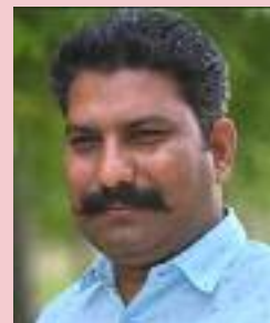
ਸਮਾਜ ਵੀਕਲੀ ਨਿਊਜ਼

'ਖਿੱਚੀ' ਬਣ ਕੇ ਬਲਣਾ ਪੈਣਾ, ਜੇ ਸੱਚ ਦਾ ਰਸਤਾ ਚੁਣਿਆ ਹੈ, ਇਹ ਇਸ਼ਕ ਨਹੀਂ ਹੈ ਆਸਾਨ, ਇਹ ਖੇਡ ਕੋਈ ਅਦੀਬ ਨਹੀਂ।