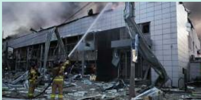
ਰਿਹਾਇਸ਼ੀ ਇਮਾਰਤਾਂ ਹਮਲੇ ਦੀ ਲਪੇਟ ਵਿੱਚ ਆਈਆਂ ਹਨ। ਪੋਦਿਲਸਕੀ ਜ਼ਿਲ੍ਹੇ ਵਿੱਚ ਇੱਕ 9 ਮੰਜ਼ਿਲਾ ਇਮਾਰਤ ਦੇ ਉੱਪਰਲੇ

ਹੋਣ ਕਾਰਨ ਵੱਡੀ ਗਿਣਤੀ ਵਿੱਚ ਲੋਕ ਮਲਬੇ ਹੇਠਾਂ ਫਸੇ ਹੋਏ ਹਨ। ਯੂਕ੍ਰੇਨ ਦੀ ਰਾਜਧਾਨੀ ਕੀਵ ਦੇ ਲਗਭਗ 8 ਜ਼ਿਲ੍ਹਿਆਂ ਵਿੱਚ ਰੂਸੀ ਮਿਜ਼ਾਈਲਾਂ ਨੇ ਨਾਗਰਿਕ ਬੁਨਿਆਦੀ ਢਾਂਚੇ ਅਤੇ ਉੱਚੀਆਂ ਰਿਹਾਇਸ਼ੀ ਇਮਾਰਤਾਂ ਨੂੰ ਬੁਰੀ ਤਰ੍ਹਾਂ ਨੁਕਸਾਨ ਪਹੁੰਚਾਇਆ ਹੈ। ਇਕੱਲੇ ਕੀਵ ਵਿੱਚ 4 ਲੋਕਾਂ ਦੀ ਮੌਤ ਹੋਈ ਹੈ ਅਤੇ 3 ਬੱਚਿਆਂ ਸਮੇਤ 58 ਲੋਕ ਜ਼ਖਮੀ ਹੋਏ ਹਨ, ਜਦਕਿ ਸੋਲੋਮੀਅਨਸਕੀ ਜ਼ਿਲ੍ਹੇ ਵਿੱਚ 20 ਅਤੇ 24 ਮੰਜ਼ਿਲਾ