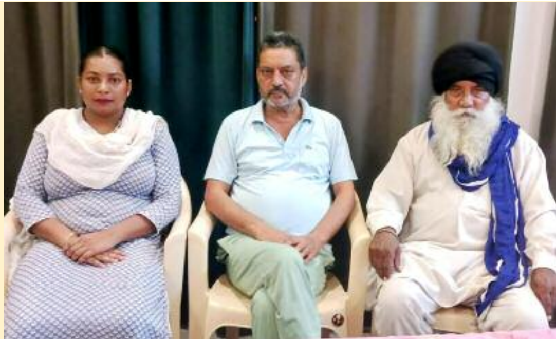
ਨੋਟੀਫਿਕੇਸ਼ਨ ਇਸਦੀ ਪ੍ਰਤੱਖ ਉਦਾਹਰਣ ਹੈ। ਆਗੂਆਂ ਨੇ ਕਿਹਾ ਕਿ ਜਦੋਂ ਪੰਜਾਬ ਸਰਕਾਰ ਇਹ ਜੀ ਰਾਮ ਜੀ ਦੇ ਕੰਮ ਦੀ ਵਾਲੀਆ ਹੋਣ ਕੰਢੇ ਹੈ ਤਾਂ ਵਿੱਚ 40 ਫੀਸਦ ਹਿੱਸਾ ਕਿੱਥੋਂ

ਜੀ ਨਵਾਂ ਕਾਨੂੰਨ ਲਿਆਕੇ ਦੇਸ਼ ਦੇ ਕੇਂਦਰ ਮਜ਼ਦੂਰਾਂ ਅਤੇ ਮੁਲਾਜ਼ਮਾਂ ਦੇ ਚੁੱਲ੍ਹੇ ਠੰਡੇ ਕਰਨ ਦੇ ਰਾਹ ਪੈ ਗਈ ਹੈ ਜਦਕਿ ਪੰਜਾਬ ਸਰਕਾਰ ਦੇ ਪੇਂਡੂ ਵਿਕਾਸ ਅਤੇ ਪੰਚਾਇਤ ਵਿਭਾਗ ਨੇ ਨੋਟੀਫਿਕੇਸ਼ਨ ਜਾਰੀ ਕਰਕੇ ਇਸਨੂੰ ਪੰਜਾਬ ਵਿੱਚ ਪਹਿਲੀ ਜੁਲਾਈ ਤੋਂ ਲਾਗੂ ਕਰਨ ਦਾ ਐਲਾਨ ਕੀਤਾ ਹੈ। ਇਹ ਉਹੀ ਆਮ ਆਦਮੀ ਪਾਰਟੀ ਦੀ ਸਰਕਾਰ ਹੈ ਜਿਸਨੇ ਪਿੱਛੇ ਜਿਹੇ ਪੰਜਾਬ ਵਿਧਾਨ ਸਭਾ ਵਿੱਚ ਪੰਜਾਬ ਅੰਦਰ ਜੀ ਰਾਮ ਜੀ ਕਾਨੂੰਨ ਨਾ ਲਾਗੂ ਕਰਨ ਦਾ ਮਤਾ ਪਾਸ ਕੀਤਾ ਸੀ। ਇਹ ਸਰਕਾਰ ਕਿਸ ਤਰ੍ਹਾਂ ਆਪਣੇ ਹੀ ਫੈਸਲਿਆਂ ਤੋਂ ਪਲਟੀ ਮਾਰਦੀ ਹੈ, ਤਾਜ਼ਾ