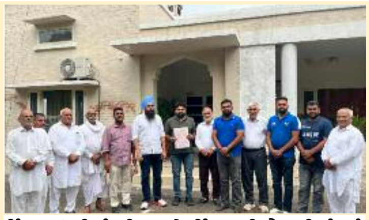
ਪਿੰਡ ਬਣਾਂ ਦੀ ਪੰਚਾਇਤ ਅਤੇ ਪਿੰਡ ਵਾਸੀ ਐਮ ਪੀ ਕੰਗ ਨੂੰ ਮੰਗ ਪੱਤਰ ਦਿੰਦੇ ਹੋਏ ।

ਨੂੰ ਸੌਂਪੇ ਗਏ ਮੰਗ ਪੱਤਰ ਵਿੱਚ ਪਿੰਡ ਬਣਾਂ (ਜ਼ਿਲ੍ਹਾ ਸ਼ਹੀਦ ਭਗਤ ਸਿੰਘ ਨਗਰ) ਦੇ ਕਿਸਾਨਾਂ ਨੇ ਦੱਸਿਆ ਕਿ ਉਨ੍ਹਾਂ ਦਾ ਪਿੰਡ ਕੰਡੀ ਇਲਾਕੇ ਅਤੇ ਪੱਛੋਂ ਖੇਤਰ ਵਿੱਚ ਆਉਂਦਾ ਹੈ, ਜਿਸ ਕਾਰਨ ਇੱਥੋਂ ਦੇ ਜ਼ਿਆਦਾਤਰ ਲੋਕਾਂ ਦੀ ਆਰਥਿਕਤਾ ਅਤੇ ਰੋਜ਼ੀ-ਰੋਟੀ ਪੂਰੀ ਤਰ੍ਹਾਂ ਖੇਤੀਬਾੜੀ 'ਤੇ ਨਿਰਭਰ ਹੈ। ਪੰਚਾਇਤ ਨੇ ਦੱਸਿਆ ਕਿ ਪਿੰਡ ਦੀ ਇੱਕ ਬਹੁਤ ਵੱਡੀ ਮਾਤਰਾ ਵਿੱਚ ਖੇਤੀਯੋਗ ਜ਼ਮੀਨ ਸਿੰਚਾਈ ਦੀ ਸਹੂਲਤ ਨਾ ਹੋਣ ਕਾਰਨ ਲੰਬੇ ਸਮੇਂ ਤੋਂ ਬੰਜਰ ਪਈ ਹੋਈ ਹੈ। ਸਿੰਚਾਈ ਦੇ ਢੁਕਵੇਂ ਸਾਧਨ ਨਾ ਹੋਣ ਕਾਰਨ ਖੇਤੀ ਅਤੇ ਕਿਸਾਨਾਂ ਦੀ ਆਰਥਿਕ ਹਾਲਤ ਲਗਾਤਾਰ ਖਰਾਬ ਹੋ ਰਹੀ ਹੈ। ਇਲਾਕੇ ਦੇ ਕਿਸਾਨ ਆਰਥਿਕ ਤੌਰ 'ਤੇ ਇੰਨੇ ਕਮਜ਼ੋਰ ਹੋ ਚੁੱਕੇ ਹਨ ਕਿ ਉਹ ਆਪਣੇ ਨਿੱਜੀ