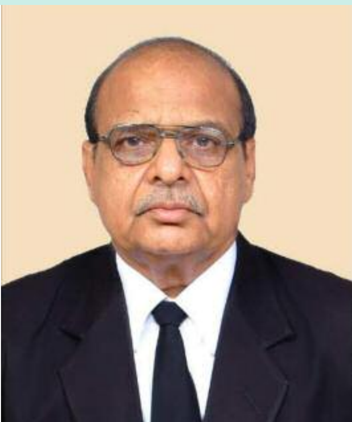
ਮਿੱਤਰ ਸੈਨ ਮੀਤ

ਸੰਭਾਵਨਾ ਹੈ? ਇਹ ਪੁੱਛੇ ਜਾਣ 'ਤੇ ਪ੍ਰਬੰਧਕੀ ਬੋਰਡ ਦੇ ਕੁਝ ਮਿੱਤਰ ਮੈਂਬਰਾਂ ਵੱਲੋਂ ਦੱਸਿਆ ਗਿਆ ਕਿ ਮੁੱਖ ਸੋਧ ਅਹੁਦੇਦਾਰਾਂ ਦੇ ਚੋਣ ਲੜਨ ਵਾਲੀਆਂ ਯੋਗਤਾ ਸ਼ਰਤਾਂ ਵਿੱਚ ਕੀਤੀ ਜਾ ਸਕਦੀ ਹੈ ਅਤੇ ਅਕਾਦਮੀ ਦੇ ਪ੍ਰਬੰਧਕੀ ਬੋਰਡ ਦੀ ਮਿਆਦ ਦੋ ਸਾਲ ਤੋਂ ਵਧਾ ਕੇ ਤਿੰਨ ਜਾਂ ਚਾਰ ਸਾਲ ਕਰਨ ਦੀ ਸੰਭਾਵਨਾ ਵੀ ਹੈ। ਆਪ ਜੀ ਦੇ ਧਿਆਨ ਵਿੱਚ ਲਿਆਂਦਾ ਜਾ ਰਿਹਾ ਹੈ ਕਿ ਪਹਿਲਾਂ ਮੇਰੀ ਈਮੇਲ ਆਈਡੀ mittersainmeet@hotmail.com ਸੀ। ਕਿਸੇ ਕਾਰਨ ਉਹ ਆਈਡੀ ਬੰਦ ਹੋ ਗਈ। ਫਿਰ ਮੈਨੂੰ ਨਵੀਂ ਆਈਡੀ mittersainmeet@hotmail.com ਬਣਾਉਣੀ ਪਈ। ਕੁਝ ਸਮਾਂ ਪਹਿਲਾਂ ਮੈਂ ਅਕਾਦਮੀ ਦੇ ਦਫ਼ਤਰ ਵਿੱਚ ਜਾ ਕੇ ਆਪਣੀ ਨਵੀਂ ਈਮੇਲ ਆਈਡੀ ਦੀ ਜਾਣਕਾਰੀ ਦਫ਼ਤਰ ਮੁਖੀ ਨੂੰ ਦੇ ਦਿੱਤੀ ਸੀ। 2026 ਵਾਲੀ ਮੈਂਬਰ ਸੂਚੀ ਵਿੱਚ ਮੇਰੀਆਂ ਦੋਵੇਂ ਆਈਡੀਆਂ ਦਰਜ ਹਨ। ਹੁਣ ਮੈਨੂੰ ਅਕਾਦਮੀ ਦੇ ਸੁਨੇਹੇ ਮੇਰੀ ਜੀਮੇਲ ਵਾਲੀ ਆਈਡੀ 'ਤੇ ਨਹੀਂ ਭੇਜੇ ਜਾ ਰਹੇ। ਸ਼ਾਇਦ ਇੰਝ ਜਾਣ-ਬੁੱਝ ਕੇ ਕੀਤਾ ਜਾ ਰਿਹਾ ਹੈ ਤਾਂ ਜੋ ਮੈਨੂੰ ਅਕਾਦਮੀ ਦੀ ਚਿੱਠੀ ਪ੍ਰਾਪਤ ਹੀ ਨਾ ਹੋਵੇ ਅਤੇ ਮੈਂ ਅਕਾਦਮੀ ਦੀਆਂ ਸਰਗਰਮੀਆਂ ਵਿੱਚ ਹਿੱਸਾ ਨਾ ਲੈ ਸਕਾਂ। ਮੇਰਾ ਨਾਂ ਅਕਾਦਮੀ ਦੇ ਵਟਸਐਪ