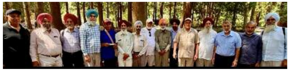
ਬਜ਼ੁਰਗਾਂ ਵੱਲੋਂ ਮਨਾਈ ਗਈ ਪਿਕਨਿਕ ਦੀਆਂ ਵੱਖ ਵੱਖ ਤਸਵੀਰਾਂ।