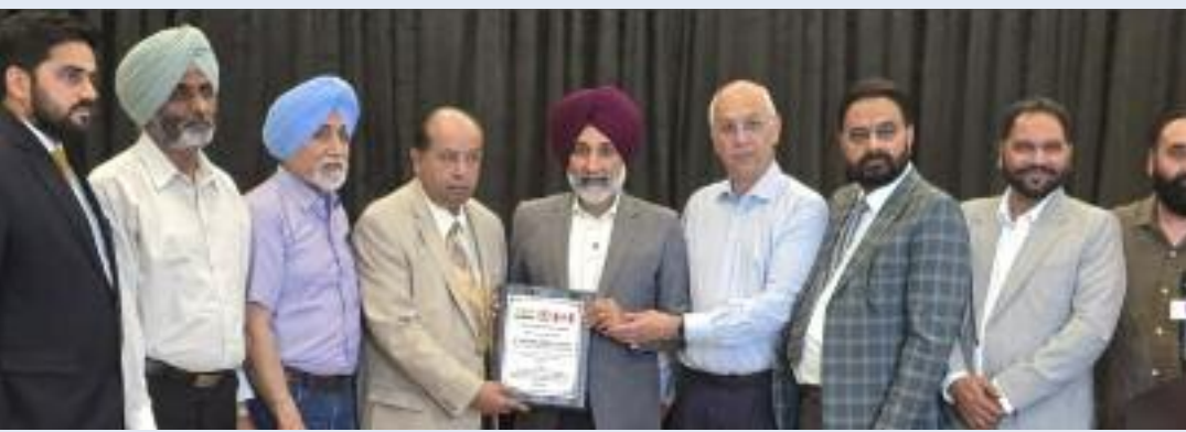
ਰਾਜ ਸਭਾ ਮੈਂਬਰ ਸਤਨਾਮ ਸਿੰਘ ਸੰਧੂ ਨੂੰ ਸਨਮਾਨਿਤ ਕੀਤੇ ਜਾਣ ਦੀ ਇੱਕ ਤਸਵੀਰ।