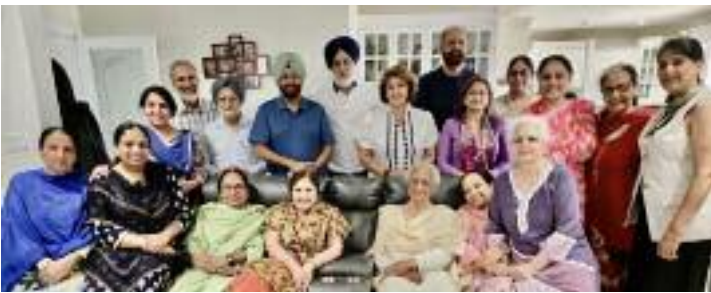
ਸਮਾਗਮ ਦੀ ਸਮੂਹਿਕ ਤਸਵੀਰ