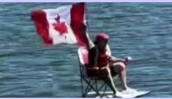
ਵੈਨਕੂਵਰ ਦੇ ਸਮੁੰਦਰੀ ਪਾਣੀਆਂ ਵਿੱਚ ਈ-ਫੋਇਲ ਸਰਫ਼ਬੋਰਡ 'ਤੇ ਸਵਾਰ ਹੋ ਕੇ ਕੈਨੇਡੀਅਨ ਝੰਡਾ ਲਹਿਰਾਉਂਦਿਆਂ ਕੈਨੇਡਾ ਦੀ ਟੀਮ ਦਾ ਹੌਸਲਾ ਵਧਾਉਂਦਾ ਇੱਕ ਪ੍ਰਸ਼ੰਸਕ।

ਵੈਨਕੂਵਰ, ਜੂਨ (ਮਲਕੀਤ ਸਿੰਘ) ਵਿੱਚ ਇੱਕ ਖੇਡ ਪ੍ਰੇਮੀ ਸਮੁੰਦਰ - ਫੀਫਾ ਵਿਸ਼ਵ ਕੱਪ ਸਬੰਧੀ ਵਿੱਚ ਈ-ਫੋਇਲ ਸਰਫ਼ਬੋਰਡ ਆਯੋਜਿਤ ਵੱਖ ਵੱਖ (ਬਿਜਲਈ ਕਿਸ਼ਤੀ) 'ਤੇ ਸਵਾਰ ਗਤੀਵਿਧੀਆਂ ਦਾ ਰੁਝਾਨ ਹੋ ਕੇ ਹੱਥ ਵਿੱਚ ਵਿਸ਼ਾਲ ਹੁਣ ਵੈਨਕੂਵਰ ਦੇ ਸਮੁੰਦਰੀ ਕੈਨੇਡੀਅਨ ਝੰਡਾ ਕਿਨਾਰਿਆਂ ਤੱਕ ਵੀ ਪਹੁੰਚ ਗਿਆ ਹੈ। ਸੋਸ਼ਲ ਮੀਡੀਆ ਤੇ ਵਾਇਰਲ ਇੱਕ ਵੀਡੀਓ ਕਲਿੱਪ ਵਿੱਚ ਹੌਸਲਾ ਵਧਾਉਂਦਿਆਂ ਨਜ਼ਰ