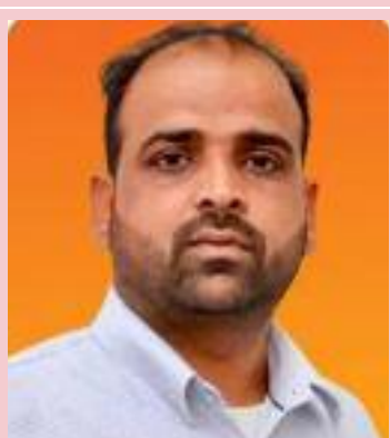
ਸਟੇਟ ਤੋਂ ਇਲਾਵਾ ਹੋਰ ਕੁਝ ਨਹੀਂ ਹੈ। ਸੂਤਰਾਂ ਮੁਤਾਬਕ ਇਸ ਤੋਂ ਪਹਿਲਾਂ ਸੂਬੇ ਵਿੱਚ ਸਰਪੰਚਾਂ ਨੂੰ ਮਹੀਨਾਵਾਰ ਭੱਤਾ ਸਿਰਫ 1,200 ਰੁਪਏ ਸੀ ਪਰ ਉਹ ਵੀ

ਕਦੇ ਮਿਲਿਆ ਨਹੀਂ ਆਖਰਕਾਰ ਕੁਝ ਸਮਾਂ ਪਹਿਲਾਂ ਜਦੋਂ ਪੰਚਾਇਤ ਯੂਨੀਅਨ ਹਾਈਕੋਰਟ ਗਈ, ਤਾਂ ਅਦਾਲਤ ਦੇ ਫੈਸਲੇ ਅਨੁਸਾਰ ਸਰਕਾਰ ਨੇ ਹੁਕਮ ਜਾਰੀ ਕੀਤੇ ਕਿ ਜਿਹੜੀਆਂ ਪੰਚਾਇਤਾਂ ਕੋਲ ਆਪਣਾ ਫੰਡ ਜਾਂ ਆਮਦਨ ਦਾ ਸਾਧਨ ਹੈ ਉਹ ਇਹ ਭੱਤਾ ਉੱਥੋਂ ਲੈ ਸਕਦੀਆਂ ਹਨ ਪਰ ਹਕੀਕਤ ਇਹ ਹੈ ਕਿ ਅੱਜ ਤੱਕ ਵੀ ਬਹੁਤੇ ਸਰਪੰਚਾਂ ਨੂੰ ਇਹ ਮਾਣ-ਭੱਤਾ ਨਸੀਬ ਨਹੀਂ ਹੋਇਆ ਹਨੀ ਟੌਂਸਾ ਨੇ ਜ਼ੋਰ ਦਿੰਦਿਆਂ ਸਰਕਾਰ ਨੂੰ ਪੁੱਛਿਆ ਕਿ ਹੁਣ 10,000 ਰੁਪਏ ਪ੍ਰਤੀ ਮਹੀਨਾ