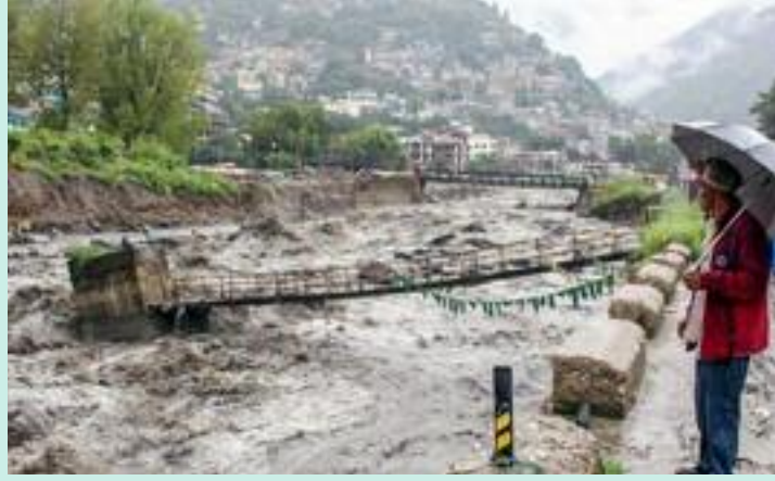
ਜ਼ਿਲ੍ਹਿਆਂ ਵਿਚ ਮੀਂਹ ਦੇ ਨਾਲ-ਨਾਲ ਗਰਜ-ਤੂਫਾਨ ਵੀ ਸਕਦਾ ਹੈ। ਆਈਐਮਡੀ ਦੇ ਅਨੁਸਾਰ, ਸੂਬੇ 'ਚ 28 ਜੂਨ ਤੱਕ ਹਲਕੀ ਬਾਰਿਸ਼

ਮੌਸਮ ਨੇ ਅਚਾਨਕ ਕਰਵਟ ਲੈ ਲਈ ਹੈ, ਅਤੇ ਇਥੇ ਮੀਂਹ ਪੈਣਾ ਸ਼ੁਰੂ ਹੋ ਗਿਆ ਹੈ। ਸਵੇਰੇ 10:30 ਵਜੇ ਹਲਕੀ ਧੁੱਪ ਨਾਲ ਮੌਸਮ ਸਾਫ਼ ਸੀ, ਪਰ ਸਵੇਰੇ 11:00 ਵਜੇ ਤੋਂ ਇਥੇ ਮੀਂਹ ਪੈ ਰਿਹਾ ਹੈ। ਆਪਣੇ ਤਾਜ਼ਾ ਬੁਲੇਟਿਨ ਵਿੱਚ ਭਾਰਤੀ ਮੌਸਮ ਵਿਭਾਗ (ਐੱਮ ਐੱਸ ਡੀ) ਨੇ ਸ਼ਿਮਲਾ, ਕਿਨੌਰ ਅਤੇ ਲਾਹੌਲ-ਸਪਿਤੀ ਵਿਚ ਦੁਪਹਿਰ 3:00 ਵਜੇ ਤੱਕ ਹਲਕੀ ਬਾਰਿਸ਼ ਦੀ ਭਵਿੱਖਬਾਣੀ ਕੀਤੀ ਹੈ, ਜਦੋਂ ਕਿ ਸਿਰਮੌਰ, ਕਾਂਗੜਾ, ਸੋਲਨ, ਕੁੱਲੂ ਅਤੇ ਮੰਡੀ ਵਰਗੇ