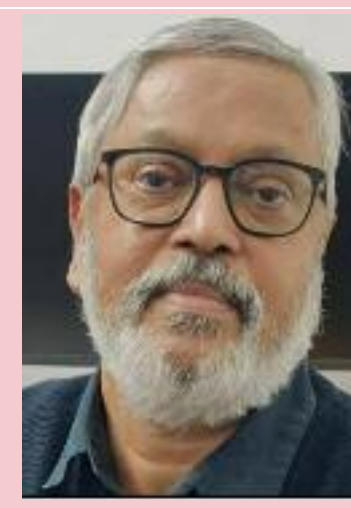
ਮੰਨਵਾਉਣ ਦੇ ਰਾਹ ਪੈਂਦੇ ਹਨ ਤਾਂ ਲੋਟੂ ਕਾਰਪੋਰੇਟ ਮੈਨੇਜਮੈਂਟਾਂ ਅਤੇ ਪੁਲਿਸ-ਪ੍ਰਸ਼ਾਸਨ ਅਮਨ-ਕਾਨੂੰਨ ਨੂੰ ਖ਼ਤਰੇ ਦੀ ਦੁਹਾਈ ਦੇਣ ਲੱਗਦੇ ਹਨ। ਨੋਇਡਾ ਅਤੇ ਹੋਰ ਸਨਅਤੀ ਇਲਾਕਿਆਂ ਦੇ ਮਜ਼ਦੂਰਾਂ ਦੀ ਹਾਲੀਆ ਸਮੂਹਿਕ ਹੱਕ-ਜਤਾਈ ਅਤੇ ਜੁਝਾਰੂ ਸੰਘਰਸ਼ ਤੋਂ ਬੁਖਲਾਈ ਭਾਜਪਾ

ਸਰਕਾਰ ਮਜ਼ਦੂਰਾਂ ਦੇ ਹੱਕ ਵਿੱਚ ਉੱਠਣ ਵਾਲੀ ਹਰ ਇਨਸਾਫ਼ਪਸੰਦ ਆਵਾਜ਼ ਨੂੰ ਨੈਸ਼ਨਲ ਸਕਿਊਰਿਟੀ ਐਕਟ ਰਾਹੀਂ ਕੁਚਲਕੇ ਪੂਰੇ ਦੇਸ਼ ਦੇ ਲੋਕਾਂ ਨੂੰ ਇਹ ਚੇਤਾਵਨੀ ਦੇ ਰਹੀ ਹੈ ਕਿ ਸਰਮਾਏਦਾਰਾ ਲੁੱਟ ਵਿਰੁੱਧ ਉੱਠਣ ਵਾਲੇ ਹਰ ਜਮਹੂਰੀ ਸੰਘਰਸ਼ ਨੂੰ ਇਸੇ ਤਰ੍ਹਾਂ ਹਕੂਮਤੀ ਜਬਰ ਦਾ ਸਾਹਮਣਾ ਕਰਨਾ ਪਵੇਗਾ। ਉਨ੍ਹਾਂ ਮੰਗ ਕੀਤੀ ਕਿ ਮਜ਼ਦੂਰ ਸੰਘਰਸ਼ ਦੇ ਹੱਕ ਵਿੱਚ ਆਵਾਜ਼ ਉਠਾਉਣ ਵਾਲੇ ਬੁੱਧੀਜੀਵੀਆਂ, ਸਮਾਜਿਕ ਕਾਰਕੁਨਾਂ ਅਤੇ ਸੰਘਰਸ਼ਸ਼ੀਲ ਮਜ਼ਦੂਰਾਂ ਨੂੰ ਤੁਰੰਤ ਰਿਹਾ ਕੀਤਾ ਜਾਵੇ ਅਤੇ “ਕੌਮੀ ਸੁਰੱਖਿਆ ਐਕਟ” ਤੁਰੰਤ ਵਾਪਸ ਲਿਆ ਜਾਵੇ ਅਤੇ ਮਜ਼ਦੂਰ ਸੰਘਰਸ਼ਾਂ ਨੂੰ ਬਦਨਾਮ ਕਰਨ ਲਈ ਝੂਠੇ ਬਿਰਤਾਂਤ ਪ੍ਰਚਾਰਨੇ ਬੰਦ ਕੀਤੇ ਜਾਣ।