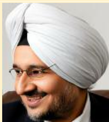
। ਇਸ ਤਰਾਂ ਦਾ ਕਿਰਦਾਰ ਨਿਭਾਅ ਕੇ ਉਨਾ ਸਾਰਿਆਂ ਨੇ