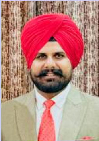
ਨੂੰ ਮਿਲਣੀ ਦੌਰਾਨ ਕਾਲੇ