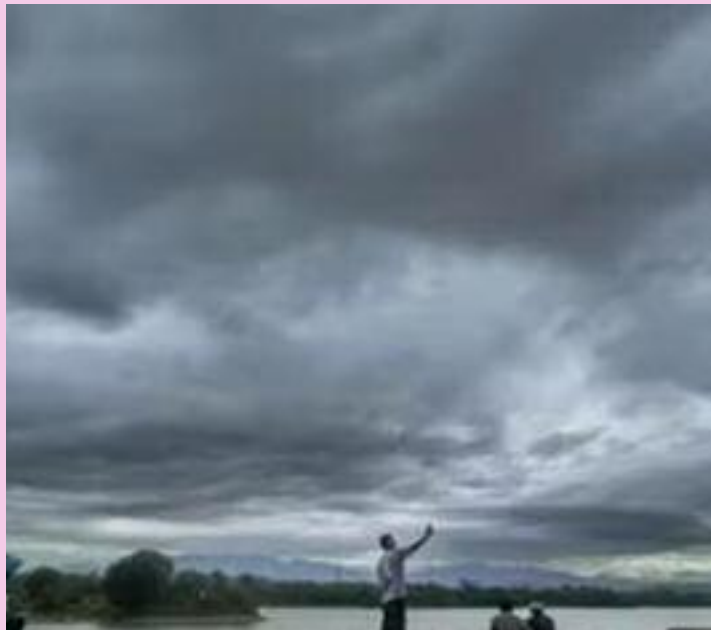
ਘੰਟਿਆਂ ਦੌਰਾਨ ਬੰਗਾਲ ਦੀ ਖਾੜੀ ਮਾਨਸੂਨ ਦੇ ਅੱਗੇ ਵਧਣ ਲਈ ਅਤੇ ਅੰਡੇਮਾਨ ਟਾਪੂਆਂ ਵਿੱਚ ਹਾਲਾਤ ਸਾਜ਼ਗਾਰ ਹਨ।

ਨਵੀਂ ਦਿੱਲੀ : ਭਾਰਤ ਵਿੱਚ ਗਰਮੀ ਦੇ ਕਹਿਰ ਦੇ ਵਿਚਕਾਰ ਰਾਹਤ ਦੀ ਖ਼ਬਰ ਸਾਹਮਣੇ ਆਈ ਹੈ। ਭਾਰਤੀ ਮੌਸਮ ਵਿਭਾਗ (ਆਈ.ਐਮ.ਡੀ.) ਨੇ ਭਵਿੱਖਬਾਣੀ ਕੀਤੀ ਹੈ ਕਿ ਇਸ ਸਾਲ ਦੱਖਣ-ਪੱਛਮੀ ਮਾਨਸੂਨ ਕੇਰਲ ਵਿੱਚ ਅਪਣੇ ਨਿਰਧਾਰਤ ਸਮੇਂ ਤੋਂ ਪਹਿਲਾਂ, ਯਾਨੀ 26 ਮਈ ਨੂੰ ਪਹੁੰਚਣ ਦੀ ਸੰਭਾਵਨਾ ਹੈ। ਆਮ ਤੌਰ ਉੱਤੇ ਮਾਨਸੂਨ 1 ਜੂਨ ਨੂੰ ਕੇਰਲ ਪਹੁੰਚਦਾ ਹੈ, ਪਰ ਇਸ ਵਾਰ ਇਹ ਜਲਦੀ ਦਸਤਕ ਦੇ ਰਿਹਾ ਹੈ। ਮੌਸਮ ਵਿਭਾਗ ਨੇ ਦੱਸਿਆ ਕਿ, "ਇਸ ਸਾਲ ਦੱਖਣ-ਪੱਛਮੀ ਮਾਨਸੂਨ ਦੇ 26 ਮਈ ਨੂੰ ਕੇਰਲ ਵਿੱਚ ਪਹੁੰਚਣ ਦੀ ਸੰਭਾਵਨਾ ਹੈ, ਜਿਸ ਵਿੱਚ 4 ਕੁ ਦਿਨਾਂ ਦਾ ਵਾਧਾ-ਘਾਟਾ ਹੋ ਸਕਦਾ ਹੈ।" ਵਿਭਾਗ ਅਨੁਸਾਰ ਅਗਲੇ 24