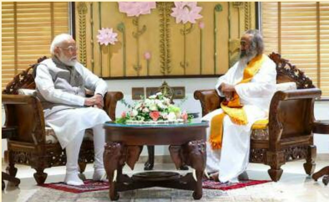
Spiritual leader Sri Sri Ravi Shankar praises PM Modi's Swachh Bharat Abhiyan at Art of Living anniversary celebrations

Referring to the newly inaugurated meditation space, Prime Minister Modi said, "Dhyan Mandir will become a centre of peace and solace for thousands of people in the coming generations." Alongside the inauguration, Prime Minister Modi launched nine nationwide service initiatives led by The Art of Living for the year ahead: Rural smart village centres for integrated village development; the next phase of Mission Green Earth, a major expansion of the organisation's afforestation work; a Tribal Welfare Mission focused on healthcare, education and livelihoods; Rural Digital Literacy and Child Development program; free education for underserved com-