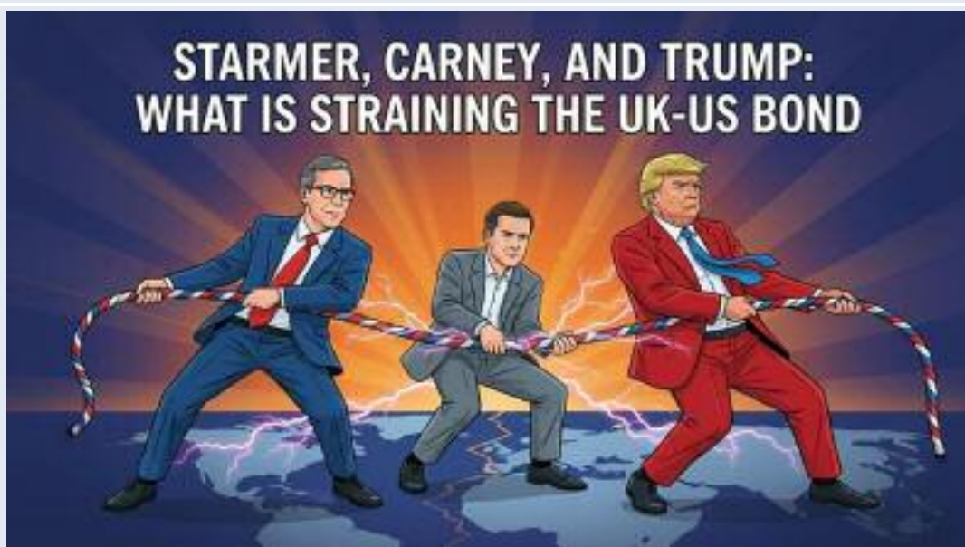
Keir Starmer, Mark Carney, and Donald Trump appear together in a stylized political illustration.

to crack. The pressure has not stopped there. Catherine West warned that a contest could be forced by Monday if no cabinet minister steps forward. Meanwhile, speculation around Wes Streeting has filled Westminster with talk of a possible challenge. The dispute is no longer about personalities alone. It is about whether Starmer still controls his party. Labour's losses gave critics a simple line. Voters were already angry about living costs, higher bills, and a sense that the government has no clear grip. Starmer also faces the old poison of politics, the feeling that power is slipping away before it has been used. When that happens, every policy wobble looks larger. A leader who once promised order now looks pinned down by events. The UK-US special relationship has taken a hard hit under the