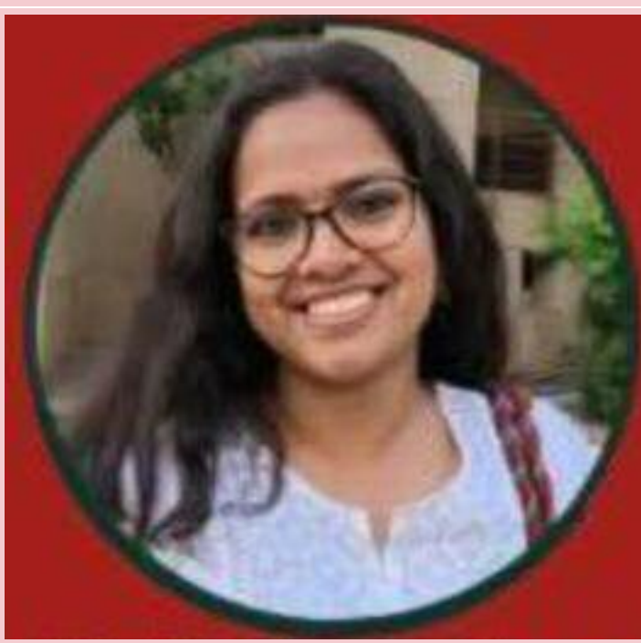
ਲਈ ਜ਼ਰੂਰੀ ਹੋਰ ਸਹੂਲਤਾਂ ਲਾਗੂ ਕਰ ਰਹੇ ਹਨ ਅਤੇ ਜੇਕਰ ਨਾ ਕਰਵਾਏ ਸਰਕਾਰਾਂ ਅਤੇ ਮਜ਼ਦੂਰ ਸਮੂਹਿਕ ਸੰਘਰਸ਼ ਦੇ ਪ੍ਰਸ਼ਾਸਨ ਖ਼ੁਦ ਲਾਕਾਨੂੰਨੀਆਂ ਦਬਾਅ ਰਾਹੀਂ ਇਹ ਮੰਗਾਂ

ਕਰਨਾ ਅਤੇ ਸੰਘਰਸ਼ ਦੀ ਹਮਾਇਤ ਕਰਨਾ ਨਾਗਰਿਕਾਂ ਦਾ ਜਮਹੂਰੀ ਹੱਕ ਹੈ। ਨੋਇਡਾ ਪੁਲਿਸ ਨੇ ਭਾਜਪਾ ਸਰਕਾਰ ਦੇ ਇਸ਼ਾਰੇ 'ਤੇ ਮਜ਼ਦੂਰਾਂ ਦੇ ਹਿਤਾਂ ਲਈ ਆਵਾਜ਼ ਉਠਾਉਣ ਵਾਲੇ ਬੁੱਧੀਜੀਵੀਆਂ ਅਤੇ ਕਾਰਕੁਨਾਂ ਨੂੰ ਕੌਮੀ ਸੁਰੱਖਿਆ ਲਈ ਖ਼ਤਰਾ ਕਰਾਰ ਦੇ ਕੇ ਇਹ ਸੰਦੇਸ਼ ਦਿੱਤਾ ਹੈ ਕਿ ਹਕੂਮਤ ਲਈ ਸਰਮਾਏਦਾਰੀ ਦੇ ਲੋਟ ਹਿਤਾਂ ਯਾਨੀ ਸਰਮਾਏਦਾਰੀ ਦੇ ਮੁਨਾਫ਼ੇ ਦੀ ਸੁਰੱਖਿਆ ਹੀ ਕੌਮੀ ਸੁਰੱਖਿਆ ਹੈ ਅਤੇ ਇਸ ਕਥਿਤ ਕੌਮੀ ਸੁਰੱਖਿਆ ਵਿੱਚੋਂ ਮਜ਼ਦੂਰ ਜਮਾਤ ਤੇ ਹੋਰ ਮਿਹਨਤਕਸ਼ ਲੋਕ ਪੂਰੀ ਤਰ੍ਹਾਂ ਮਨਫੀ ਹਨ। ਕਾਨੂੰਨੀ ਤੌਰ 'ਤੇ ਤੈਅ ਕੀਤੀਆਂ ਘੱਟੋਘੱਟ ਉਜ਼ਰਤਾਂ ਅਤੇ ਮਜ਼ਦੂਰਾਂ ਦੀ ਜੀਵਨ ਸੁਰੱਖਿਆ