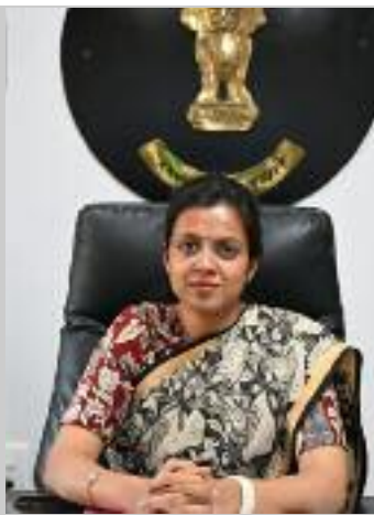
ਕਿਸਾਨਾਂ ਨੂੰ ਵਾਜ਼ਬ ਕੀਮਤ 'ਤੇ