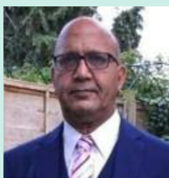
Bal Ram Sampla Geopolitics

iated unions called the results “catastrophic” and demanded an urgent change in direction. Some stopped short of naming Starmer directly. Others did not. The mes-