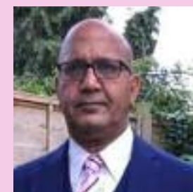
Bal Ram Sampla Geopolitics