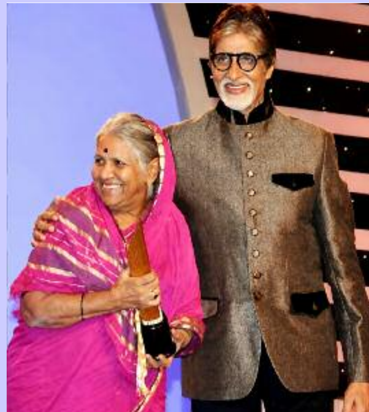
ਸਿੰਧੁਤਾਈ ਆਪਣੀ ਖੁਸ਼ੀ ਨੂੰ ਸੁਪਰਸਟਾਰ ਅਮਿਤਾਬ ਬੱਚਨ ਨਾਲ ਸਾਂਝੀ ਕਰਦੇ ਹੋਏ

ਉਸ ਨੂੰ "ਮਾਈ" ਕਹਿੰਦੇ ਹਨ। ਉਸ ਨੇ ਇਨ੍ਹਾਂ ਸਾਰੇ ਅਨਾਥ ਬੱਚਿਆਂ ਨੂੰ ਮਾਂ ਵਾਂਗ ਪਾਲਿਆ ਅਤੇ ਉਨ੍ਹਾਂ ਰਾਹੀਂ ਕਰੀਬ 400 ਜਵਾਈਆਂ ਅਤੇ 60 ਨੂੰਹਾਂ ਦਾ ਇੱਕ ਵਿਸ਼ਾਲ ਪਰਿਵਾਰ ਖੜ੍ਹਾ ਕੀਤਾ।