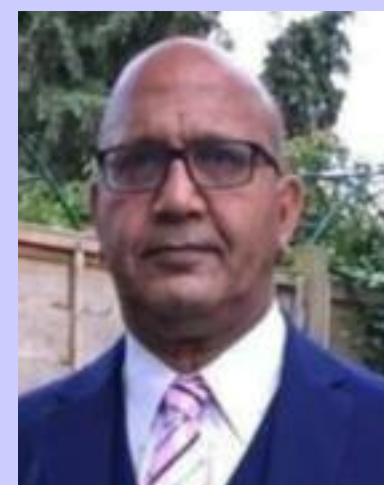
Bal Ram Sampla Geopolitics