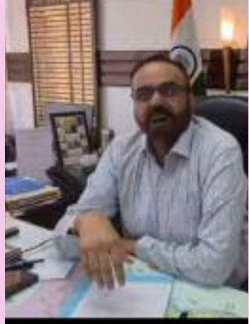
ਲਈ ਹੋਈਆਂ, ਜਿਨ੍ਹਾਂ ਵਿੱਚ

ਬੰਗਾਂ ਦੇ 15 ਵਾਰਡ, ਨਵਾਂਸ਼ਹਿਰ ਦੇ 19 ਵਾਰਡ ਅਤੇ ਰਾਹੋਂ ਨਗਰ ਕੌਂਸਲ ਦੇ 11 ਵਾਰਡ ਸ਼ਾਮਲ ਹਨ। ਚੋਣਾਂ ਲਈ ਕੁੱਲ 148 ਉਮੀਦਵਾਰ ਮੈਦਾਨ ਵਿੱਚ ਸਨ। ਉਨ੍ਹਾਂ ਦੱਸਿਆ ਕਿ ਜ਼ਿਲ੍ਹੇ ਵਿੱਚ ਨਗਰ ਕੌਂਸਲ ਚੋਣ ਲਈ 60.70 ਫੀਸਦੀ ਮਤਦਾਨ ਹੋਇਆ ਸੀ। ਜਿਸ ਦੀ ਗਿਣਤੀ 29 ਮਈ ਨੂੰ ਹੋਵੇਗੀ। ਉਨ੍ਹਾਂ ਦੱਸਿਆ