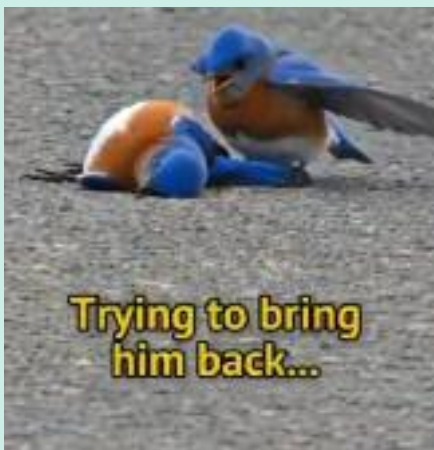
Trying to bring him back...

ਚਿੜੀਏ ਨੀ ਚਿੜੀਏ, ਕਿੱਥੇ ਹੁਣ ਹੁਨੀ ਏਂ। ਰੰਗ ਬਿਰੰਗੀ ਭਾਅ ਮਾਰਦੀ, ਸਭ ਦਾ ਧਿਆਨ ਖਿੱਚ ਲੈਨੀ ਏਂ। ਥੋੜੀ ਜਿਹੀ ਵੀ ਤਪਸ਼ ਨਾ ਝੱਲੋਂ, ਬੇਹੋਸ਼ ਹੋ ਜਾਨੀ ਐਂ। ਅੱਲਾ ਦਾ ਬੰਦਾ ਕੋਈ, ਤੇਰੇ ਮੂੰਹ ਵਿੱਚ ਪਾਣੀ ਪਾ ਦੇਵੇ, ਝੱਟ ਹੋਸ਼ ਵਿੱਚ ਆ ਜਾਨੀ ਐਂ। ਮਿੱਤਰ ਸਹੇਲੀ ਨਾਲ, ਦੇ ਜਾਂਦੀ ਝਕਾਨੀ ਐਂ। ਦੁਬਾਰਾ ਬੰਦੇ ਦੇ ਸਿਰ ਤੇ ਆ ਕੇ ਬੈਠ, ਪੰਨਵਾਦ ਉਸਦਾ ਕਰ ਜਾਨੀ ਐਂ। ਉਹ ਵੀ ਪਿਆਰ ਨਾਲ ਮੰਨਦਾ, ਤੇਰੀ ਮਿਹਰਬਾਨੀ ਐਂ। ਜੇਠ ਮਹੀਨੇ ਦੀ ਗਰਮੀ ਵਿੱਚ, ਜਾਨਵਰ ਅਕਸਰ ਹੀ ਬੇਹੋਸ਼ ਹੋ ਜਾਂਦੇ ਨੇ। ਪੰਨ ਹਨ ਉਹ ਬੰਦੇ, ਅਪਣੇ ਕੀਮਤੀ ਟਾਈਮ ਵਿੱਚ, ਕਾਰ ਰੋਕ ਕੇ, ਉਨ੍ਹਾਂ ਨੂੰ ਬਚਾਉਂਦੇ ਨੇ। ਇਸ ਤੇਜ਼ ਰਫਤਾਰੀ ਦੇ ਜਮਾਨੇ ਵਿੱਚ ਵੀ, ਰੱਬ ਨੇ ਪਰਉਪਕਾਰੀ ਬੰਦੇ, ਸੰਤ ਬਣਾਏ। ਅਪਣੇ ਕਰ-ਕਮਲਾਂ ਨਾਲ ਪੰਨ ਕਰਵਾਕੇ ਧਰਤੀ ਉੱਤੇ ਸਵਰਗ ਬਸਾਏ। ਲਾਲਚੀ ਬੰਦੇ ਉਲਝੇ ਰਹਿੰਦੇ, ਸੁਰਗਾਂ ਦੇ ਆਨੰਦ ਤੋਂ ਵਾਂਝੇ ਰਹਿੰਦੇ। ਕਮਜ਼ੋਰ ਜਾਨਵਰਾਂ ਦਾ ਰੱਬ ਹੀ ਰਾਖਾ, ਮਾਲਕ ਦੇ ਦਰ ਤੋਂ ਭਿੱਖ ਮੰਗਦੇ ਰਹਿੰਦੇ। ਚਾਰ ਦਿਨ ਦੀ ਜਿੰਦਗੀ, ਕੀੜੇ ਮਕੋੜੇ ਖਾ ਗੁਜ਼ਾਰਾ ਕਰਦੇ, ਮੌਜ ਮਸਤੀਆਂ ਵਿੱਚ ਰਹਿੰਦੇ। ਭਰਿੰਡਾਂ ਵਾਂਗੂੰ ਨਾ ਲੜਨ ਕਿਸੇ ਦੇ, ਸ਼ਾਂਤਮਈ ਜੀਵਨ ਬਸਰ ਕਰਦੇ। ਘੁਲਮਿਲ ਕੇ ਰਹਿਣ ਦਾ ਨਮੂਨਾ ਪੇਸ਼ ਕਰਦੇ। ਸਭ ਰੱਬ ਦੇ ਜੀਅ ਨੇ, ਅੱਜ ਵੀ ਬੋਧੀਆਂ,