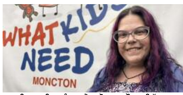
'ਵਟ ਕਿਡਜ਼ ਨੀਡ' ਸੰਸਥਾ ਦੇ ਸਟੋਰ 'ਚ ਮੌਜੂਦ ਇੱਕ ਵਰਕਰ

ਲਿਆ ਹੈ। ਇਸ ਉਪਰਾਲੇ ਨੂੰ ਸਥਾਨਕ ਭਾਈਚਾਰੇ ਵੱਲੋਂ ਵੱਡਾ ਸਮਰਥਨ ਮਿਲ ਰਿਹਾ ਹੈ। ਜਾਣਕਾਰੀ ਅਨੁਸਾਰ 'ਵਟ ਕਿਡਜ਼ ਨੀਡ ਮੌਕਟਨ' ਨਾਮੀ ਇਹ ਸੰਸਥਾ ਬੱਚਿਆਂ ਅਤੇ ਲੋੜਵੰਦ ਪਰਿਵਾਰਾਂ ਲਈ ਮੁਫਤ ਕੱਪੜੇ ਮੁਹੱਈਆ ਕਰਵਾ ਰਹੀ ਹੈ। ਸਟੋਰ ਦੇ ਖੁੱਲ੍ਹਣ ਦੇ ਪਹਿਲੇ ਹੀ ਹਫਤੇ ਦੌਰਾਨ 300 ਤੋਂ ਵੱਧ