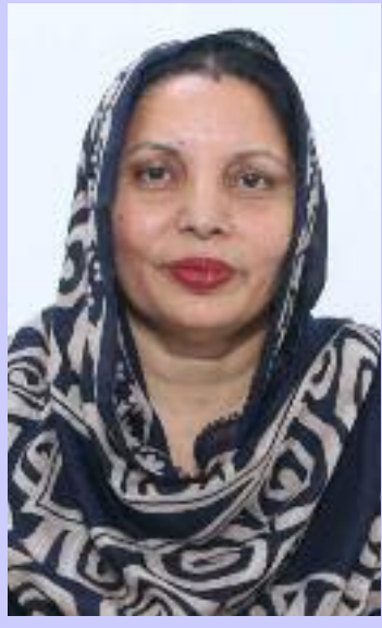
ਆ ਕਾ ਨਿਵਾਸੀ ਨਰਕ ਭਰੀ

ਚਿਹਰਾ ਨਹੀਂ ਹਨ, ਬਲਕਿ ਉਹ ਲੰਬੇ ਸਮੇਂ ਤੋਂ ਹਰ ਔਖੀ ਘੜੀ ਵਿੱਚ ਜਨਤਾ ਦੇ ਹੱਕਾਂ ਲਈ ਸੰਘਰਸ਼ਾਂ ਦੇ ਮੈਦਾਨ ਵਿੱਚ ਡਟੇ ਰਹੇ ਹਨ। ਲੋਕਾਂ ਦੀਆਂ ਮੁਸ਼ਕਿਲਾਂ ਨੂੰ ਪ੍ਰਸ਼ਾਸਨ ਤੱਕ ਪਹੁੰਚਾਉਣ ਅਤੇ ਉਨ੍ਹਾਂ ਦਾ ਹੱਲ ਕਰਵਾਉਣ ਲਈ ਉਨ੍ਹਾਂ ਹਮੇਸ਼ਾ ਮੋਹਰੀ ਭੂਮਿਕਾ ਨਿਭਾਈ ਹੈ। ਇਸ ਮੌਕੇ ਵਿਸ਼ੇਸ਼ ਤੌਰ 'ਤੇ ਜ਼ਿਕਰ ਕੀਤਾ ਗਿਆ ਕਿ ਮਈਆ ਭਗਵਾਨ ਦੇ ਡੇਰੇ ਅੱਗੇ ਪਿਛਲੇ 4 ਸਾਲਾਂ ਤੋਂ ਖੜ੍ਹੇ ਗੰਦੇ ਪਾਣੀ ਦੇ ਨਿਕਾਸ ਦੀ ਗੰਭੀਰ ਸਮੱਸਿਆ, ਜਿਸ ਕਾਰਨ ਇਲ-