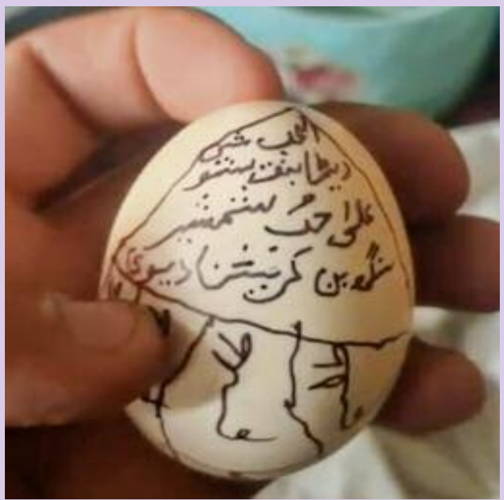
ਵਸੀਕਰਨ ਵਾਸਤੇ ਰੱਖੇ ਗਏ ਅੰਡੇ ਦੀ ਤਸਵੀਰ।

ਸੂਤਰਾਂ ਤੋਂ ਮਿਲੀ ਜਾਣਕਾਰੀ ਅਨੁਸਾਰ ਇਲਾਕੇ ਦੇ ਇੱਕ ਪਿੰਡ ਵਿੱਚ ਇੱਕ ਵਿਅਕਤੀ ਵਲੋਂ ਆਪਣੇ ਪਿੰਡ ਦੇ ਹੀ ਇੱਕ ਘਰ ਦੇ ਇੱਕ ਪਰਿਵਾਰਕ ਮੈਂਬਰ ਨੂੰ ਆਪਣੇ ਵੱਸ ਵਿੱਚ ਕਰਨ ਲਈ ਕਿਸੇ ਤਾਂਤਰਿਕ ਤੋਂ ਮੁਰਗੀ ਦੇ ਇੱਕ ਅੰਡੇ ਉੱਤੇ ਅਰਬੀ ਭਾਸ਼ਾ ਵਿੱਚ ਕੁਝ ਲਿਖਵਾ ਕੇ ਅੰਡੇ ਨੂੰ ਡੱਬੀ ਵਿੱਚ ਲਪੈਟ ਕੇ ਸੰਬੰਧਿਤ ਪਰਿਵਾਰ ਦੇ ਕਮਰੇ ਵਿੱਚ ਰੱਖੇ ਗਏ ਬੈਂਡ ਦੇ ਹੇਠਾਂ ਰੱਖ ਆਇਆ। ਇਕ ਦੋ ਦਿਨ ਬਾਅਦ ਜਦੋਂ ਘਰ ਦੇ ਮੈਂਬਰ ਬੈਂਡ ਹੇਠਾਂ ਝਾੜੂ ਲਗਾਉਣ ਲੱਗੇ ਤਾਂ ਉਹਨਾਂ ਬੈਂਡ ਹੇਠਾਂ ਰੱਖੀ ਇੱਕ ਡੱਬੀ ਮਿਲੀ ਜਿਸ ਨੂੰ ਜਦੋਂ ਪਰਿਵਾਰਕ ਮੈਂਬਰਾਂ ਨੇ ਖੋਲ੍ਹ ਕੇ ਦੇਖਿਆ ਤਾਂ ਉਸ ਵਿੱਚੋਂ ਅਰਬੀ ਭਾਸ਼ਾ ਵਿੱਚ ਲਿਖਿਆ