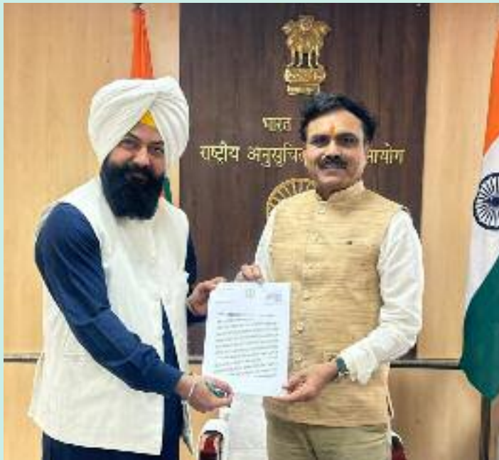
ਕਮਿਸ਼ਨ ਕੋਲ ਪਹੁੰਚ ਕੀਤੀ ਗਈ ਹੈ। ਬੁਲਾਰੇ ਨੇ

ਮਨਾਹੀ ਵਾਲੇ ਸ਼ਬਦ ਦੀ ਵਰਤੋਂ ਨੂੰ ਰੁਕਵਾਉਣ ਲਈ ਇੱਕ ਮੰਗ ਪੱਤਰ ਵੀ ਸੌਂਪਿਆ ਗਿਆ। ਇਸ ਬਾਰੇ ਜਾਣਕਾਰੀ ਦਿੰਦਿਆਂ ਪੰਜਾਬ ਰਾਜ ਅਨੁਸੂਚਿਤ ਜਾਤੀਆਂ ਕਮਿਸ਼ਨ ਦੇ ਬੁਲਾਰੇ ਨੇ ਦੱਸਿਆ ਕਿ ਜਨਗਣਨਾ 2027 ਦੀਆਂ ਸੂਚੀਆਂ ਅਤੇ ਡਿਜੀਟਲ ਪਲੇਟਫਾਰਮਾਂ ਤੋਂ ਅਨੁਸੂਚਿਤ ਜਾਤੀਆਂ ਲਈ ਵਰਤੀ ਗਈ ਅਪਮਾਨਜਨਕ ਅਤੇ ਸਮਾਜ ਵਿਰੋਧੀ ਸ਼ਬਦਾਵਲੀ ਨੂੰ ਤੁਰੰਤ ਹਟਵਾਉਣ ਲਈ ਕੌਮੀ