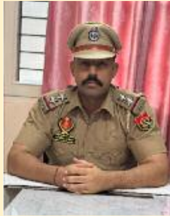
ਐਕਸੀਡੈਂਟ ਨਾਲ ਸਬੰਧਿਤ ਕਈ ਟੂ ਵੀਲਰ ਵਹੀਕਲ ਤੇ

ਫੋਰ ਵੀਲਰ ਵਹੀਕਲ ਭਾਰੀ ਗਿਣਤੀ ਵਿੱਚ ਖੜ੍ਹੇ ਹਨ। ਜਿਸ ਦੇ ਚੱਲਦੇ ਉਨ੍ਹਾਂ ਨੇ ਸਮੂਹ ਵਾਹਨ ਮਾਲਕਾਂ ਨੂੰ ਸਪੁਰਦਗੀ ਕਰਨ ਦੇ ਲਈ ਕਿਹਾ। ਉਨ੍ਹਾਂ ਕਿਹਾ ਕਿ ਜਿੰਨਾ ਮਾਲਕਾਂ ਦੇ ਵਾਹਨ ਥਾਣੇ ਵਿੱਚ ਖੜ੍ਹੇ ਹਨ ਉਹ ਆਪਣੇ ਵਾਹਨਾਂ ਦੇ ਅਸਲੀ ਕਾਗਜ਼ਾਤ ਦਿਖਾ ਕੇ ਆਪਣੇ ਵਾਹਨ ਲੈ ਕੇ ਜਾ ਸਕਦੇ ਹਨ। ਉਨ੍ਹਾਂ ਕਿਹਾ ਕਿ ਵਾਹਨਾਂ ਦੇ ਕਾਗਜ਼ਾਤ ਦੀ ਪੂਰੀ ਬਾਰੀਕੀ ਨਾਲ ਜਾਂਚ ਕੀਤੀ ਜਾਵੇਗੀ।