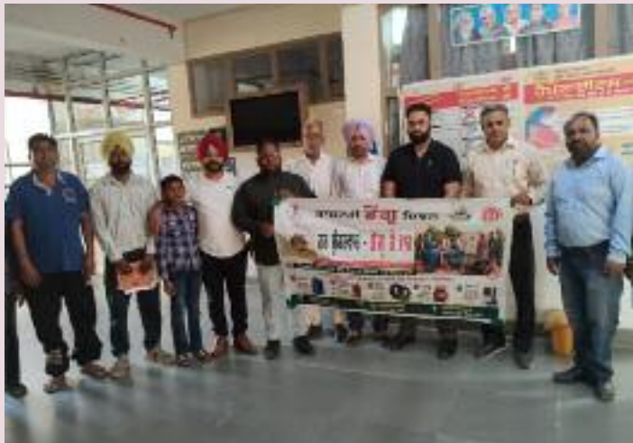
ਰੂਪ ਲੈ ਲੈਂਦਾ ਹੈ, ਜਿਹੜਾ ਵਿਅਕਤੀ ਦੀ ਜਾਨ ਵੀ ਲੈ ਸਕਦਾ ਹੈ। ਡੇਂਗੂ ਦੇ ਆਮ ਲੱਛਣਾਂ ਵਿਚ ਤੇਜ਼ ਸਿਰਦਰਦ ਤੇ ਤੇਜ਼ ਬੁਖਾਰ, ਮਾਸਪੇਸ਼ੀਆਂ ਤੇ ਜੋੜਾਂ ਵਿਚ ਦਰਦ, ਅੱਖ ਦੇ ਪਿਛਲੇ ਹਿੱਸੇ ਵਿਚ ਦਰਦ, ਹਾਲਤ ਖਰਾਬ ਹੋਣ 'ਤੇ ਨੱਕ,

ਗਮਲਿਆਂ, ਕੂਲਰਾਂ, ਫਰਿੱਜ ਦੀਆਂ ਟਰੇਆਂ, ਪੁਰਾਣੇ ਟਾਇਰਾਂ ਅਤੇ ਛੱਤਾਂ 'ਤੇ ਪਏ ਕਬਾੜ ਸਮਾਨ ਵਿੱਚ ਖੜ੍ਹੇ ਪਾਣੀ ਨੂੰ ਸਾਫ ਕਰਨ ਲਈ ਪ੍ਰੇਰਿਤ ਕੀਤਾ। ਉਨ੍ਹਾਂ ਕਿਹਾ ਕਿ ਡੇਂਗੂ ਤੋਂ ਬਚਣ ਦਾ ਇਕੋ-ਇੱਕ ਕਾਰਗਰ ਤਰੀਕਾ ਹੈ ਕਿ ਕਿਸੇ ਵੀ ਥਾਂ 'ਤੇ ਪਾਣੀ ਖੜ੍ਹਾ ਨਾ ਹੋਣ ਦਿੱਤਾ ਜਾਵੇ। ਉਨ੍ਹਾਂ ਦੱਸਿਆ ਕਿ ਸਿਹਤ ਵਿਭਾਗ ਪੰਜਾਬ ਦੀਆਂ ਹਦਾਇਤਾਂ 'ਤੇ 'ਹਰ ਸ਼ੁੱਕਰਵਾਰ, ਡੇਂਗੂ 'ਤੇ ਵਾਰ' ਮੁਹਿੰਮ ਤਹਿਤ ਲਾਰਵਾ ਖਤਮ ਕਰਨ ਲਈ ਘਰ-ਘਰ ਸਰਵੇ ਤੇ ਜਾਗਰੂਕਤਾ ਮੁਹਿੰਮ ਜ਼ੋਰਾਂ 'ਤੇ ਹੈ। ਉਨ੍ਹਾਂ ਦੱਸਿਆ ਕਿ ਡੇਂਗੂ ਬੁਖਾਰ ਫੈਲਾਉਣ ਵਾਲੇ ਮੱਛਰ ਦਾ ਲਾਰਵਾ ਕੁੱਝ ਦਿਨਾਂ ਵਿਚ ਖ਼ਤਰਨਾਕ ਮੱਛਰ ਦਾ