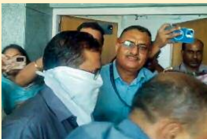
ਘੜੀ। ਉਸ ਨੂੰ ਪ੍ਰੀਖਿਆ ਤੋਂ 10 ਦਿਨ ਪਹਿਲਾਂ 23 ਅਪਰੈਲ ਨੂੰ

ਗਿਆ, ਜਿੱਥੋਂ ਉਸ ਨੂੰ ਦੋ ਦਿਨ ਸੀ ਬੀ ਆਈ ਰਿਮਾਂਡ 'ਤੇ ਭੇਜ ਦਿੱਤਾ ਹੈ। ਨੀਟ-ਯੂ ਜੀ ਦਾ ਪੇਪਰ ਲੀਕ ਹੋਣ ਕਰ ਕੇ 3 ਮਈ ਨੂੰ ਲਈ ਪ੍ਰੀਖਿਆ ਰੱਦ ਕਰ ਦਿੱਤੀ ਗਈ ਸੀ। ਪ੍ਰੀਖਿਆ ਹੁਣ 21 ਜੂਨ ਨੂੰ ਨਵੇਂ ਸਿਰਿਓਂ ਲਈ ਜਾ ਰਹੀ ਹੈ। ਸੀ ਬੀ ਆਈ ਨੇ ਦਾਅਵਾ ਕੀਤਾ ਕਿ ਮੋਟੇਗਾਓਂਕਰ ਨੀਟ-ਯੂ ਜੀ ਪ੍ਰੀਖਿਆ ਦੇ ਸਵਾਲ ਲੀਕ ਤੇ ਅੱਗੇ ਸਰਕੂਲੇਟ ਕਰਨ ਵਿੱਚ ਸ਼ਾਮਲ ਸੀ ਅਤੇ ਉਸ ਨੇ ਹੋਰਨਾਂ ਮੁਲਜ਼ਮਾਂ ਨਾਲ ਮਿਲ ਕੇ ਸਾਜ਼ਿਸ਼