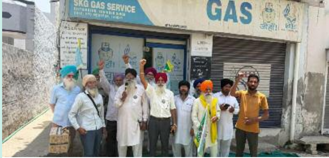
ਗੈਸ ਏਜੰਸੀ ਦੇ ਬਾਹਰ ਰੋਸ ਪ੍ਰਦਰਸ਼ਨ ਕਰਦੇ ਹੋਏ ਕਿਸਾਨ ਆਗੂ।

ਕਿਹਾ ਕਿ ਅਸੀਂ ਪਿਛਲੇ ਦੋ ਮਹੀਨਿਆਂ ਤੋਂ ਆਪਣੇ ਘਰੈਲੂ ਗੈਸ ਸਲੰਡਰ ਦੀ ਬੁਕਿੰਗ ਕਰਵਾਈ ਹੈ ਸਾਨੂੰ ਅੱਜ ਤੱਕ ਸਲੰਡਰ ਨਹੀਂ ਮਿਲਿਆ ਹੈ ਸਾਡੀਆਂ ਬੁਕਿੰਗਾਂ ਕੈਸਲ ਕਰ ਦਿੱਤੀਆਂ ਜਾਂਦੀਆਂ ਹਨ। ਅਗਰ ਅਸੀਂ ਏਜੰਸੀ ਆਉਂਦੇ ਹਾਂ ਤਾਂ ਗੈਸ ਏਜੰਸੀ ਦੇ ਕਰਿੰਦੇ ਸਾਡੇ ਨਾਲ ਮਾੜਾ ਵਿਵਹਾਰ ਕਰੇ ਹਨ ਅਤੇ ਸਾਨੂੰ ਗੈਸ ਸਲੰਡਰ ਤਾਂ ਇੱਕ ਪਾਸੇ ਪਰਚੀ ਵੀ ਨਹੀਂ ਦੇ ਰਹੇ ਹਨ। ਉਨ੍ਹਾਂ ਕਿਹਾ ਕਿ ਸਾਨੂੰ ਕਫੀ ਦਿੱਨਾਂ ਤੋਂ ਸਲੰਡਰ ਨਹੀਂ ਮਿਲ ਰਿਹਾ ਹੈ ਦੂਸਰੇ ਪਾਸੇ ਐਚ ਪੀ ਗੈਸ ਏਜੰਸੀ ਦੇ ਕਰਿੰਦੇ ਮਹਿਤਪੁਰ ਦੇ ਵਿੱਚ ਸ਼ਰੇਆਮ ਬਲੈਕ ਕਰ ਰਹੇ ਹਨ। ਭਰੋਸੇਯੋਗ ਸੂਤਰਾਂ ਤੋਂ ਪਤਾ ਚੱਲਿਆ ਕਿ ਪਿਛਲੇ ਦਿੱਨੀ ਇੱਕ ਵਿਆਹ ਵਿੱਚ ਐਚ ਪੀ ਗੈਸ ਏਜੰਸੀ ਦੇ