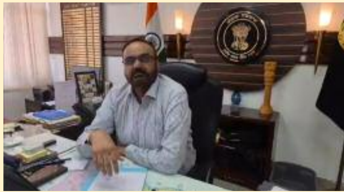
ਕਿ ਜ਼ਿਲ੍ਹਾ ਪ੍ਰਸ਼ਾਸਨ ਵਲੋਂ ਮੋਹਰੇ ਹੋ ਕੇ ਸਾਰੀ ਪ੍ਰਕਿਰਿਆ ਦੀ ਅਗਵਾਈ ਕੀਤੀ ਜਾ ਰਹੀ ਹੈ । ਉਨ੍ਹਾਂ ਰਾਜਨੀਤਿਕ ਪਾਰਟੀਆਂ ਦੇ

ਹੈ। ਨਿਰਵਿਘਨ ਤੇ ਪਾਰਦਰਸ਼ੀ ਪ੍ਰਕਿਰਿਆ ਨੂੰ ਯਕੀਨੀ ਬਣਾਉਣ ਲਈ ਜ਼ਿਲ੍ਹਾ ਪ੍ਰਸ਼ਾਸਨ ਵਲੋਂ 615 ਬੀ.ਐਲ.ਓਜ਼, 62 ਸੁਪਰਵਾਈਜ਼ਰ ਅਤੇ 3-3 ਚੋਣਕਾਰ ਤੇ ਸਹਾਇਕ ਚੋਣਕਾਰ ਅਫਸਰਾਂ ਵਲੋਂ ਕੰਮ ਦੀ ਨਿਗਰਾਨੀ ਕੀਤੀ ਜਾ ਰਹੀ ਹੈ। ਡਿਪਟੀ ਕਮਿਸ਼ਨਰ ਨੇ ਦੱਸਿਆ ਕਿ ਬੀ.ਐਲ.ਓਜ਼ ਵਲੋਂ ਘਰ-ਘਰ ਜਾ ਕੇ ਵੋਟਰ ਵੈਰੀਫਿਕੇਸ਼ਨ, ਦਰੁਸਤੀ ਅਤੇ ਕਮੀਆਂ ਨੂੰ ਦੂਰ ਕਰਨ ਸਬੰਧੀ ਫਾਰਮ ਵੱਡੇ ਜਾਣਗੇ। ਉਨ੍ਹਾਂ ਜ਼ੋਰ ਦੇ ਕੇ ਕਿਹਾ