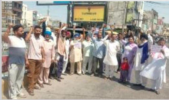
ਦੀਆਂ ਜੇਬਾਂ ਕੱਟ ਰਹੀ ਹੈ। ਦੇਸ਼ ਦੇ ਪ੍ਰਧਾਨਮੰਤਰੀ ਨਰਿੰਦਰ