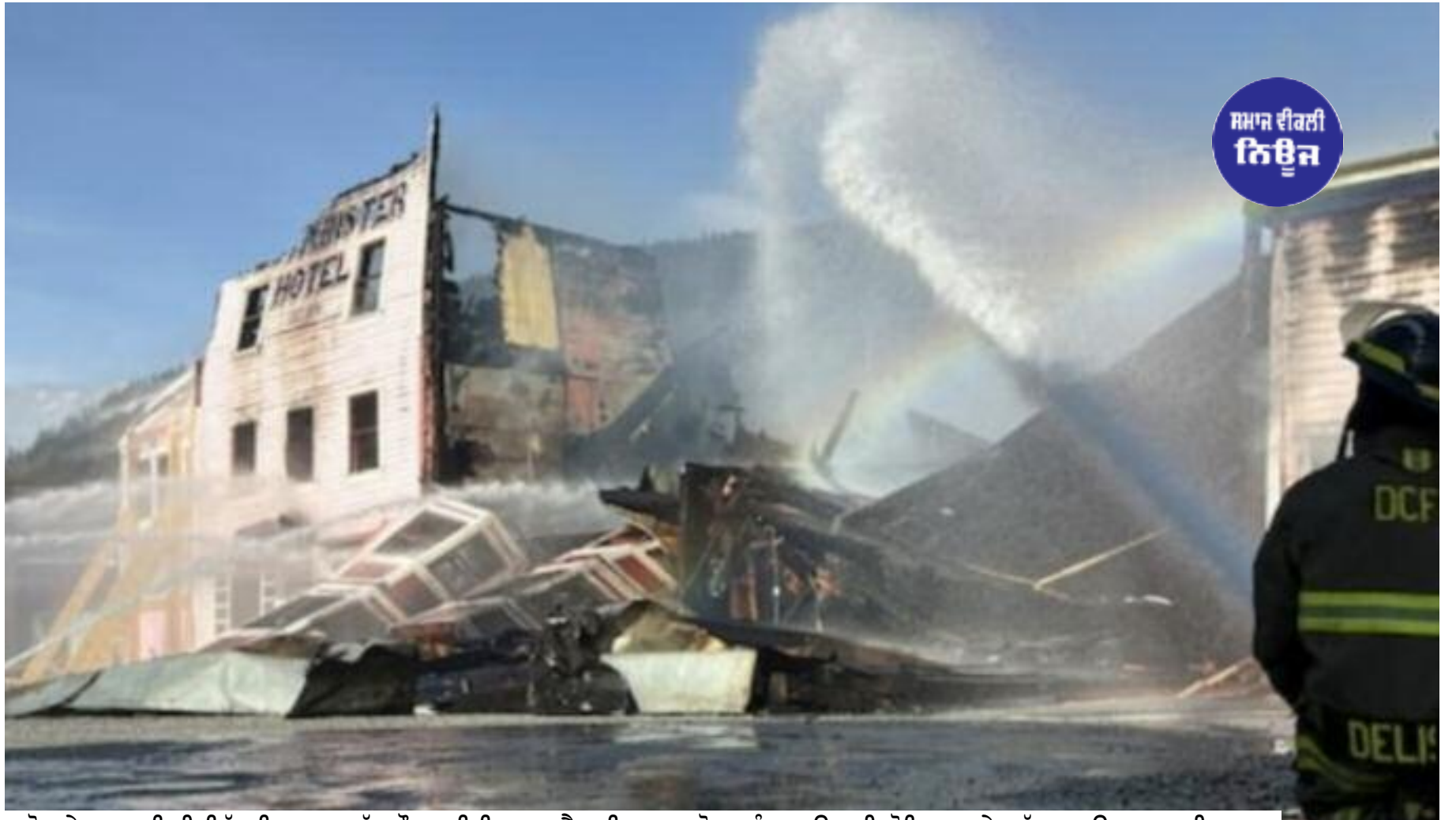
ਯੂਕੋਨ ਦੇ ਡਾਸਨ ਸਿਟੀ ਵਿੱਚ ਭਿਆਨਕ ਅੱਗ ਦੌਰਾਨ ਇਤਿਹਾਸਕ ਵੈਸਟਮਿਨਸਟਰ ਹੋਟਲ ਨੂੰ ਬਚਾਉਣ ਦੀ ਕੋਸ਼ਿਸ਼ ਕਰਦੇ ਅੱਗ ਬੁਝਾਉ ਕਰਮਚਾਰੀ।

'ਦ ਪਿਟ' ਦੇ ਨਾਂ ਨਾਲ ਮਸ਼ਹੂਰ ਵੈਸਟਮਿਨਸਟਰ ਹੋਟਲ ਵਿੱਚ ਐਤਵਾਰ ਸਵੇਰੇ ਅੱਗ ਲੱਗ ਗਈ, ਜਿਸ ਨੇ ਕੁਝ ਹੀ ਸਮੇਂ ਵਿੱਚ ਪੂਰੀ ਇਮਾਰਤ ਨੂੰ ਆਪਣੀ ਲਪੇਟ ਵਿੱਚ ਲੈ ਲਿਆ। ਅੱਗ ਇੰਨੀ ਭਿਆਨਕ ਸੀ ਕਿ ਅੱਗ ਬੁਝਾਉ ਕਰਮਚਾਰੀਆਂ ਨੂੰ ਕਾਫ਼ੀ ਮੁਸ਼ਕਲਾਂ ਦਾ ਸਾਹਮਣਾ ਕਰਨਾ ਪਿਆ ਸਥਾਨਕ ਨਿਵਾਸੀਆਂ ਦਾ ਕਹਿਣਾ ਹੈ ਕਿ ਇਸ ਅੱਗ ਨਾਲ ਸ਼ਹਿਰ ਦੀ ਇੱਕ ਇਤਿਹਾਸਕ ਪਛਾਣ ਖਤਮ ਹੋ ਗਈ ਹੈ।