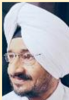
ਰਾਹੀ ਤਰਸੇਮ ਦੀਵਾਨਾ ਹੁਸ਼ਿਆਰਪੁਰ