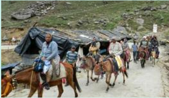
ਸਿਹਤ ਸਹੂਲਤਾਂ ਅਤੇ ਡਾਕਟਰੀ ਤਿਆਰੀ ਦਾ ਦਾਅਵਾ ਕਰਦੀ ਰਹਿੰਦੀ ਹੈ, ਪਰ ਮੌਤਾਂ ਦੀ ਵਧਦੀ ਗਿਣਤੀ

ਸੈਂਟਰ (SEOC) ਵੱਲੋਂ 14 ਮਈ ਨੂੰ ਸਵੇਰੇ 10 ਵਜੇ ਜਾਰੀ ਕੀਤੀ ਗਈ ਇੱਕ ਰਿਪੋਰਟ ਦੇ ਅਨੁਸਾਰ, ਚਾਰਧਾਮ ਯਾਤਰਾ ਦੌਰਾਨ ਹੁਣ ਤੱਕ 40 ਸ਼ਰਧਾਲੂਆਂ ਦੀ ਮੌਤ ਹੋ ਚੁੱਕੀ ਹੈ। ਕੇਦਾਰਨਾਥ ਵਿੱਚ ਸਭ ਤੋਂ ਵੱਧ 22 ਮੌਤਾਂ ਦਰਜ ਕੀਤੀਆਂ ਗਈਆਂ। ਬਦਰੀਨਾਥ ਵਿੱਚ ਸੱਤ, ਯਮੁਨੋਤਰੀ ਵਿੱਚ ਛੇ ਅਤੇ ਗੰਗੋਤਰੀ ਵਿੱਚ ਪੰਜ ਸ਼ਰਧਾਲੂਆਂ ਦੀ ਮੌਤ ਹੋ ਗਈ। ਸਰਕਾਰ ਬਿਹਤਰ