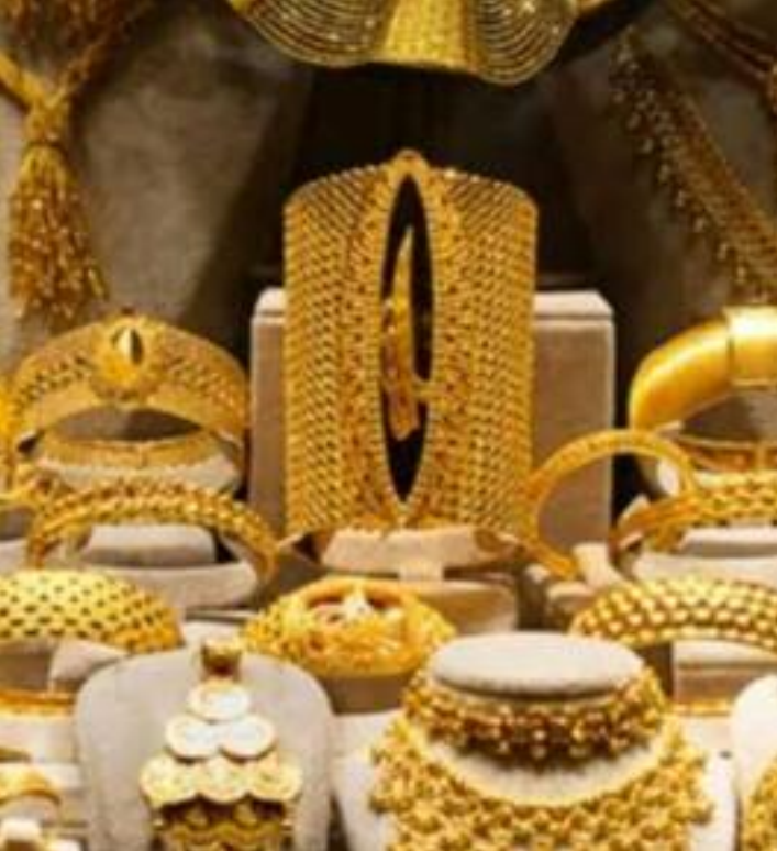
ਗ੍ਰਾਹਕ ਆਸਮਜਸ ਵਿੱਚ ਉਛਾਲ ਅਤੇ ਭਵਿੱਖ ਵਿੱਚ ਡਿਊਟੀ ਸੋਨੇ ਦੀਆਂ ਕੀਮਤਾਂ ਵਿੱਚ ਆਏ ਘੱਟਣ ਦੀ ਅਸ਼ਕਾ ਦੇ ਚੱਲਦੇ

ਕਤਰਾ ਰਹੇ ਹਨ ਅਤੇ ਕਈ ਗ੍ਰਾਹਕ ਇਸਦੇ ਇੰਤਜ਼ਾਰ ਵਿੱਚ ਹਨ ਕਿ ਸ਼ਾਇਦ ਅੱਗੇ ਚੱਲ ਕੇ ਕੀਮਤ ਘੱਟ ਹੋ ਜਾਣ। ਇਸਦਾ ਅਸਰ ਉਨ੍ਹਾਂ ਸੈਂਕੜੇ ਪਰਿਵਾਰਾਂ ਤੇ ਵੀ ਪੈ ਰਿਹਾ ਹੈ ਜੋ ਪੀੜੀਆਂ ਤੋਂ ਗਹਿਣੀਆ ਦੇ ਕਾਰੋਬਾਰ ਨਾਲ ਜੁੜੇ ਹੋਏ ਹਨ। ਜਿਲ੍ਹਾਂ ਸ਼ਹਿਦ ਭਗਤ ਸਿੰਘ ਨਗਰ ਵਰਗੇ ਵੱਡੇ ਸ਼ਹਿਰ ਵਿੱਚ ਜਿੱਥੇ ਵਿਆਹਾਂ ਦਾ ਸੀਜਨ ਵਿੱਚ ਸ਼ਰਾਫਾ ਬਜ਼ਾਰ ਵਿੱਚ ਖੂਬ ਰੌਣਕ ਰਹਿੰਦੀ ਸੀ ਅੱਜ ਉਥੇ ਸੁੰਨਸਾਨ ਪਈ ਹੈ ਤੇ ਸ਼ੋਅ ਰੂਮ ਖਾਲੀ ਪਏ ਹਨ। ਸ਼ਰਾਫਾ ਵਪਾਰੀਆਂ ਦਾ ਕਹਿਣਾ ਹੈ ਕਿ ਵਿਕਰੀ ਵਿੱਚ ਭਾਰੀ ਗਿਰਾਵਟ ਆਈ ਹੈ। ਬਾਜ਼ਾਰ ਵਿੱਚ ਪਹਿਲਾ ਵਾਲੀ ਚਹਿਲ ਪਹਿਲ ਨਹੀਂ ਹੈ। ਵਿਆਹ ਦੇ ਸੀਜਨ ਵਿੱਚ ਵੀ ਗ੍ਰਾਹਕਾਂ ਦੀ ਕਮੀ ਨੇ ਕਾਰੋਬਾਰੀਆਂ ਦੀ ਚਿੰਤਾ ਵਧਾ ਦਿੱਤੀ ਹੈ।