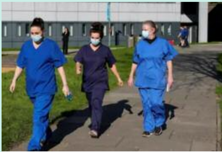
ਇੰਗਲੈਂਡ ਦੇ ਸਕੂਲਾਂ ਅਤੇ ਕਾਲਜਾਂ ਵਿੱਚ ਮੈਨਿੰਜਾਈਟਿਸ ਦੇ ਨਵੇਂ ਮਾਮਲਿਆਂ ਤੋਂ ਬਾਅਦ ਸਿਹਤ ਵਿਭਾਗ ਅਲਰਟ 'ਤੇ।