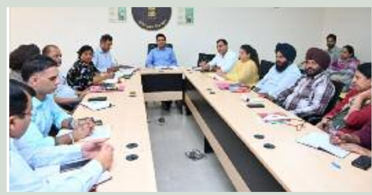
ਵਾਹਨ ਚਲਾਉਣ 'ਤੇ ਸਖ਼ਤੀ ਨਾਲ ਕਾਰਵਾਈ ਕਰਨ ਲਈ ਕਿਹਾ। ਉਨ੍ਹਾਂ ਕਿਹਾ ਕਿ ਸੜਕ ਸੁਰੱਖਿਆ ਹਫ਼ਤੇ ਅਤੇ ਹੋਰ ਮੁਹਿੰਮਾਂ ਦੌਰਾਨ

ਹੈਲਮਟ, ਸੀਟ ਬੈਲਟ ਅਤੇ ਨਸ਼ੇ ਵਿੱਚ ਗੱਡੀ ਨਾ ਚਲਾਉਣ ਦੇ ਮਹੱਤਵ ਬਾਰੇ ਦੱਸਿਆ ਜਾ ਸਕੇ। ਵਧੀਕ ਡਿਪਟੀ ਕਮਿਸ਼ਨਰ ਨੇ ਸੜਕਾਂ 'ਤੇ ਬਲੈਕ ਸਪਾਟਸ ਦੀ ਪਛਾਣ ਕਰਕੇ ਉਨ੍ਹਾਂ 'ਤੇ ਤੁਰੰਤ ਸੁਧਾਰਾਤਮਕ ਕਾਰਵਾਈ ਕਰਨ, ਸਪੀਡ ਬ੍ਰੇਕਰ, ਸਾਈਨ ਬੋਰਡ ਅਤੇ ਸਟ੍ਰੀਟ ਲਾਈਟਾਂ ਲਗਾਉਣ ਦੇ ਨਿਰਦੇਸ਼ ਵੀ ਦਿੱਤੇ। ਉਨ੍ਹਾਂ ਪੁਲਿਸ ਵਿਭਾਗ ਨੂੰ ਓਵਰ ਸਪੀਡਿੰਗ, ਓਵਰਲੋਡਿੰਗ ਅਤੇ ਨਾਬਾਲਗਾਂ ਵੱਲੋਂ