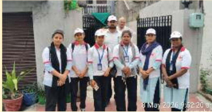
ਚਿਕਨਗੁਨੀਆ ਵਰਗੀਆਂ ਨੂੰ ਰੋਕਣਾ ਹੈ। ਸਰਵੇ ਦੌਰਾਨ ਬਿਮਾਰੀਆਂ ਪ੍ਰਤੀ ਜਾਗਰੂਕ ਕਰਨਾ ਅਤੇ ਇਨ੍ਹਾਂ ਦੇ ਫੈਲਾਅ ਦੁਆਲੇ ਪਾਣੀ ਇਕੱਠਾ ਹੋਣ

ਵੱਖ ਇਲਾਕਿਆਂ ਵਿੱਚ ਰੈੱਡ ਕਰਾਸ ਵਲੰਟੀਅਰਾਂ ਨੇ ਸਿਹਤ ਵਿਭਾਗ ਦੀਆਂ ਟੀਮਾਂ ਨਾਲ ਮਿਲ ਕੇ ਘਰ-ਘਰ ਜਾ ਕੇ ਸਰਵੇ ਕੀਤਾ। ਇਸ ਮੁਹਿੰਮ ਵਿੱਚ ਕਾਰਮਲਾਈਟ ਚੈਰੀਟੇਬਲ ਸੁਸਾਇਟੀ ਦੇ ਵਲੰਟੀਅਰਾਂ ਨੇ ਵੀ ਸਰਗਰਮ ਭੂਮਿਕਾ ਨਿਭਾਈ। ਡਿਪਟੀ ਕਮਿਸ਼ਨਰ ਨੇ ਦੱਸਿਆ ਕਿ ਇਸ ਮੁਹਿੰਮ ਦਾ ਮੁੱਖ ਉਦੇਸ਼ ਲੋਕਾਂ ਨੂੰ ਡੇਂਗੂ ਅਤੇ