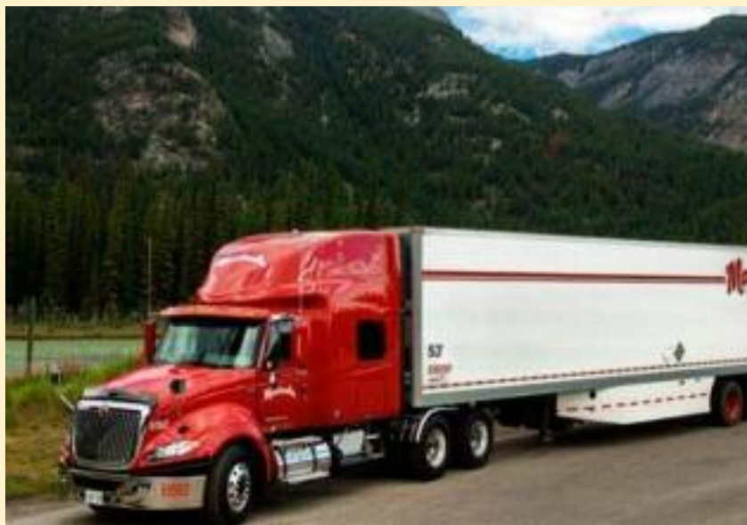
ਕੈਨੇਡਾ ਦੇ ਹਾਈਵੇ 'ਤੇ ਲੰਬੀ ਦੂਰੀ ਤੈਅ ਕਰਦੇ ਹੈਵੀ ਟਰੱਕ ਅਤੇ ਟ੍ਰੇਲਰ।

ਟਰੱਕ ਹਰ ਰੋਜ਼ ਸੜਕਾਂ 'ਤੇ ਚੱਲਦੇ ਹਨ। ਇਨ੍ਹਾਂ ਟਰੱਕਾਂ ਨੂੰ ਚਲਾਉਣ ਲਈ ਵੱਡੀ ਗਿਣਤੀ ਵਿੱਚ ਡਰਾਈਵਰਾਂ ਦੀ ਲੋੜ ਪੈਂਦੀ ਹੈ। ਟਰੱਕਿੰਗ ਉਦਯੋਗ ਨਾਲ ਸਿੱਧੇ ਅਤੇ ਅਸਿੱਧੇ ਤੌਰ 'ਤੇ ਲੱਖਾਂ ਲੋਕ ਜੁੜੇ ਹੋਏ ਹਨ। ਡਰਾਈਵਰਾਂ ਤੋਂ ਇਲਾਵਾ ਮਕੈਨਿਕ, ਡਿਸਪੈਚਰ, ਵੇਅਰਹਾਊਸ ਕਰਮਚਾਰੀ, ਸੁਰੱਖਿਆ ਅਧਿਕਾਰੀ ਅਤੇ ਦਫਤਰੀ ਸਟਾਫ ਵੀ ਇਸ ਉਦਯੋਗ ਦਾ ਮਹੱਤਵਪੂਰਨ ਹਿੱਸਾ ਹਨ। ਕੈਨੇਡਾ ਦੇ ਲਾਂਗ-ਹੌਲ ਡਰਾਈਵਰ ਕਈ ਵਾਰ ਇੱਕ ਟ੍ਰਿਪ ਦੌਰਾਨ 3 ਹਜ਼ਾਰ ਤੋਂ 4 ਹਜ਼ਾਰ ਕਿਲੋਮੀਟਰ ਤੱਕ ਦਾ ਸਫਰ ਤੈਅ ਕਰ ਲੈਂਦੇ ਹਨ। ਬ੍ਰਿਟਿਸ਼ ਕੋਲੰਬੀਆ ਤੋਂ ਓਂਟਾਰੀਓ ਜਾਂ ਕਿਊਬੈਕ ਤੱਕ ਸਮਾਨ ਲਿਜਾਣ ਵਾਲੇ ਡਰਾਈਵਰਾਂ ਨੂੰ ਕਈ ਦਿਨ ਲਗਾਤਾਰ ਹਾਈਵੇਅਜ਼ 'ਤੇ ਰਹਿਣਾ ਪੈਂਦਾ ਹੈ। ਕੁਝ ਡਰਾਈਵਰ ਕੈਨੇਡਾ ਤੋਂ ਅਮਰੀਕਾ ਦੇ ਕੈਲੀਫੋਰਨੀਆ, ਟੈਕਸਾਸ ਅਤੇ ਨਿਊਯਾਰਕ ਵਰਗੇ ਰਾਜਾਂ ਤੱਕ ਵੀ ਸਮਾਨ ਲੈ ਕੇ ਜਾਂਦੇ ਹਨ। ਟਰੱਕਿੰਗ ਉਦਯੋਗ ਦੀ ਸ਼ੁਰੂਆਤ ਕੈਨੇਡਾ ਵਿੱਚ ਪਿਛਲੀ ਸਦੀ ਦੇ ਸ਼ੁਰੂਆਤੀ ਦੌਰ ਵਿੱਚ ਹੋਈ ਸੀ, ਪਰ 1950 ਅਤੇ 1960 ਦੇ ਦਹਾਕਿਆਂ ਵਿੱਚ ਹਾਈਵੇ ਪ੍ਰਣਾਲੀ ਦੇ ਵਿਕਾਸ ਮਗਰੋਂ ਇਸ ਖੇਤਰ ਵਿੱਚ ਤੇਜ਼ੀ ਆਈ। ਟਰਾਂਸ-ਕੈਨੇਡਾ ਹਾਈਵੇ ਬਣਨ ਨਾਲ ਟਰੱਕਿੰਗ ਉਦਯੋਗ ਨੂੰ ਵੱਡਾ ਫਾਇਦਾ ਮਿਲਿਆ ਅਤੇ ਦੇਸ਼ ਦੇ ਪੂਰਬੀ ਅਤੇ