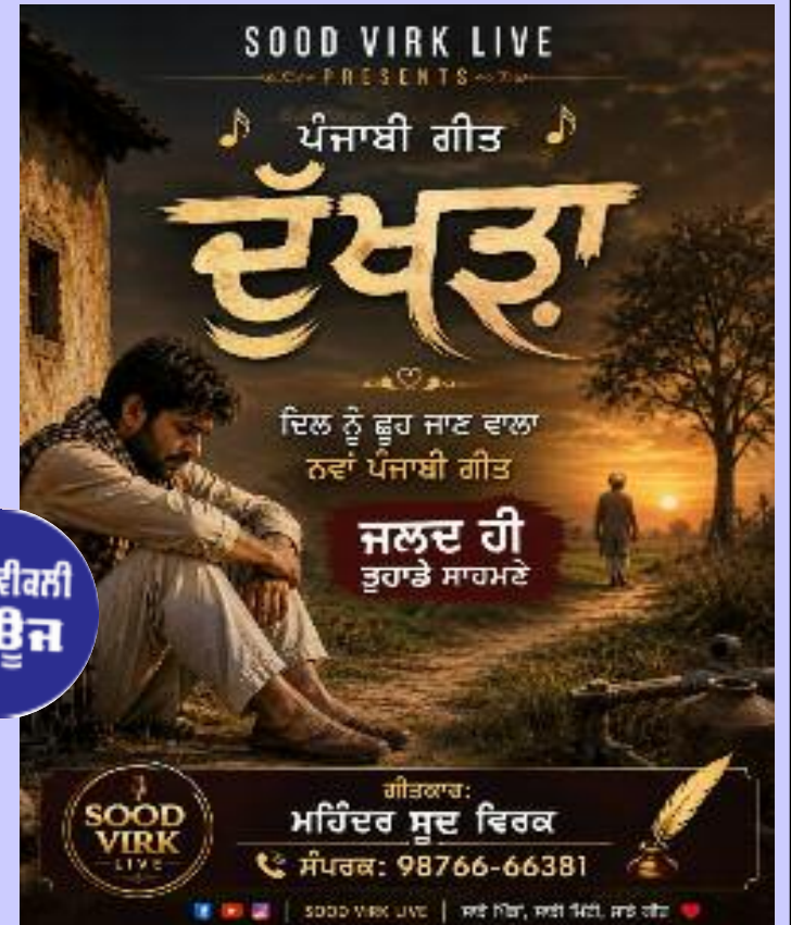
ਸਮਾਜ ਵੀਕਲੀ ਨਿਊਜ਼