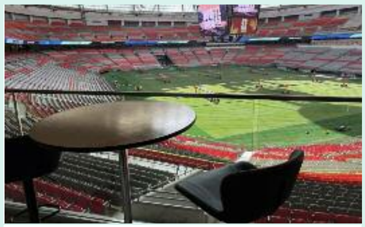
ਬੀ.ਸੀ. ਪਲੇਸ ਸਟੇਡੀਅਮ ਵਿੱਚ ਵਡੇ ਆਕਾਰੀ ਛੱਤ ਹੇਠਾਂ ਤਿਆਰ ਕੀਤਾ ਗਿਆ ਨਵਾਂ ਕੁਦਰਤੀ ਘਾਹ ਦਾ ਮੈਦਾਨ।

ਨਾਲ ਕਰਵਾਉਣ ਲਈ ਸ਼ਹਿਰੀ ਪ੍ਰਸ਼ਾਸਨ ਵੱਲੋਂ ਕਈ ਖਾਸ ਤਿਆਰੀਆਂ ਕੀਤੀਆਂ ਜਾ ਰਹੀਆਂ ਹਨ। ਇਸਦੇ ਨਾਲ ਹੀ ਬੀ.ਸੀ. ਪਲੇਸ ਸਟੇਡੀਅਮ ਵਿੱਚ ਵਡੇ ਆਕਾਰੀ ਛੱਤ ਹੇਠਾਂ ਉੱਚ ਤਕਨੀਕ ਵਾਲੇ ਕੁਦਰਤੀ ਘਾਹ ਦੇ ਮੈਦਾਨ ਦਾ ਵੀ ਉਦਘਾਟਨ ਕੀਤਾ ਗਿਆ ਹੈ, ਜੋ ਫੀਫਾ ਮਿਆਰਾਂ ਅਨੁਸਾਰ ਤਿਆਰ ਕੀਤਾ ਗਿਆ ਹੈ। ਅਧਿਕਾਰੀਆਂ ਦਾ ਕਹਿਣਾ ਹੈ ਕਿ ਇਨ੍ਹਾਂ ਨਵੇਂ ਨਿਯਮਾਂ ਦਾ ਮਕਸਦ ਫੀਫਾ ਵਰਲਡ ਕੱਪ ਦੌਰਾਨ ਸੁਰੱਖਿਆ, ਸਫ਼ਾਈ ਅਤੇ ਆਵਾਜਾਈ ਪ੍ਰਬੰਧਾਂ ਨੂੰ ਸੁਚਾਰੂ ਬਣਾਈ ਰੱਖਣਾ ਹੈ ਤਾਂ ਜੋ ਸਥਾਨਕ ਲੋਕਾਂ ਅਤੇ ਸੈਲਾਨੀਆਂ ਨੂੰ ਕਿਸੇ ਤਰ੍ਹਾਂ ਦੀ ਦਿੱਕਤ ਦਾ ਸਾਹਮਣਾ ਨਾ ਕਰਨਾ ਪਵੇ।