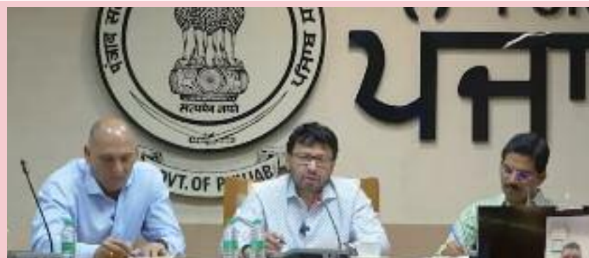
ਐਨਆਰਆਈ ਲੋਕਾਂ ਦੀਆਂ ਮੁਸ਼ਕਿਲਾਂ ਸੁਣਦੇ ਹੋਏ ਕੈਬਨੇਟ ਮੰਤਰੀ ਡਾ ਰਵਜੋਤ ਸਿੰਘ ਅਤੇ ਵੱਖ ਵੱਖ ਵਿਭਾਗਾਂ ਦੇ ਸਰਕਾਰੀ ਅਧਿਕਾਰੀ।

ਦੌਰਾਨ ਕੈਨੇਡਾ, ਇੰਗਲੈਂਡ, ਆਸਟ੍ਰੇਲੀਆ ਅਤੇ ਹੋਰ ਬਹੁਤ ਸਾਰੇ ਮੁਲਕਾਂ ਵਿੱਚ ਰਹਿ ਰਹੇ 16 ਪੰਜਾਬੀਆਂ ਨੇ ਆਪਣੀਆਂ ਮੁਸ਼ਕਿਲਾਂ ਦੇ ਵੇਰਵਿਆਂ ਨੂੰ ਸਾਂਝਾ ਕੀਤਾ ਜਿਨ੍ਹਾਂ ਨੂੰ ਕੈਬਨੇਟ ਮੰਤਰੀ ਡਾ: ਰਵਜੋਤ ਸਿੰਘ ਅਤੇ ਉਥੇ ਮੌਜੂਦ ਪ੍ਰਸ਼ਾਸਨਿਕ ਅਤੇ ਪੁਲਿਸ ਅਧਿਕਾਰੀਆਂ ਵੱਲੋਂ ਬੜੇ ਧਿਆਨ ਨਾਲ ਸੁਣ ਕੇ ਹਰੇਕ ਪਹਿਲੂ ਨੂੰ ਨੋਟ ਕੀਤਾ ਗਿਆ ਅਤੇ ਆਉਣ ਵਾਲੇ ਦਿਨਾਂ ਵਿੱਚ ਅਜਿਹੀਆਂ ਮੁਸ਼ਕਿਲਾਂ ਨੂੰ