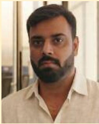
ਕਰੇਗੀ। ਉਨ੍ਹਾਂ ਕਿਹਾ, "12ਵੀਂ ਦਾ

ਨਤੀਜਾ ਇੱਕ ਵਿਦਿਆਰਥੀ ਦੇ ਜੀਵਨ ਵਿੱਚ ਇੱਕ ਮਹੱਤਵਪੂਰਨ ਮੀਲ ਪੱਥਰ ਹੈ, ਪਰ ਭਵਿੱਖ ਉਨ੍ਹਾਂ ਨੌਜਵਾਨਾਂ ਦਾ ਹੈ ਜੋ ਆਪਣੀ ਪੜ੍ਹਾਈ ਦੇ ਨਾਲ-ਨਾਲ ਉਦਯੋਗਿਕ ਹੁਨਰ ਸਿੱਖਣਗੇ। ਅੱਜ, ਐਨੀਮੇਸ਼ਨ, ਵੀਐਫਐਕਸ, ਗੇਮਿੰਗ, ਏਆਈ, ਮਲਟੀਮੀਡੀਆ, ਡਿਜ਼ੀਟਲ ਮਾਰਕੀਟਿੰਗ ਅਤੇ ਸਮੱਗਰੀ ਸਿਰਜਣਾ ਵਰਗੇ ਖੇਤਰਾਂ ਵਿੱਚ