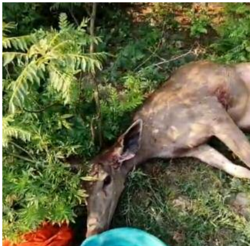
ਸ਼ਿਕਾਰੀ ਕੁੱਤਿਆਂ ਦੁਆਰਾ ਜ਼ਖਮੀ ਕੀਤੇ ਜਾਣ ਉਪਰੰਤ ਮਰ ਚੁੱਕੀ ਹਿਰਨੀ ਦੀ ਤਸਵੀਰ।