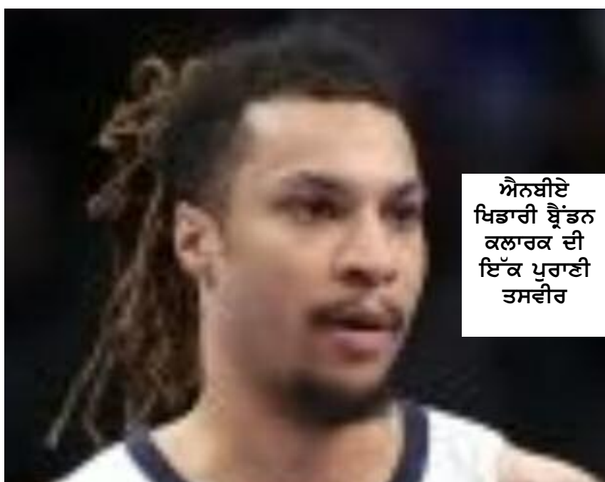
ਐਨਬੀਏ ਖਿਡਾਰੀ ਬ੍ਰੈਂਡਨ ਕਲਾਰਕ ਦੀ ਇੱਕ ਪੁਰਾਣੀ ਤਸਵੀਰ

ਐਨਬੀਏ ਵਿੱਚ ਖਾਸ ਪਛਾਣ ਬਣਾਈ ਸੀ। ਉਹ ਮੈਮਫਿਸ ਗ੍ਰਿਜ਼ਲੀਜ਼ ਲਈ ਇੱਕ ਮਹੱਤਵਪੂਰਨ ਖਿਡਾਰੀ ਮੰਨਿਆ ਜਾਂਦਾ ਸੀ ਅਤੇ ਆਪਣੇ ਜੋਸ਼ੀਲੇ ਪ੍ਰਦਰਸ਼ਨ ਕਾਰਨ ਪ੍ਰਸ਼ੰਸਕਾਂ ਵਿੱਚ ਕਾਫੀ ਲੋਕਪ੍ਰਿਯ ਸੀ। ਖੇਡ ਜਗਤ ਨਾਲ ਜੁੜੀਆਂ ਕਈ ਹਸਤੀਆਂ ਅਤੇ ਪ੍ਰਸ਼ੰਸਕਾਂ ਵੱਲੋਂ ਉਸਦੀ ਮੌਤ 'ਤੇ ਦੁੱਖ ਦਾ ਪ੍ਰਗਟਾਵਾ ਕੀਤਾ ਜਾ ਰਿਹਾ ਹੈ।