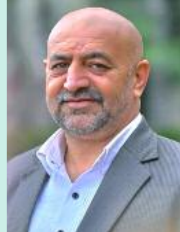
ਹੋਰ ਵਧਾ ਦਿੱਤਾ ਹੈ। ਉਹਨਾਂ ਕਿਹਾ ਕਿ ਘਰ ਦਾ ਕਿਰਾਇਆ, ਕਿਸਤਾਂ,

ਪਰਿਵਾਰਾਂ ਦਾ ਮਾਸਿਕ ਬੱਜਟ ਪ੍ਰਭਾਵਿਤ ਹੋ ਰਿਹਾ ਹੈ। ਮਹਿੰਗਾਈ ਇਸ ਸਮੱਸਿਆ ਦਾ ਸਭ ਤੋਂ ਵੱਡਾ ਕਾਰਨ ਬਣ ਕੇ ਉੱਭਰੀ ਹੈ। ਉਹਨਾਂ ਕਿਹਾ ਕਿ ਸਬਜ਼ੀਆਂ, ਖਾਣ ਵਾਲੇ ਤੇਲ, ਬਿਜਲੀ, ਟਰਾਂਸਪੋਰਟ ਅਤੇ ਸਿਹਤ ਸੇਵਾਵਾਂ ਦੀਆਂ ਕੀਮਤਾਂ ਵਿੱਚ ਪਿਛਲੇ ਕੁਝ ਸਾਲਾਂ ਵਿੱਚ ਲਗਾਤਾਰ ਵਾਧਾ ਦੇਖਣ ਨੂੰ ਮਿਲਿਆ ਹੈ। ਉਹਨਾਂ ਕਿ ਸੋਨੇ ਦੀਆਂ ਵੱਧਦੀਆਂ ਕੀਮਤਾਂ ਨੇ ਵੀ ਮੱਧ ਵਰਗ ਦੀਆਂ ਆਰਥਿਕ ਚਿੰਤਾਵਾਂ ਨੂੰ