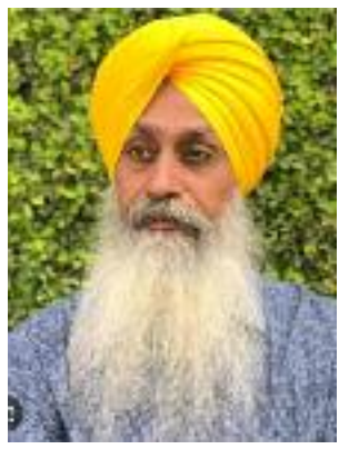
ਹਸਪਤਾਲ ਤੇ ਪੂਰਨ ਤੌਰ ਤੇ ਹਰਿਆਣਾ ਸਿੱਖ ਗੁਰਦੁਆਰਾ