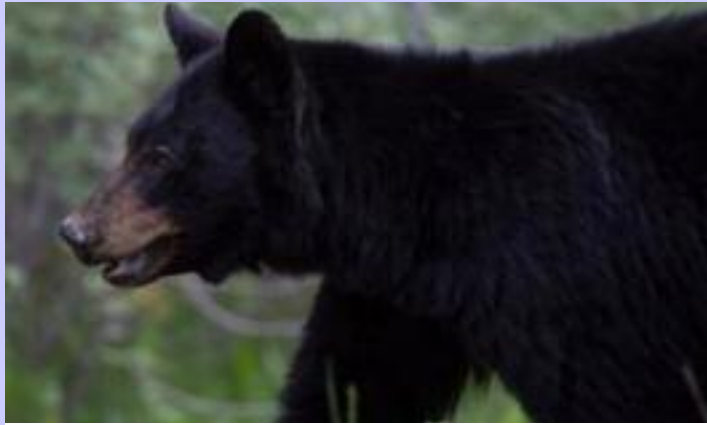
ਕੈਨੇਡਾ ਦੇ ਜੰਗਲੀ ਖੇਤਰ ਵਿੱਚ ਘੁੰਮਦਾ ਇੱਕ ਕਾਲਾ ਰਿੱਛ।

ਯੂਰੇਨੀਅਮ ਖੋਜ ਸਥਾਨ 'ਤੇ ਵਾਪਰੀ ਦੱਸੀ ਜਾ ਰਹੀ ਹੈ। ਪ੍ਰਾਪਤ ਵੇਰਵਿਆਂ ਅਨੁਸਾਰ 27 ਸਾਲਾ ਨੌਜਵਾਨ ਉਕਤ ਖੋਜ ਸਥਾਨ 'ਤੇ ਕੰਮ ਕਰ ਰਿਹਾ ਸੀ, ਜਦੋਂ ਅਚਾਨਕ ਇੱਕ ਕਾਲੇ ਰਿੱਛ ਨੇ ਉਸ 'ਤੇ ਹਮਲਾ ਕਰ ਦਿੱਤਾ। ਘਟਨਾ ਮਗਰੋਂ ਤੁਰੰਤ ਐਮਰਜੈਂਸੀ