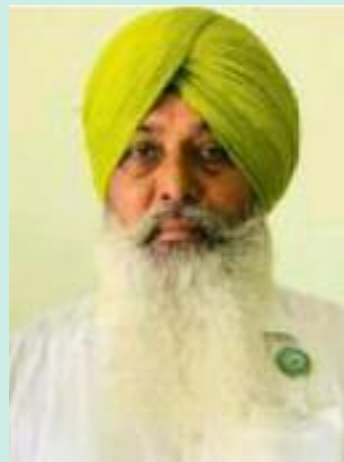
ਕਿਹਾ ਕਿ ਜੇਕਰ ਪ੍ਰਸ਼ਾਸਨ ਵੱਲੋਂ ਇਨ੍ਹਾਂ ਲੋਕਾਂ ਤੇ

ਕਾਰਵਾਈ ਸਮੇਂ ਸਿਰ ਕੀਤੀ ਹੁੰਦੀ ਅੱਜ ਵਿਸ਼ਾਲ ਧਰਨਾ ਲਗਾਉਣ ਦੀ ਨੋਬਤ ਨਾ ਆਉਂਦੀ ਜੇਕਰ ਪ੍ਰਸ਼ਾਸਨ ਸਾਡਾ ਓੜਕ ਦੇਖਣਾ ਚਾਹੁੰਦਾ ਹੈ ਤਾਂ ਇਹੀ ਸਹੀ ਉਨ੍ਹਾਂ ਕਿਹਾ ਕਿ 13 ਮਈ ਦਿਨ ਬੁੱਧਵਾਰ 11 ਵਜੇ ਮਹਿਤਪੁਰ ਥਾਣੇ ਅੱਗੇ ਹਜ਼ਾਰਾਂ ਦੀ ਗਿਣਤੀ ਵਿੱਚ ਪੰਜਾਬ ਦੇ ਕੋਨੇ ਕੋਨੇ ਵਿੱਚੋਂ ਪੁਜ ਕੇ ਬੀਕੇਯੂ ਪੰਜਾਬ ਦੇ ਆਗੂ ਅਣਮਿੱਥੇ ਸਮੇਂ ਲਈ ਧਰਨਾ ਲਗਾ ਕੇ ਜਿੱਤ ਦੇ ਨਿਸ਼ਾਨ ਝੰਡੇ ਨਾਲ ਗੱਡਣ ਗੇ ਅਤੇ ਇਹ ਧਰਨਾ ਅਣਮਿੱਥੇ ਸਮੇਂ ਲਈ ਉਨ੍ਹਾਂ ਚਿਰ ਚੱਲੇਗਾ ਜਿਨ੍ਹਾਂ ਚਿਰ ਪੀੜਤ ਕਿਸਾਨ ਨੂੰ ਇਨਸਾਫ਼ ਅਤੇ ਨਾਮਜ਼ਦ ਲੋਕਾਂ ਤੇ ਬਣਦੀ ਕਾਨੂੰਨੀ ਕਾਰਵਾਈ ਅਮਲ ਵਿੱਚ ਨਹੀਂ ਲਿਆਂਦੀ ਜਾਂਦੀ। ਇਸ ਧਰਨੇ ਤੋਂ ਨਿਕਲਣ ਵਾਲੇ ਸਿਟਿਆਂ ਦੀ ਜ਼ਿੰਮੇਵਾਰੀ ਪ੍ਰਸ਼ਾਸਨ ਦੀ ਹੋਵੇਗੀ।