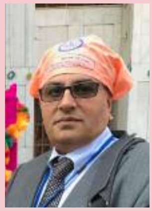
ਰਾਜ ਬੰਗਾਰ ਯੂਕੇ ਅਤੇ ਬੱਲਾਂ

ਮਾਰਗਦਰਸ਼ਨ ਦਿੱਤਾ ਹੈ। ਇਹ ਮਾਰਗ ਆਸਾਨ ਨਹੀਂ, ਪਰ ਇਹ ਸੱਚ ਦਾ ਮਾਰਗ ਹੈ। ਆਓ, ਇਸ ਸ਼ਹੀਦੀ ਨੂੰ ਕੇਵਲ ਯਾਦਗਾਰੀ ਦਿਵਸ ਨਾ ਬਣਾਈਏ। ਇਸਨੂੰ ਇੱਕ ਵਚਨ ਬਣਾਈਏ। ਕਿਉਂਕਿ ਸਭ ਤੋਂ ਵੱਡੀ ਸ਼ਰਧਾਂਜਲੀ ਕੇਵਲ ਯਾਦ ਨਹੀਂ— ਸਗੋਂ ਉਸ ਸੱਚ ਨੂੰ ਹਰ ਰੋਜ਼ ਜੀਵਨ ਵਿੱਚ ਅਪਣਾਉਣਾ ਹੈ।