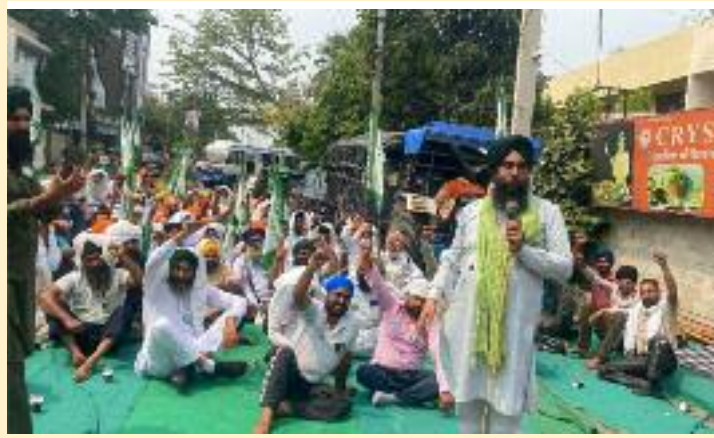
ਮਜਬੂਰ ਕਰ ਦਿੱਤਾ। ਹੱਦ ਤਾਂ ਉਦੋਂ ਹੋ ਗਈ ਜਦੋਂ ਪੁਲਿਸ ਪ੍ਰਸ਼ਾਸਨ ਨੇ ਕਿਸਾਨਾਂ ਨੂੰ ਸੜਕ 'ਤੇ ਤੰਬੂ (ਟੈਂਟ) ਲਗਾਉਣ ਤੋਂ ਵੀ ਰੋਕ ਦਿੱਤਾ। ਪ੍ਰਧਾਨ

ਅਗਵਾਈ ਹੇਠ ਅੰਮ੍ਰਿਤਸਰ ਵਿਖੇ ਸਹਿਕਾਰੀ ਖੇਤੀਬਾੜੀ ਵਿਕਾਸ ਬੈਂਕ ਦੇ ਬਾਹਰ ਜ਼ੋਰਦਾਰ ਪ੍ਰਦਰਸ਼ਨ ਕਰਦਿਆਂ ਰਾਤ-ਦਿਨ ਦਾ ਪੱਕਾ ਮੋਰਚਾ ਲਗਾ ਦਿੱਤਾ ਗਿਆ ਹੈ। ਹੈਰਾਨੀ ਦੀ ਗੱਲ ਇਹ ਹੈ ਕਿ ਜਿੱਥੇ ਇੱਕ ਪਾਸੇ ਕਿਸਾਨ ਆਪਣੇ ਸਾਥੀਆਂ ਦੀਆਂ ਜਾਨਾਂ ਜਾਣ ਦਾ ਦੁੱਖ ਮਨਾ ਰਹੇ ਹਨ, ਉੱਥੇ ਹੀ ਅੰਮ੍ਰਿਤਸਰ ਪੁਲਿਸ ਦਾ ਵਤੀਰਾ ਬੇਹੱਦ ਅਤੀਅਲ ਅਤੇ ਗੈਰ-ਮਨੁੱਖੀ ਰਿਹਾ ਹੈ। ਜਥੇਬੰਦੀ ਬੈਂਕ ਦੇ ਬਿਲਕੁਲ ਅੱਗੇ ਸ਼ਾਂਤਮਈ ਧਰਨਾ ਦੇਣਾ ਚਾਹੁੰਦੀ ਸੀ, ਪਰ ਪੁਲਿਸ ਨੇ ਜਬਰੀ ਕਿਸਾਨਾਂ ਨੂੰ ਸੜਕ ਦੇ ਵਿਚਕਾਰ ਧਰਨਾ ਲਗਾਉਣ ਲਈ