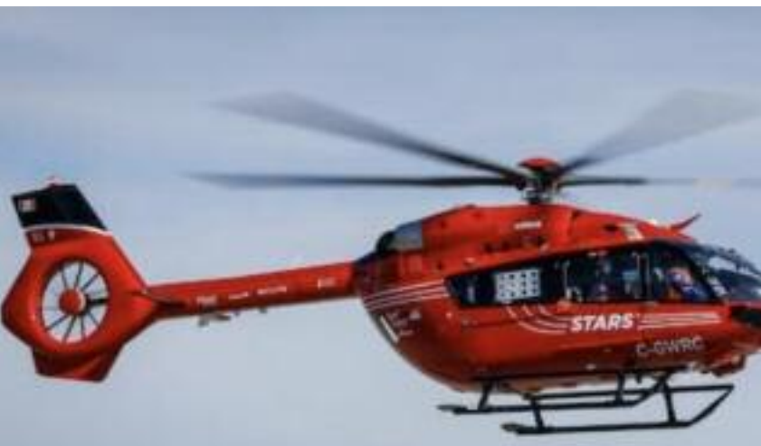
ਕੈਲਗਰੀ ਨੇੜੇ ਵਾਪਰੇ ਭਿਆਨਕ ਹਾਦਸੇ ਮਗਰੋਂ ਮੌਕੇ 'ਤੇ ਪਹੁੰਚਿਆ ਏਅਰ ਐਂਬੂਲੈਂਸ ਹੈਲੀਕਾਪਟਰ।

ਵੈਨਕੂਵਰ, ਮਈ (ਮਲਕੀਤ ਸਿੰਘ) - ਕੈਨੇਡਾ ਦੇ ਕੈਲਗਰੀ ਸ਼ਹਿਰ ਦੇ ਉੱਤਰ-ਪੂਰਬੀ ਇਲਾਕੇ ਨੇੜੇ ਵਾਪਰੇ ਇੱਕ ਭਿਆਨਕ ਸੜਕ ਹਾਦਸੇ ਦੌਰਾਨ 2 ਲੋਕਾਂ ਦੀ ਮੌਤ ਹੋ ਜਾਣ ਅਤੇ ਇੱਕ ਬੱਚੇ ਸਮੇਤ ਤਿੰਨ ਹੋਰਨਾਂ ਦੇ ਗੰਭੀਰ ਰੂਪ ਵਿੱਚ ਜਖਮੀ ਹੋਣ ਦੀ ਸੂਚਨਾ ਹੈ। ਇਹ ਹਾਦਸਾ ਐਤਵਾਰ ਸਵੇਰੇ ਵਾਪਰਿਆ, ਜਿਸ ਮਗਰੋਂ ਐਮਰਜੈਂਸੀ ਸੇਵਾਵਾਂ ਅਤੇ ਪੁਲਿਸ ਤੁਰੰਤ ਮੌਕੇ 'ਤੇ ਪਹੁੰਚ ਗਈ।