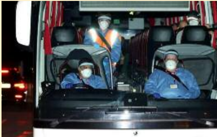
ਬਰਤਾਨਵੀ ਨਾਗਰਿਕਾਂ ਨੂੰ ਬੱਸ ਰਾਹੀਂ ਹਸਪਤਾਲ ਲਿਜਾਏ ਹੋਏ..

ਪ੍ਰੋਫੈਸਰ ਰੋਬਿਨ ਮੇ ਨੇ ਦੱਸਿਆ ਕਿ ਸਾਰੇ ਯਾਤਰੀ ਇਸ ਵੇਲੇ “ਤੰਦਰੁਸਤ ਅਤੇ ਬਿਨਾਂ ਲੱਛਣਾਂ ਵਾਲੇ” ਹਨ। ਉਨ੍ਹਾਂ ਕਿਹਾ ਕਿ ਯਾਤਰੀ ਪਹਿਲਾਂ 72 ਘੰਟੇ ਹਸਪਤਾਲ ਵਿੱਚ ਰਹਿਣਗੇ ਅਤੇ ਉਸ ਤੋਂ ਬਾਅਦ 42 ਦਿਨ ਆਪਣੇ ਘਰਾਂ ਵਿੱਚ ਇਕਾਂਤਵਾਸ ਕਰਨਗੇ। ਹਾਲਾਤ ਦੇ ਅਨੁਸਾਰ ਇਕਾਂਤਵਾਸ ਦੀ ਮਿਆਦ ਵਿੱਚ ਤਬਦੀਲੀ ਵੀ ਕੀਤੀ ਜਾ ਸਕਦੀ ਹੈ। ਹਸਪਤਾਲ ਪ੍ਰਬੰਧਕਾਂ ਮੁਤਾਬਕ ਯਾਤਰੀਆਂ ਨੂੰ ਸਵੈ-ਨਿਰਭਰ ਫਲੈਟਾਂ ਵਿੱਚ ਰੱਖਿਆ ਗਿਆ ਹੈ, ਜਿੱਥੇ ਫੋਨ ਅਤੇ ਹੋਰ ਜ਼ਰੂਰੀ ਸਹੂਲਤਾਂ ਉਪਲਬਧ ਕਰਵਾਈਆਂ ਗਈਆਂ ਹਨ। ਵਿਸ਼ੇਸ਼ ਮੈਡੀਕਲ ਟੀਮ ਉਨ੍ਹਾਂ ਦੀ ਲਗਾਤਾਰ ਜਾਂਚ ਅਤੇ ਮਾਨਸਿਕ