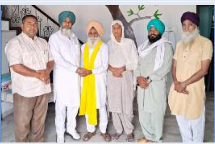
ਦੀ ਅਵਾਜ ਵਿਚ ਰਿਕਾਰਡ ਸੁਨੇਹਾ ਮੇਰੇ ਬਾਬਲ ਵਰਗਿਆ ਹੋਇਆ ਗੀਤ 'ਲੈ ਜੀ ਇੱਕ ਵੇ' (ਕੋਲਾ)