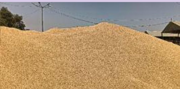
ਮਾਰਕੀਟ ਕਮੇਟੀ ਦੀ ਨਾਕਾਮੀ ਕਾਰਨ ਖਰਚਾ ਕਰਕੇ ਕਿਰਾਏ ਦੀਆਂ ਗੱਡੀਆਂ ਆੜੂਤੀਆਂ ਨੂੰ ਆਪਣੀ ਜੇਬ ਵਿੱਚੋਂ ਦਾ ਪ੍ਰਬੰਧ ਕਰਨਾ ਪੈ ਰਿਹਾ ਹੈ।

ਮੰਡੀ ਵਿੱਚ ਕੁੱਲ 6 ਲੱਖ ਤੋੜੇ ਕਣਕ ਦੀ ਖ਼ਰੀਦ ਹੋਈ ਸੀ, ਜਿਸ ਵਿੱਚੋਂ ਕਰੀਬ 4 ਲੱਖ ਤੋੜੇ ਅਜੇ ਵੀ ਮੰਡੀ ਵਿੱਚ ਹੀ ਰੁਲ ਰਹੇ ਹਨ। ਸਰਕਾਰ ਵੱਲੋਂ ਸਮੇਂ ਸਿਰ ਲਿਫਟਿੰਗ ਨਾ ਹੋਣ ਕਾਰਨ ਮੰਡੀ ਅਨਾਜ ਦੇ ਢੇਰਾਂ ਨਾਲ ਭਰੀ ਪਈ ਹੈ, ਪਰ ਪ੍ਰਸ਼ਾਸਨ ਦੇ ਕੰਨ 'ਤੇ ਜੂੰ ਤੱਕ ਨਹੀਂ ਸਰਕ ਰਹੀ। ਸੀਜ਼ਨ ਖ਼ਤਮ ਹੋਣ ਉਪਰੰਤ ਲੇਬਰ ਆਪਣੇ ਘਰਾਂ ਨੂੰ ਪਰਤ ਚੁੱਕੀ ਹੈ, ਜਿਸ ਕਾਰਨ ਗੱਡੀਆਂ ਲੋਡ ਕਰਨ ਵਿੱਚ ਭਾਰੀ ਦਿੱਕਤਾਂ ਆ ਰਹੀਆਂ ਹਨ।