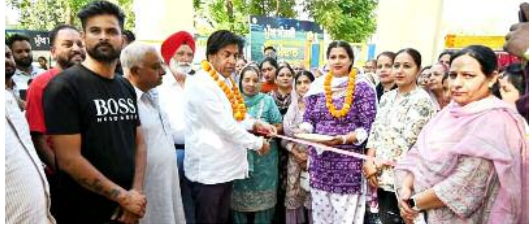
ਸੈਰ ਲਈ ਇੱਕ ਸੁਰੱਖਿਅਤ ਉਪਲਬਧ ਹੋਵੇਗਾ, ਜਿਸ ਨਾਲ ਲੋਕਾਂ ਦੀ ਸਿਹਤ ਵਿੱਚ ਸੁਧਾਰ ਹੋਵੇਗਾ। ਵਿਧਾਇਕ ਨੇ ਕਿਹਾ ਕਿ ਅਜਿਹੇ ਯਤਨ ਪਿੰਡਾਂ ਵਿੱਚ

ਵਿਕਸਿਤ ਕਰ ਰਹੀ ਹੈ। ਉਨ੍ਹਾਂ ਦੱਸਿਆ ਕਿ ਹਰ ਵਿਧਾਨ ਸਭਾ ਹਲਕੇ ਵਿੱਚ ਲਗਭਗ 30 ਖੇਡ ਮੈਦਾਨ ਸਥਾਨਕ ਲੋੜਾਂ ਅਨੁਸਾਰ ਬਣਾਏ ਜਾ ਰਹੇ ਹਨ ਤਾਂ ਜੋ ਨੌਜਵਾਨਾਂ ਨੂੰ ਆਪਣੇ ਪਿੰਡਾਂ ਦੇ ਨੇੜੇ ਹੀ ਖੇਡ ਸਹੂਲਤਾਂ ਮਿਲ ਸਕਣ ਅਤੇ ਉਹ ਨਸ਼ਿਆਂ ਵਰਗੀਆਂ ਬੁਰੀਆਂ ਆਦਤਾਂ ਤੋਂ ਦੂਰ ਰਹਿਣ। ਉਨ੍ਹਾਂ ਕਿਹਾ ਕਿ ਇਹ ਖੇਡ ਮੈਦਾਨ ਸਿਰਫ ਨੌਜਵਾਨਾਂ ਲਈ ਹੀ ਨਹੀਂ, ਸਗੋਂ ਪਿੰਡ ਦੀਆਂ ਮਹਿਲਾਵਾਂ ਅਤੇ ਬਜ਼ੁਰਗਾਂ ਲਈ ਵੀ ਬਹੁਤ ਲਾਭਕਾਰੀ ਸਾਬਤ ਹੋਵੇਗਾ। ਇੱਥੇ ਸਵੇਰ ਅਤੇ ਸ਼ਾਮ ਦੀ ਸੈਰ ਅਤੇ