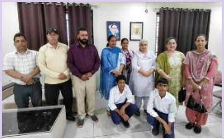
ਸਹਿਯੋਗ ਵਧੇਰੇ ਹੁੰਦਾ ਹੈ ਲ ਕਿਉਂਕਿ ਮਾਂ ਪਿਓ ਜਨਮ ਦਿੰਦੇ ਹਨ ਪ੍ਰੰਤੂ ਅਧਿਆਪਕ ਸਮਾਜ ਵਿੱਚ ਵਿਚਰਨਾ ਸਿਖਾਉਂਦੇ ਹਨ ਲ ਇਸ ਲਈ ਮੈਂ ਅਧਿਆਪਕ ਸਹਿਬਾਨਾਂ ਨੂੰ ਵੀ ਬਹੁਤ ਮੁਬਾਰਕਾਂ ਦਿੰਦੀ ਹਾਂ । thank you ਸਮਰ ਪੁੱਤਰ. ..ਸਾਨੂੰ ਸਭ ਨੂੰ ਮਾਣ -ਮਹਿਸੂਸ