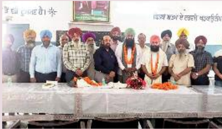
ਮੁਲਾਜ਼ਮਾਂ ਨੂੰ ਲੰਬੇ ਸਮੇਂ ਤੱਕ ਬਿਨ੍ਹਾ ਤਨਖਾਹਾਂ ਤੋਂ ਕੰਮ ਕਰਨਾ ਪੈ ਰਿਹਾ ਹੈ। ਸਿੱਖਿਆ ਅਤੇ ਵਿੱਤ ਵਿਭਾਗ ਸਕੂਲਾਂ ਦੀਆਂ ਕਮੇਟੀਆਂ ਦੇ ਆਡਿਟ ਦੇ ਬਹਾਨੇ ਅਧਿਆਪਕਾਂ ਨੂੰ ਤਨਖਾਹਾਂ ਤੋਂ ਵਾਂਝੇ ਰੱਖ ਰਹੇ ਹਨ। ਉਹਨਾਂ ਕਿਹਾ ਕਿ ਪੰਜਾਬ