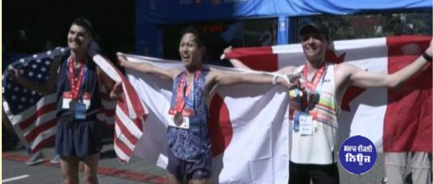
ਵੈਨਕੂਵਰ ਵਿੱਚ ਆਯੋਜਿਤ ਬੀਐਮਓ ਮੈਰਾਥਨ ਦੌਰਾਨ ਅੱਵਲ ਰਹਿਣ ਵਾਲੇ ਦੌੜਾਕ।

ਵੈਨਕੂਵਰ, ਮਈ (ਮਲਕੀਤ ਸਿੰਘ) - ਕੈਨੇਡਾ ਦੇ ਵੈਨਕੂਵਰ ਸ਼ਹਿਰ ਵਿੱਚ ਆਯੋਜਿਤ ਬੀਐਮਓ ਵੈਨਕੂਵਰ ਮੈਰਾਥਨ ਦੌਰਾਨ ਦੌੜਾਕਾਂ ਨੇ ਸ਼ਾਨਦਾਰ ਪ੍ਰਦਰਸ਼ਨ ਕਰਦਿਆਂ ਨਵੇਂ ਰਿਕਾਰਡ ਕਾਇਮ ਕੀਤੇ ਹਨ। ਇਸ ਵੱਡੇ ਖੇਡ ਸਮਾਗਮ ਦੌਰਾਨ ਦੇਸ਼ ਭਰ ਤੋਂ ਹਜ਼ਾਰਾਂ ਦੌੜਾਕਾਂ ਨੇ ਭਾਗ ਲਿਆ ਅਤੇ ਵੈਨਕੂਵਰ ਦੀਆਂ ਸੜਕਾਂ 'ਤੇ ਖੇਡ ਪ੍ਰੇਮੀਆਂ ਦਾ ਜੋਸ਼ ਦੇਖਣਯੋਗ ਰਿਹਾ। ਜਾਣਕਾਰੀ ਅਨੁਸਾਰ ਇਸ ਸਾਲ ਦੀ ਮੈਰਾਥਨ ਦੌਰਾਨ ਮਹਿਲਾ ਵਰਗ ਦੀ ਮੌਜੂਦਗੀ ਚ ਵਾਧਾ ਹੋਣਾ ਕਿਆਸਿਆ ਗਿਆ ਜਿਸ ਨਾਲ ਪੁਰਾਣੇ ਰਿਕਾਰਡ ਟੁੱਟ ਗਏ।