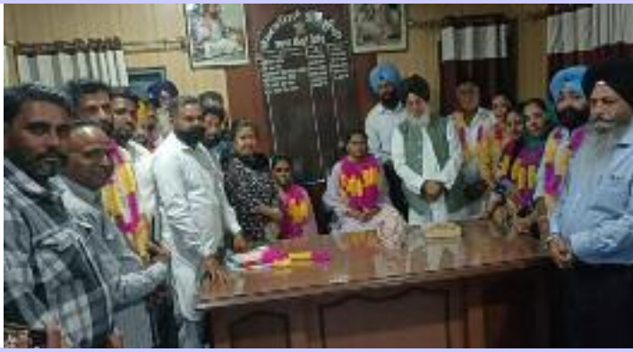
ਦੇ ਸਰਪੰਚ ਸਾਹਿਬਾਨਾਂ ਨੇ ਜੋ ਪ੍ਰਸਤਾਵ ਰੱਖੇ ਸੀ ਉਹਨਾਂ ਨੂੰ ਪੂਰੇ ਕਰਦੇ ਹੋਏ ਔਰ ਆਪਣੀ ਪਾਰਟੀ ਦੇ ਸੂਬਾ ਪ੍ਰਧਾਨ ਜੀ ਦੇ ਦਿਸ਼ਾ ਨਿਰਦੇਸ਼ਾਂ ਤਹਿਤ ਅੱਜ ਸਾਰੇ