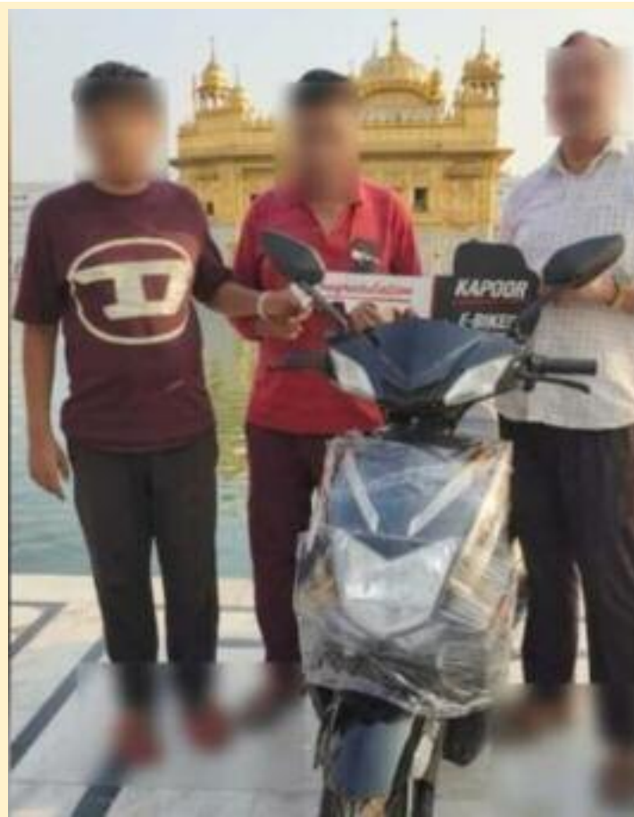
ਗਿਆ ਸੀ। ਉਸ ਨੂੰ ਲੰਗਰ ਹਾਲ ਵਿੱਚ ਲੰਗਰ ਛੱਕਦੇ ਵੀ ਦਿਖਾਇਆ ਗਿਆ ਸੀ ਇਸ ਦੌਰਾਨ, ਸ਼੍ਰੋਮਣੀ ਗੁਰਦੁਆਰਾ ਪ੍ਰਬੰਧਕ ਕਮੇਟੀ (SGPC) ਨੇ ਵੀ ਫੋਟੋ ਦੀ ਜਾਂਚ ਸ਼ੁਰੂ ਕਰ ਦਿੱਤੀ ਹੈ।

ਅੰਮ੍ਰਿਤਸਰ। ਅੰਮ੍ਰਿਤਸਰ ਦੇ ਹਰਿਮੰਦਰ ਸਾਹਿਬ ਦੀ ਏਆਈ (ਆਰਟੀਫੀਸ਼ੀਅਲ ਇੰਟੈਲੀਜੈਂਸ) ਨਾਲ ਮੁੜ ਬੇਅਦਬੀ ਕੀਤੀ ਗਈ। ਇਸ ਦੀ ਤਸਵੀਰ ਵੀ ਸਾਹਮਣੇ ਆਈ ਹੈ। ਇਸ ਵਿੱਚ ਤਿੰਨ ਲੋਕ ਇੱਕ ਲੜਕਾ ਅਤੇ ਦੋ ਆਦਮੀ - ਦਰਬਾਰ ਸਾਹਿਬ ਵਿਖੇ ਨੰਗੇ ਸਿਰ ਤੇ ਚੱਪਲਾਂ 'ਚ ਨਜ਼ਰ ਆਏ। ਇੰਨਾ ਹੀ ਨਹੀਂ ਇਨ੍ਹਾਂ ਨੇ ਬੇਅਦਬੀ ਵਾਲੀ ਤਸਵੀਰ ਦਾ ਸਟੇਟਸ ਵੀ ਲਾਇਆ। ਤਿੰਨਾਂ ਨੇ ਸਿਰ ਵੀ ਨਹੀਂ ਢਕਿਆ ਹੋਇਆ ਸੀ। ਉਹ ਇੱਕ ਨਵੀਂ ਐਕਟਿਵਾ ਦੀਆਂ ਚਾਬੀਆਂ ਫੜੀ ਫੋਟੋ ਲਈ ਪੇਂਜ ਦਿੰਦੇ ਵਿਖਾਈ ਦਿੱਤੇ। ਇਸ ਨਾਲ ਲੋਕਾਂ ਵਿੱਚ ਰੋਸ ਫੈਲ ਗਿਆ ਹੈ। ਜਦੋਂ ਸਿੱਖ ਨੇ ਫੋਨ ਕਰਕੇ ਉਸ ਆਦਮੀ ਤੋਂ ਸਵਾਲ ਕੀਤਾ, ਤਾਂ ਉਸ ਨੇ ਕਿਹਾ, "ਅਸੀਂ ਇਸ ਨੂੰ ਡਿਲੀਟ ਕਰ ਦੇਵਾਂਗੇ। ਅਸੀਂ ਮੁਆਫ਼ੀ ਮੰਗਦੇ ਹਾਂ, ਇਹ ਅਣਜਾਣੇ ਵਿੱਚ ਹੋਇਆ। ਕਿਰਪਾ ਕਰਕੇ ਸਾਨੂੰ ਮੁਆਫ਼ ਕਰੋ।" ਹਾਲਾਂਕਿ, ਇਹ ਪਹਿਲੀ ਅਜਿਹੀ ਘਟਨਾ ਨਹੀਂ ਹੈ। ਕੁਝ ਦਿਨ ਪਹਿਲਾਂ, ਇੱਕ ਏਆਈ ਵੀਡੀਓ ਬਣਾਈ ਗਈ ਸੀ ਜਿਸ ਵਿੱਚ ਇੱਕ ਪਿੰਜਰ ਨੂੰ ਪੱਗ ਬੰਨ੍ਹ ਕੇ ਪਰਿਕਰਮਾ ਕਰਦੇ ਦਿਖਾਇਆ