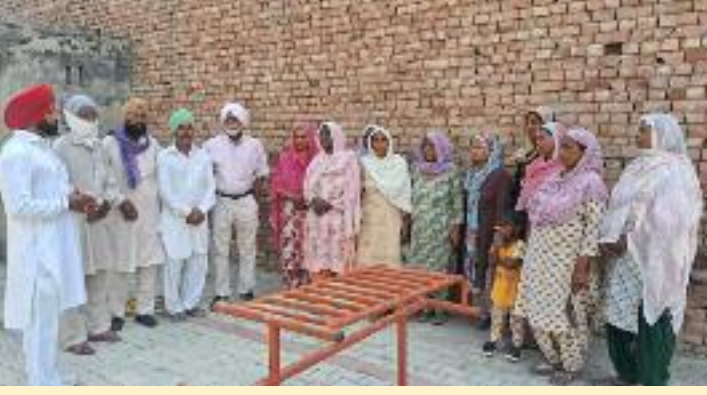
ਹਨ ਤੇ ਸ਼ਰਧਾਂਜਲੀ ਭੇਂਟ ਕਰਦੇ ਹਨ। ਪ੍ਰੈਸ ਨਾਲ ਗੱਲਬਾਤ

ਅੱਤਵਾਦ ਦੀ ਭੇਂਟ ਚੜੇ , ਉਨ੍ਹਾਂ ਨੂੰ ਯਾਦ ਕਰਦਿਆਂ , ਉਨ੍ਹਾਂ ਦੇ ਪਿੰਡ ਔਲਖ ਵਾਸੀਆਂ ਤੇ ਕਮਿਊਨਿਸਟ ਪਾਰਟੀ ਅਤੇ ਨਰੇਗਾ ਮਜਦੂਰਾਂ ਵੱਲੋਂ ਉਨ੍ਹਾਂ ਨੂੰ ਹਰ ਸਾਲ ਇਕ ਸਾਨਦਾਰ ਸਮਾਗਮ ਉਨ੍ਹਾਂ ਨੂੰ ਸ਼ਰਧਾਂਜਲੀ ਭੇਂਟ ਕਰਨ ਲਈ ਕੀਤਾ ਜਾਂਦਾ ਹੈ। ਜਿਸ ਵਿਚ ਆਸ ਪਾਸ ਦੇ ਪਿੰਡਾਂ ਤੇ ਨਰੇਗਾ ਮਜਦੂਰ, ਪਾਰਟੀ ਵਰਕਰ ਕਤਾਰਾਂ ਬੰਨ ਕੇ ਪੁਜਦੇ