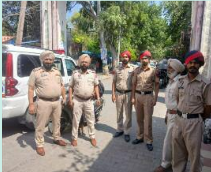
ਸਖਤ ਸੁਰੱਖਿਆ ਪ੍ਰਬੰਧ ਦੀਆਂ ਮੂਹ ਬੋਲਦੀਆਂ ਤਸਵੀਰਾਂ।

ਨਿਗਰਾਨੀ ਬਣੀ ਰਿਹਾ ਹੈ, ਤਾਂ ਜੋ ਦਰਸ਼ਨਾਂ ਲਈ ਆਉਣ ਵਾਲੇ ਸ਼ਰਧਾਲੂਆਂ ਨੂੰ ਕਿਸੇ ਵੀ ਤਰ੍ਹਾਂ ਦੀ ਅਸੁਵਿਧਾ ਦਾ ਸਾਹਮਣਾ ਨਾ ਕਰਨਾ ਪਵੇ। ਹਲਕੇ ਵਾਹਨਾਂ, ਭਾਰੀ ਵਾਹਨਾਂ ਅਤੇ ਵੀਆਈਪੀ ਵਾਹਨਾਂ ਲਈ ਵੱਖ-ਵੱਖ ਪਾਰਕਿੰਗ ਪ੍ਰਬੰਧ ਵੀ ਕੀਤੇ ਗਏ ਹਨ। ਜਲੰਧਰ ਦਿਹਾਤੀ ਪੁਲਿਸ ਵੱਲੋਂ ਸ਼ਰਧਾਲੂਆਂ ਅਤੇ ਆਮ ਲੋਕਾਂ ਨੂੰ ਅਪੀਲ ਕੀਤੀ ਗਈ ਹੈ ਕਿ ਉਹ ਟ੍ਰੈਫਿਕ ਨਿਯਮਾਂ ਦੀ ਪਾਲਣਾ ਕਰਨ, ਨਿਰਧਾਰਤ ਰੂਟਾਂ ਦਾ ਹੀ ਇਸਤੇਮਾਲ ਕਰਨ ਅਤੇ ਡਿਊਟੀ 'ਤੇ ਤਾਇਨਾਤ ਪੁਲਿਸ ਅਧਿਕਾਰੀਆਂ ਨਾਲ ਸਹਿਯੋਗ ਕਰਨ, ਤਾਂ ਜੋ ਮੇਲਾ ਸ਼ਾਂਤੀਪੂਰਨ ਅਤੇ ਸੁਚੱਜੇ ਢੰਗ ਨਾਲ ਸੰਪੰਨ ਹੋ ਸਕੇ।