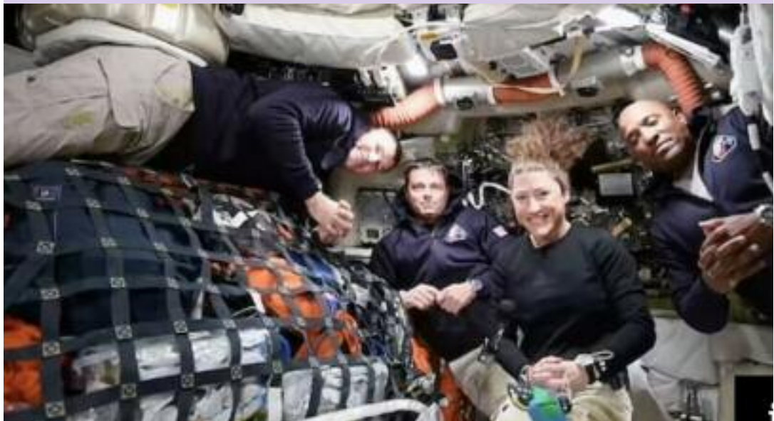
'ਆਰਟੇਮਿਸ-2' ਮਿਸ਼ਨ ਦੌਰਾਨ ਪੁਲਾੜ ਵਿੱਚ ਮੌਜੂਦ ਪੁਲਾੜ ਯਾਤਰੀਆਂ ਦੀ ਸਾਂਝੀ ਤਸਵੀਰ