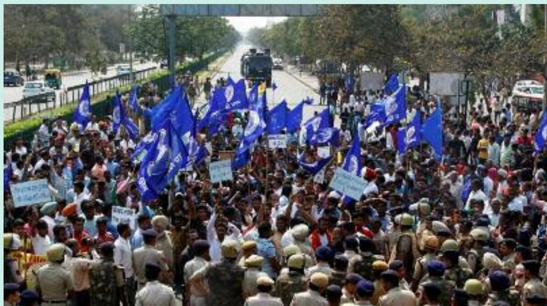
Dalits in India hold protests against 'dilution' of SC/ST Act | News | Al Jazeera

On 20 March 2018, the Supreme Court of India delivered its judgment in Subhash Kashinath Mahajan v. State of Maharashtra . The Court introduced procedural