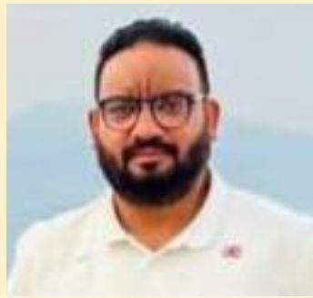
4 ਸਾਲਾਂ ਵਿੱਚ 9ਵੀਂ ਅਜਿਹੀ ਘਟਨਾ ਹੈ, ਜੋ ਸਮਾਜਿਕ

ਹੋਈ ਇਸ ਬੇਅਦਬੀ ਤੇ ਡੂੰਘੀ ਚਿੰਤਾ ਪ੍ਰਗਟ ਕੀਤੀ। ਉਨ੍ਹਾਂ ਕਿਹਾ ਕਿ 31 ਮਾਰਚ, 2026 ਨੂੰ ਹੁਸ਼ਿਆਰਪੁਰ ਜ਼ਿਲ੍ਹੇ ਦੇ ਨੂਰਪੁਰ ਜੱਟਾਂ ਪਿੰਡ ਵਿੱਚ ਬਾਬਾ ਸਾਹਿਬ ਦੇ ਬੁੱਤ ਦੀ ਸ਼ਰਾਰਤੀ ਅਨਸਰਾਂ ਵਲੋਂ ਤੋੜ-ਭੰਨ ਕੀਤੀ ਗਈ ਸੀ, ਜੋ ਕਿ ਬਹੁਤ ਹੀ ਮੰਦਭਾਗੀ ਗੱਲ ਹੈ। ਇਹ ਸਿਰਫ ਇੱਕ ਇਕੱਲੀ ਘਟਨਾ ਨਹੀਂ ਹੈ, ਸਗੋਂ ਪਿਛਲੇ