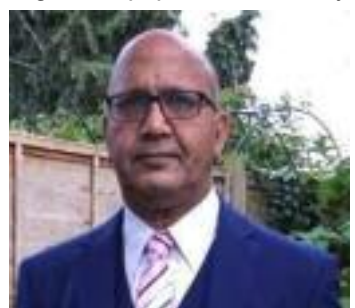
Bal Ram Sampla Geopolitics

ture is growing fast — the number of universities has jumped from 760 in 2015 to over 1,300 today — but the quality is deeply uneven. Many institutions lack proper laboratories, libraries, and digital equipment. Faculty