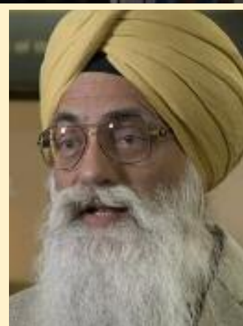
ਸਮਾਗਮ ਦੀਆਂ ਵੱਖ ਵੱਖ ਤਸਵੀਰਾਂ।

ਵੈਨਕੂਵਰ, 4 ਅਪ੍ਰੈਲ (ਮਲਕੀਤ ਸਿੰਘ) ਸਿੱਖ ਕੌਮ ਦੀ ਇਤਿਹਾਸਿਕ ਘਾਲਣਾ ਸੇਵਾ ਭਾਵਨਾ ਅਤੇ ਯੋਗਦਾਨ ਨੂੰ ਦਰਸਾਉਂਦੇ