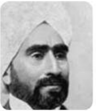
The legend of Ruchi ...