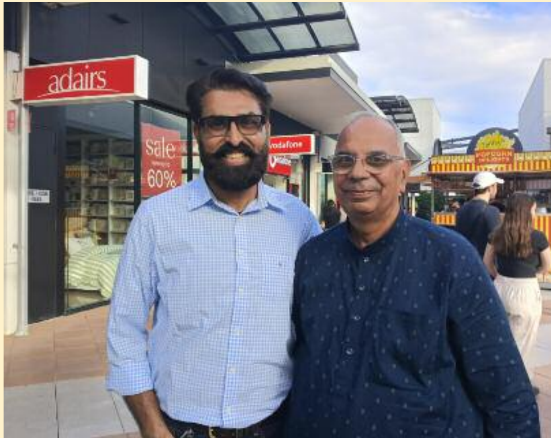
ਪਜਾਮੇ) ਵਾਲੇ ਮੇਰੇ ਵਰਗੇ ਇੱਕ ਸੈਲੀਬ੍ਰਿਟੀ ਬਣ ਜਾਂਦੇ ਹੋ ਲਈ ਅਗੇ ਵੱਧਦੇ ਹਨ। ਇਹ ਮਮੂਲੀ ਸਖਸ਼ ਕੋਈ ਦੂਰੋਂ ਤੇ ਤੁਹਾਡੇ ਫੈਨ ਤੁਹਾਡੀ ਕਲਮ ਦੀ ਬਦੌਲਤ ਹੀ ਪਹਿਚਾਣ ਲੈਂਦਾ ਹੈ। ਤੁਸੀਂ ਤੁਹਾਡੇ ਨਾਲ ਗੱਲਬਾਤ ਕਰਨ ਹੁੰਦਾ ਹੈ। ਸ਼ਨੀਵਾਰ ਹੋਣ

ਨਹੀਂ ਹੁੰਦਾ। ਕੁਦਰਤੀ ਅਸੀਂ ਵੀ ਅੱਜ ਆਪਣੀ ਰਿਹਾਇਸ਼ ਤੋਂ ਕੋਈ 19 ਕਿਲੋਮੀਟਰ ਹਾਰਬੋਰ ਟਾਊਨ ਗਏ ਸੀ। ਇਥੇ ਕੋਈ ਇੱਕ ਸੌ ਵੀਹ ਦੇ ਕਰੀਬ ਦੁਨੀਆਂ ਦੀਆਂ ਬ੍ਰਾਂਡਡ ਕੰਪਨੀਆਂ ਦੇ ਆਊਟਲੈਟਸ ਹਨ। ਹਾਰਬੋਰ ਟਾਊਨ, ਟੈਂਪਲੇਜ਼ ਹਿੱਲਸ, ਐਡਿਲੀਡ ਏਅਰਪੋਰਟ ਰੋਡ, ਐਡਿਲੀਡ ਦੀ ਇੱਕ ਮਸ਼ਹੂਰ ਜਗ੍ਹਾ ਹੈ। ਇੱਥੇ ਹਰ ਮੁਲਕ ਦੇ ਲੋਕ ਸ਼ੌਪਿੰਗ ਲਈ ਆਉਂਦੇ ਹਨ। ਬੱਚਿਆਂ ਲਈ ਕਈ ਖੇਡਾਂ ਹਨ ਤੇ ਫੂਡ ਹੱਬ ਵੀ ਹੈ। ਸੱਚੀ ਆਪਣੇ ਆਪ ਤੇ ਮਾਣ ਜਿਹਾ ਮਹਿਸੂਸ ਹੁੰਦਾ ਹੈ ਜਦੋਂ ਆਪਣੇ ਮੁਲਕ ਤੋਂ ਹਜ਼ਾਰਾਂ ਕਿਲੋਮੀਟਰ ਦੂਰ, ਸੱਤ ਸਮੁੰਦਰੋਂ ਪਾਰ, ਇਹੋ ਜਿਹੀ ਅਣਜਾਣ ਜਗ੍ਹਾ ਤੇ ਇੱਕ ਸਧਾਰਨ ਜਿਹੇ ਚੌਲੇ (ਕੁੜਤੇ