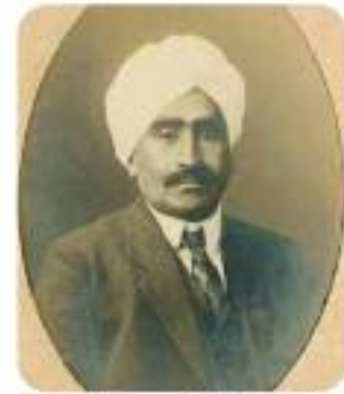
Ruchi Ram Sahni - Wikipedia