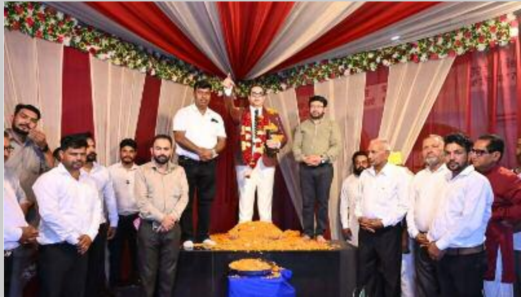
ਭਾਈਚਾਰੇ ਦੇ ਮੁੱਲਾਂ ਨੂੰ ਅਪਣਾਉਣਾ ਚਾਹੀਦਾ ਹੈ। ਡਾ. ਰਵਜੋਤ ਸਿੰਘ ਨੇ ਹਾਜ਼ਰ ਸਾਹਿਬ ਦੇ ਆਦਰਸ਼ਾਂ 'ਤੇ ਲੋਕਾਂ ਨਾਲ ਮਿਲ ਕੇ ਬਾਬਾ ਚੱਲਣ ਅਤੇ ਸਮਾਜ ਵਿੱਚ

ਡਾ. ਭੀਮ ਰਾਓ ਅੰਬੇਡਕਰ ਨੇ ਦੇਸ਼ ਨੂੰ ਸੰਵਿਧਾਨ ਦੇ ਕੇ ਸਮਾਜ ਦੇ ਹਰ ਵਰਗ ਨੂੰ ਸਮਾਨ ਅਧਿਕਾਰ ਦਿਵਾਉਣ ਦਾ ਇਤਿਹਾਸਕ ਕੰਮ ਕੀਤਾ। ਉਨ੍ਹਾਂ ਕਿਹਾ ਕਿ ਬਾਬਾ ਸਾਹਿਬ ਦਾ ਜੀਵਨ ਸੰਘਰਸ਼, ਸਿੱਖਿਆ ਅਤੇ ਸਮਾਨਤਾ ਦਾ ਪ੍ਰਤੀਕ ਹੈ, ਜੋ ਅੱਜ ਵੀ ਸਮਾਜ ਨੂੰ ਪ੍ਰੇਰਿਤ ਕਰਦਾ ਹੈ। ਉਨ੍ਹਾਂ ਕਿਹਾ ਕਿ ਬਾਬਾ ਸਾਹਿਬ ਨੇ ਸਿੱਖਿਆ ਨੂੰ ਸਮਾਜਿਕ ਬਦਲਾਅ ਦਾ ਸਭ ਤੋਂ ਵੱਡਾ ਸਾਧਨ ਦੱਸਿਆ ਅਤੇ ਸਾਨੂੰ ਉਨ੍ਹਾਂ ਦੇ ਦੱਸੇ ਰਸਤੇ 'ਤੇ ਚੱਲਦਿਆਂ ਸਿੱਖਿਆ, ਸਮਾਨਤਾ ਅਤੇ