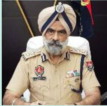
ਹੈ। ਦੱਸਿਆ ਜਾ ਰਿਹਾ ਹੈ ਕਿ ਛਾਪੇਮਾਰੀ ਦੌਰਾਨ ਕਈ ਅਹਿਮ

ਬੇਨਾਮੀ ਜਾਇਦਾਦ ਰੱਖਣ ਵਾਲੇ ਵਿਅਕਤੀਆਂ ਦੇ ਟਿਕਾਣੇ ਵੀ ਸ਼ਾਮਲ ਹਨ। ਪ੍ਰਾਪਤ ਜਾਣਕਾਰੀ ਅਨੁਸਾਰ ਈ ਡੀ ਦੀਆਂ ਟੀਮਾਂ ਨੇ ਅੱਜ ਸਵੇਰੇ ਇੱਕੋ ਵੇਲੇ ਚੰਡੀਗੜ੍ਹ, ਲੁਧਿਆਣਾ, ਪਟਿਆਲਾ, ਨਾਭਾ ਅਤੇ ਜਲੰਧਰ ਵਿੱਚ ਛਾਪੇਮਾਰੀ ਕੀਤੀ। ਜਾਂਚ ਦਾ ਮੁੱਖ ਕੇਂਦਰ ਸਾਬਕਾ ਪੁਲੀਸ ਅਧਿਕਾਰੀ ਵੱਲੋਂ ਕਥਿਤ ਤੌਰ ਤੇ ਇਕੱਠੀ ਕੀਤੀ ਗਈ ਆਮਦਨ ਦੇ ਸਰੋਤਾਂ ਤੋਂ ਵੱਧ ਜਾਇਦਾਦ ਅਤੇ ਰਿਸ਼ਵਤਖੋਰੀ ਰਾਹੀਂ ਕਮਾਏ ਗਏ ਪੈਸੇ ਦੀ ਤਲਾਸ਼ ਕਰਨਾ