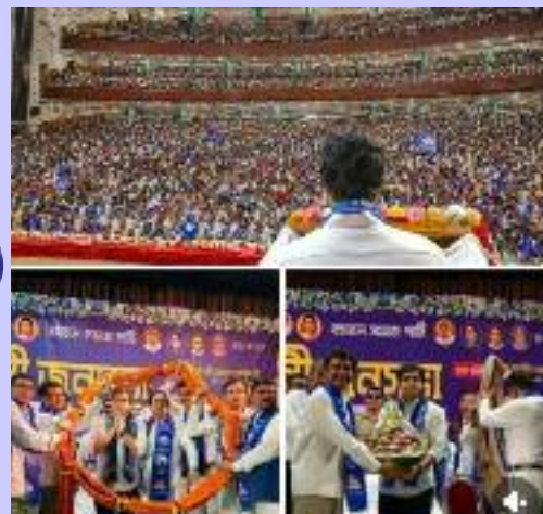
ਜ਼ਮੀਨੀ ਪੱਧਰ 'ਤੇ ਮਜ਼ਬੂਤ ਹੋ ਰਹੀ ਹੈ।