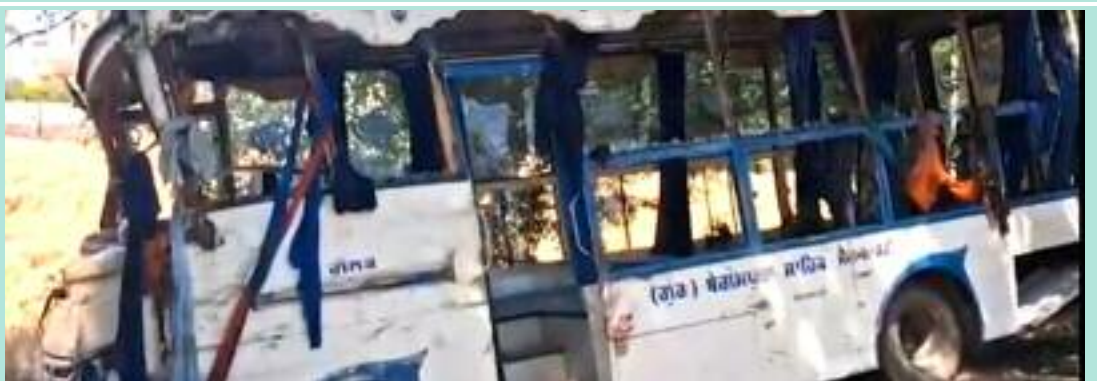
ਸਥਾਨਕ ਲੋਕਾਂ ਨੇ ਤੁਰੰਤ ਬਚਾਅ ਫੋਰਸ ਅਤੇ ਐਂਬੂਲੈਂਸ ਦੇ ਪਹੁੰਚਣ ਕਾਰਜ ਸ਼ੁਰੂ ਕੀਤਾ। ਲੋਕਾਂ ਦਾ ਕਹਿਣਾ ਹੈ ਕਿ ਸੜਕ ਸੁਰੱਖਿਆ ਰਾਹਤ ਕਾਰਜਾਂ ਵਿੱਚ ਰੁਕਾਵਟ

ਅਨੁਸਾਰ ਨਜ਼ਦੀਕੀ ਪਿੰਡ ਭਟੇੜੀ ਨੇੜੇ ਇਹ ਹਾਦਸਾ ਉਸ ਵੇਲੇ ਵਾਪਰਿਆ ਜਦੋਂ ਵਿਸਾਖੀ ਦੇ ਪਵਿੱਤਰ ਦਿਹਾੜੇ ਮੌਕੇ ਸ਼੍ਰੀ ਆਨੰਦਪੁਰ ਸਾਹਿਬ ਤੋਂ ਨਤਮਸਤਕ ਹੋ ਕੇ ਵਾਪਸ ਆ ਰਹੀ ਸੰਗਤ ਦੀ ਭਰੀ ਬੱਸ ਤਕਨੀਕੀ ਖਰਾਬੀ ਕਾਰਨ ਬੇਕਾਬੂ ਹੋ ਗਈ ਅਤੇ ਦਰੱਖਤ ਨਾਲ ਜਾ ਟਕਰਾਈ। ਹਾਦਸੇ ਤੋਂ ਬਾਅਦ