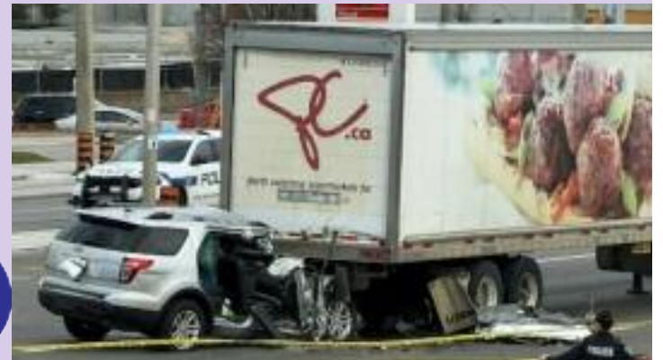
ਬਰੈਂਪਟਨ ਵਿੱਚ ਵਾਪਰੇ ਸੜਕ ਹਾਦਸੇ ਦੌਰਾਨ ਨੁਕਸਾਨੇ ਵਾਹਨ।

ਵੈਨਕੂਵਰ, (ਮਲਕੀਤ ਸਿੰਘ) - ਕੈਨੇਡਾ ਦੇ ਬਰੈਂਪਟਨ ਸ਼ਹਿਰ ਵਿੱਚ ਵਾਪਰੇ ਇਕ ਭਿਆਨਕ ਸੜਕ ਹਾਦਸੇ ਦੌਰਾਨ ਇਕ ਵਿਅਕਤੀ ਦੀ ਮੌਤ ਹੋ ਗਈ, ਜਦਕਿ ਇੱਕ ਔਰਤ ਗੰਭੀਰ ਰੂਪ ਵਿੱਚ ਜਖਮੀ ਹੋ ਗਈ ਹੈ। ਇਹ ਹਾਦਸਾ ਉਸ ਵੇਲੇ ਵਾਪਰਿਆ ਜਦੋਂ ਇੱਕ ਨਿੱਜੀ ਕਾਰ ਅੱਗੇ ਜਾ ਰਹੇ ਇੱਕ ਟਰੱਕ ਨਾਲ ਪਿੱਛੋਂ ਜਾ ਟਕਰਾਈ ਜਿਸ ਕਾਰਨ ਕਾਰ ਚਾਲਕ ਦੀ ਮੌਕੇ ਤੇ ਮੌਤ ਹੋ ਗਈ ਜਦੋਂ ਕਿ ਇੱਕ ਔਰਤ ਗੰਭੀਰ ਰੂਪ ਵਿੱਚ ਜਖਮੀ ਹੋ ਗਈ ਜਿਸ ਨੂੰ ਉਪਰੰਤ