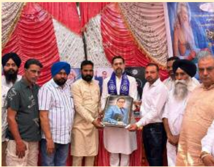
ਅੰਮ੍ਰਿਤਸਰ ਦੇ ਜੱਲਿਆਂਵਾਲਾ ਬਾਗ ਕੀਤਾ ਗਿਆ, ਜਿੱਥੇ ਜਨਰਲ ਵਿੱਚ ਹੋਏ ਕਤਲੇਆਮ ਨੂੰ ਵੀ ਯਾਦ ਡਾਇਰ ਵੱਲੋਂ ਨਿਹੱਥੇ ਲੋਕਾਂ 'ਤੇ