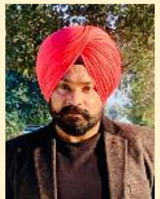
ਸਮਾਜ ਵੀਕਲੀ ਨਿਊਜ਼

ਇੱਕ ਭਾਲਦੇ ਹਿੰਦੂ ਰਾਸ਼ਟ', ਇੱਕ ਮੰਗਦੇ ਖ਼ਾਲਸਾ ਰਾਜ। ਪਰ ਉਹ ਕਿੱਥੇ ਜਾਣ, ਜਿਨ੍ਹਾਂ ਨੂੰ ਕੱਟੜਤਾ 'ਤੇ ਇਤਰਾਜ਼। ਏਕ ਪਿਤਾ ਏਕਸ ਕੇ ਹਮ ਬਾਰਿਕ, ਚੰਗਾ ਲੱਗੇ ਲਿਖਿਆ। ਹਕੀਕਤ ਦੇ ਵਿੱਚ ਤਾਂ ਚਲਦਾ ਐਥੇ, ਏਕ ਪੰਥ ਕਈ ਕਾਜ। ਧਰਮ ਅਤੇ ਜਾਤ 'ਮੁਜ਼ਰਮਾਂ' ਦੀ, ਵੇਖ ਕੇ ਲਗਦਾ ਡੰਨ। ਤਕੜੇ ਮੂਹਰੇ ਚੁੰ ਨਾ ਕਰਦੇ, ਮਾੜੇ 'ਤੇ ਡਿਗਦੀ ਗਾਜ। ਲੋਕ ਤੰਤਰ ਦਾ ਜਨਾਜ਼ਾ, ਕੱਢਿਆ ਬਾਹੂਬਲੀਆਂ ਨੇ। ਪੜ੍ਹੇ-ਲਿਖੇ ਹੱਥ ਬੰਨ੍ਹ ਕੇ, ਅਨਪੜ੍ਹਾਂ ਦੇ ਸਿਰ ਧਰਦੇ ਤਾਜ। ਕੁਝ ਤੋੜ-ਮਰੋੜ ਕੇ, ਕੁਝ ਮਿਥਿਹਾਸ ਨੂੰ ਇਤਿਹਾਸ ਬਣਾ ਕੇ। ਆਪੇ ਬਣ ਗਏ ਸੰਤ ਕਈ ਐਥੇ, ਆਪੇ ਬਣੇ ਮਹਾਰਾਜ। ਰਾਤੀਂ ਸੌਣ ਨਾ ਦੇਣ 'ਜਗਰਾਤੇ', ਤੜਕੇ 'ਲੋਹਾ' ਖੜਕੇ। ਫਿਜ਼ਾ ਨੂੰ ਸ਼ਾਂਤ ਰਹਿਣ ਨਾ ਦਿੰਦੇ, ਵੰਨ-ਸੁਵੰਨੇ 'ਸਾਜ਼'। ਸੌ ਕਰੋੜ ਦੇਵਾਂ ਵਾਲੇ ਹੋ ਕੇ, ਮਰਦੇ ਭੁੱਖ-ਮਰੀ ਨਾਲ। ਆਸਥਾ ਵਾਲੇ ਮੁਲਕ 'ਚ ਲੋਕ, ਦਾਣੇ ਦਾਣੇ ਨੂੰ ਮਹੁਥਾਜ। ਤਰੱਕੀ ਦੀ ਪੌੜੀ ਚੜ੍ਹ ਗਏ, ਜੋ 'ਪੱਥਰਾਂ' ਤੋਂ ਕੋਹਾਂ ਦੂਰ। ਇਸ ਗੱਲ ਦਾ ਲੋਕਾਂ ਦੀ, ਕਦੋਂ ਸਮਝ 'ਚ ਆਉਣਾ ਰਾਜ਼।