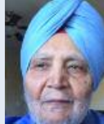
ਸਮਾਜ ਵੀਕਲੀ ਨਿਊਜ਼

ਇਹ ਸਮਾਂ ਵੀ ਕੀ ..... ਅਜੀਬ ਚੀਜ਼ ਹੈ ਲੰਮਾ ਇੰਨਾ ਕਿ ..... ਅਨੰਤ ਕਾਲ ਤੋਂ ਕਿਆਮਤ ਤੱਕ ਫੈਲਿਆ ਹੋਇਆ ਛੋਟਾ ਇੰਨਾ ਕਿ ..... ਕੰਮ ਪੂਰਾ ਹੋਣ ਤੋਂ ਪਹਿਲਾਂ ਹੀ ਸਮਾਪਤ ਖੁਸ਼ੀ 'ਚ ਇੰਨਾ ਤੇਜ਼ ਕਿ ਪਤਾ ਹੀ ਨਾ ਲੱਗੇ ਕਿ ..... ਕਦੋਂ ਬੀਤ ਜਾਏ ਦੁੱਖ 'ਤੇ ਉਡੀਕ ਵਿੱਚ ਇੰਨਾ ਹੌਲੀ ਕਿ ..... ਕੱਟਿਆ ਨਾ ਕੱਟੇ ਜ਼ਾਲਮ ਏਨਾ ਕਿ ..... ਖਰਾਬ ਨੂੰ ਜ਼ਖਮ ਵਿੱਚ ਬਦਲ ਦੇਵੇ ਹਮਦਰਦ ਏਨਾ ਕਿ ..... ਡੂੰਘੇ ਜ਼ਖਮ ਨੂੰ ਛਿਣ 'ਚ ਭਰ ਦੇਵੇ ਜੋ ਇਹਦੀ ਦੇਖਭਾਲ ਕਰੇ, ..... ਉਹਨੂੰ ਅਮਰ ਬਣਾ ਦੇਵੇ ਜੋ ਠੁਕਰਾਏ, ..... ਗੁਮਨਾਮੀ ਦੀ ਡੂੰਘੀ ਗੁਫਾ ਵਿੱਚ ਧੱਕ ਦੇਵੇ ਇਹ ਸਮਾਂ ਵੀ ਕੀ ..... ਅਜੀਬ ਚੀਜ਼ ਹੈ!