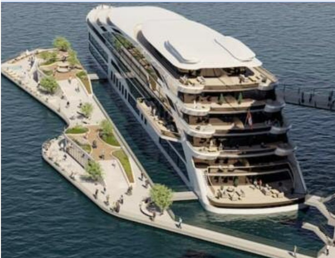
ਕੋਲ ਹਾਰਬਰ ਵਿੱਚ ਬਣਨ ਵਾਲੇ 250 ਕਮਰਿਆਂ ਵਾਲੇ ਤੈਰਦੇ ਹੋਟਲ ਦਾ ਪ੍ਰਸਤਾਵਿਤ ਡਿਜ਼ਾਇਨ।