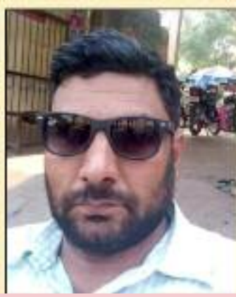
ਦੀ ਡਿਊਟੀ ਚੋਣ ਪ੍ਰਕ੍ਰਿਆ ਅਤੇ ਮਰਦਸ਼ੁਮਾਰੀ 'ਚ ਲਗਾਉਣਾ ਵੀ ਹੈ। ਟੀਚਰਾਂ ਦੀ ਡਿਊਟੀ ਗੈਰ ਵਿੱਦਿਅਕ

ਦਾਅਵਿਆਂ ਤੇ ਸਵਾਲੀਆ ਚਿੰਨ ਲੱਗ ਰਿਹਾ ਹੈ। ਇਸਦਾ ਮੁੱਖ ਕਾਰਨ ਇਕ ਤਾ ਸਕੂਲਾਂ 'ਚ ਟੀਚਰਾਂ ਦੀ ਮਨਫੀ ਦਾ ਪੂਰਾ ਨਾ ਹੋਣਾ ਹੈ। ਜਿਸ ਨਾਲ ਮਾਪਿਆਂ ਦਾ ਸਰਕਾਰੀ ਸਕੂਲਾਂ ਤੋਂ ਵਿਸ਼ਵਾਸ ਉੱਠਦਾ ਜਾ ਰਿਹਾ ਹੈ ਅਤੇ ਉਹ ਆਪਣਿਆਂ ਬੱਚਿਆਂ ਨੂੰ ਸਰਕਾਰੀ ਸਕੂਲਾਂ 'ਚ ਦਾਖਲ ਕਰਵਾਉਣ ਤੋਂ ਕਿਨਾਰਾ ਕਰ ਰਹੇ ਹਨ। ਇਸ ਦਾ ਦੂਜਾ ਕਾਰਨ ਇਹ ਵੀ ਹੈ, ਕਿ ਸਰਕਾਰ ਦੁਆਰਾ ਟੀਚਰਾਂ