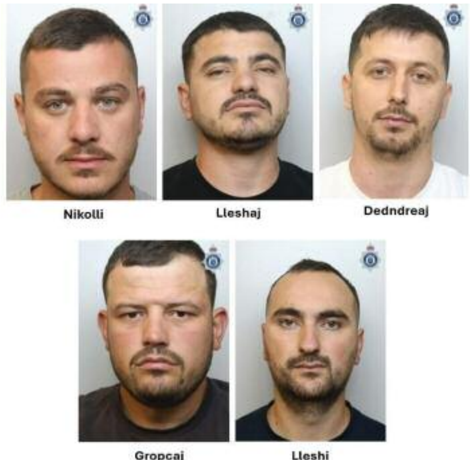
ਗਿਰੋਹ ਦੇ ਫੜੇ ਗਏ ਮੈਂਬਰ!

ਲੈਸਟਰ (ਇੰਗਲੈਂਡ), 15 ਅਪ੍ਰੈਲ (ਸੁਖਜਿੰਦਰ ਸਿੰਘ ਢੱਡੇ)- ਬ੍ਰਿਟੇਨ ਵਿਚ ਘਰਾਂ ਦੇ ਨਕਸ਼ੇ ਆਨਲਾਈਨ ਦੇਖ ਕੇ ਚੋਰੀਆਂ ਕਰਨ ਵਾਲੇ ਇਕ ਅਲਬੇਨੀਆਈ ਗਿਰੋਹ ਨੂੰ ਅਦਾਲਤ ਵੱਲੋਂ ਕੜੀਆਂ ਸਜ਼ਾਵਾਂ ਸੁਣਾਈਆਂ ਗਈਆਂ ਹਨ। ਇਸ ਗਿਰੋਹ ਨੇ ਦੇਸ਼ ਭਰ ਵਿਚ 10 ਮਹੀਨਿਆਂ ਦੌਰਾਨ ਦਰਜਨਾਂ ਘਰਾਂ ਨੂੰ ਨਿਸ਼ਾਨਾ ਬਣਾਇਆ ਅਤੇ ਲੱਖਾਂ ਪੌਂਡ ਦੀ ਕੀਮਤ ਦੇ ਗਹਿਣੇ, ਘੜੀਆਂ ਅਤੇ ਮਹਿੰਗੇ ਬੈਗ ਲੁਟੇ। ਅਦਾਲਤ ਵਿਚ ਸੁਣਵਾਈ ਦੌਰਾਨ ਸਾਹਮਣੇ ਆਇਆ ਕਿ ਇਹ ਗਿਰੋਹ ਇੰਟਰਨੈੱਟ ਅਤੇ ਪ੍ਰਾਪਰਟੀ ਵੈੱਬਸਾਈਟਾਂ 'ਤੇ ਘਰਾਂ ਦੇ ਨਕਸ਼ੇ ਅਤੇ ਬਣਤਰ ਦੇਖ ਕੇ ਪਹਿਲਾਂ ਹੀ ਯੋਜਨਾ ਬਣਾਉਂਦਾ ਸੀ। ਇਸ ਤੋਂ ਬਾਅਦ ਇਹ ਰਾਤ ਦੇ ਸਮੇਂ ਸੀੜੀਆਂ ਦੀ ਮਦਦ ਨਾਲ ਘਰਾਂ ਵਿਚ ਦਾਖ਼ਲ ਹੋ ਕੇ ਚੋਰੀਆਂ ਕਰਦਾ ਸੀ। ਗਿਰੋਹ ਨੇ ਕੁੱਲ 44 ਘਰਾਂ 'ਚ ਵੱਡੀਆਂ ਵਾਰਦਾਤਾਂ ਕੀਤੀਆਂ। ਇਕ ਮਾਮਲੇ ਵਿਚ 2 ਲੱਖ ਪੌਂਡ ਤੋਂ ਵੱਧ ਦਾ ਸਮਾਨ ਚੋਰੀ ਕੀਤਾ ਗਿਆ, ਜਦਕਿ ਇਕ ਹੋਰ ਘਟਨਾ ਵਿਚ 30 ਤੋਂ ਵੱਧ ਮਹਿੰਗੀਆਂ ਘੜੀਆਂ ਲੈ ਜਾਈਆਂ ਗਈਆਂ। ਕਈ ਵਾਰ ਘਰਾਂ ਦੇ ਮਾਲਕ ਅੰਦਰ ਹੀ ਮੌਜੂਦ ਸਨ ਅਤੇ ਡਰ ਦੇ ਮਾਰੇ ਲੁਕਣ ਲਈ ਮਜਬੂਰ ਹੋਏ। ਅਦਾਲਤ ਨੇ ਦੱਸਿਆ ਕਿ ਚੋਰ ਕਮਰਿਆਂ ਨੂੰ ਉਲਟ-ਪੁਲਟ ਕਰਦੇ, ਬਿਸਤਰਾਂ ਦੀਆਂ ਚਾਦਰਾਂ ਵਿਚ ਸਮਾਨ ਬੰਨ੍ਹ ਕੇ ਲੈ ਜਾਂਦੇ ਅਤੇ ਕਈ ਵਾਰ ਤਿਜ਼ੇਰੀਆਂ ਤੱਕ ਚੁੱਕ ਕੇ ਲੈ ਗਏ। ਇਸ ਕਾਰਨ ਪੀੜਤ ਪਰਿਵਾਰਾਂ ਵਿਚ ਡਰ ਅਤੇ ਅਸੁਰੱਖਿਆ ਦਾ ਮਾਹੌਲ ਬਣ ਗਿਆ।