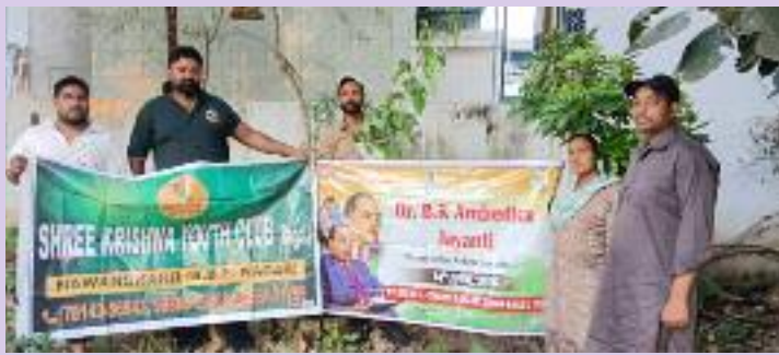
ਸੁੰਦਰ ਅਤੇ ਹਰਾ-ਭਰਾ ਬਣਾਉਣ ਦਾ ਸੰਦੇਸ਼ ਦਿੱਤਾ। ਇਸ ਮੌਕੇ ਹਾਜ਼ਰ ਮੈਂਬਰਾਂ ਨੇ ਬਾਬਾ ਸਾਹਿਬ ਦੇ ਮਹਾਨ ਜੀਵਨ, ਉਨ੍ਹਾਂ ਦੇ ਵਿਚਾਰਾਂ

ਤੇ ਵਾਤਾਵਰਨ ਸੰਭਾਲ ਦਾ ਸੰਦੇਸ਼ ਦਿੰਦਿਆਂ ਬੂਟੇ ਲਗਾਏ ਗਏ। ਇਸ ਤੋਂ ਪਹਿਲਾਂ ਕਲੱਬ ਦੇ ਮੈਂਬਰਾਂ ਵੱਲੋਂ ਡਾ. ਅੰਬੇਡਕਰ ਚੌਕ ਵਿੱਚ ਸਥਿਤ ਬਾਬਾ ਸਾਹਿਬ ਦੀ ਮੂਰਤੀ 'ਤੇ ਫੁੱਲ ਮਾਲਾਵਾਂ ਝੋਟ ਕਰਕੇ ਉਨ੍ਹਾਂ ਨੂੰ ਸ਼ਰਧਾਂਜਲੀ ਭੇਟ ਕੀਤੀ ਗਈ। ਇਸ ਤੋਂ ਬਾਅਦ ਮੈਂਬਰਾਂ ਨੇ ਪਿੰਡ ਬੇਗਮਪੁਰ ਵਿੱਚ ਬੂਟੇ ਲਗਾ ਕੇ ਵਾਤਾਵਰਨ ਨੂੰ ਸਾਫ-ਸੁਥਰਾ,