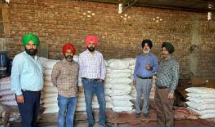
ਇਕਾਈਆਂ ਦੀ ਵੀ ਚੈਕਿੰਗ ਕੀਤੀ ਗਈ। ਟੀਮ ਵੱਲੋਂ ਇਹ ਪਾਇਆ ਗਿਆ ਕਿ ਕਿਸਾਨਾਂ ਖਾਸ ਕਰਕੇ ਵੱਡੇ ਕਿਸਾਨਾਂ ਵੱਲੋਂ ਸਾਉਣੀ ਦੀਆਂ ਫਸਲਾਂ ਲਈ ਲੋੜੀਂਦੀ ਯੂਰੀਆ ਖਾਦ ਦਾ ਹੁਣ ਤੋਂ ਹੀ ਸਟਾਕ ਕੀਤਾ

ਇਕਾਈਆਂ ਦੀ ਅਚਨਚੇਤ ਚੈਕਿੰਗ ਕੀਤੀ ਗਈ। ਇਸ ਮੁਹਿੰਮ ਤਹਿਤ ਜ਼ਿਲ੍ਹਾ ਹੁਸ਼ਿਆਰਪੁਰ ਵਿਚ ਰਾਜ ਪੱਧਰੀ ਟੀਮ ਵੱਲੋਂ ਗੜ੍ਹਸ਼ੰਕਰ , ਮਾਹਿਲ ਪੁਰ , ਚੰਬੇ ਵਾਲ , ਹੁਸ਼ਿਆਰਪੁਰ ਅਤੇ ਮੁਕੇਰੀਆਂ ਵਿਚ ਖਾਦ ਵਿਕ੍ਰੇਤਾਵਾਂ ਦੇ ਗੁਦਾਮਾਂ ਦੀ ਚੈਕਿੰਗ ਕੀਤੀ ਗਈ। ਇਸ ਤੋਂ ਇਲਾਵਾ ਭੁੰਗਾ ਅਤੇ ਹੁਸ਼ਿਆਰਪੁਰ ਵਿਚ ਸਥਿਤ ਪਲਾਈ ਉਦਯੋਗਿਕ