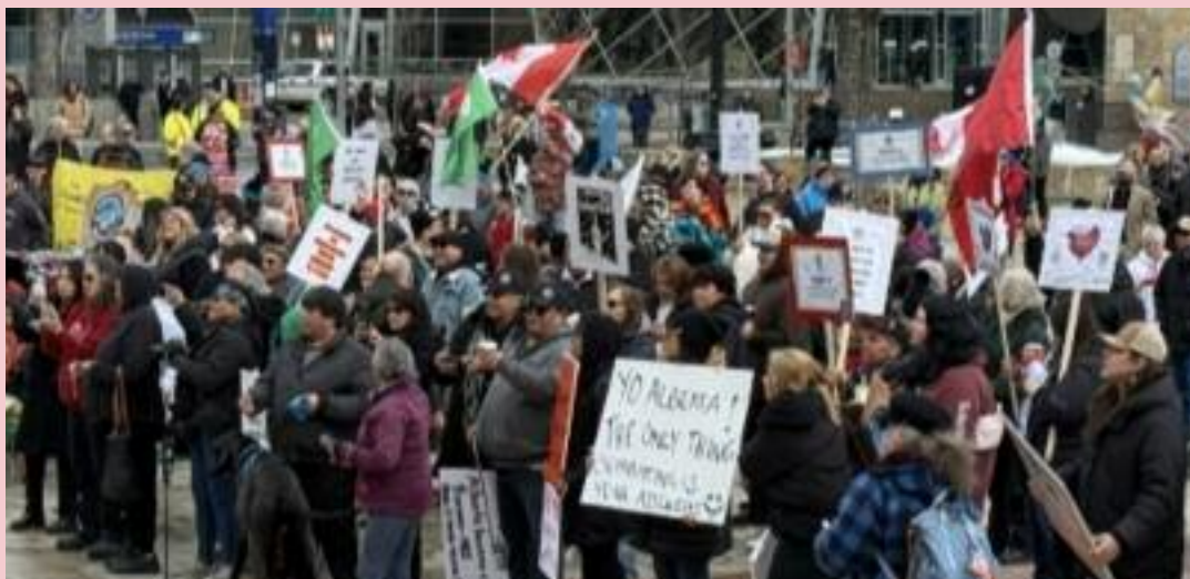
ਰੈਲੀ ਦੌਰਾਨ ਇਕੱਠੇ ਹੋਏ ਲੋਕ।

ਵਿੱਚ ਹੋਈ, ਜਿੱਥੇ ਲਗਭਗ 200 ਫਰਸਟ ਨੇਸ਼ਨਜ਼ ਆਗੂ, ਕਮਿਊਨਿਟੀ ਮੈਂਬਰ ਅਤੇ ਸਮਰਥਕ ਇਕੱਠੇ ਹੋਏ। ਇਸ ਮੌਕੇ ਬੈਨਰਾਂ ਅਤੇ ਝੰਡਿਆਂ ਰਾਹੀਂ ਲੋਕਾਂ ਨੇ ਆਪਣਾ ਸਖ਼ਤ ਵਿਰੋਧ ਜਤਾਇਆ ਅਤੇ ਫਰਸਟ ਨੇਸ਼ਨਜ਼ ਦੇ ਅਧਿਕਾਰਾਂ ਦੀ ਰੱਖਿਆ ਦੀ ਮੰਗ ਕੀਤੀ। ਰੈਲੀ ਵਿੱਚ ਸ਼ਾਮਲ ਲੋਕਾਂ ਦਾ ਕਹਿਣਾ ਸੀ ਕਿ ਇਹ