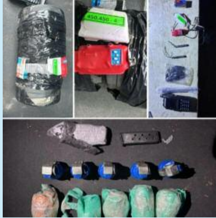
5 ਹੈਂਡ ਗ੍ਰੇਨੇਡ, 2 ਡੈਟੋਨੇਟਰ, ਨਾਲ ਜੁੜਿਆ ਪੀਟੀਟੀ ਕੇਡਰ-ਡੀਕੇਡਰ ਸਿਸਟਮ ਟਾਈਮਰ, 9 ਵੋਲਟ ਬੈਟਰੀ,