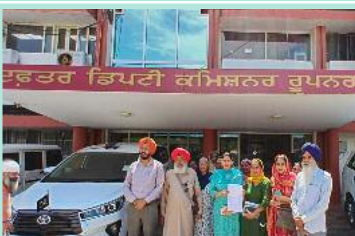
ਜਲਦੀ ਇਹ ਬਕਾਇਆ ਰਕਮ ਜਾਰੀ ਕੀਤੀ ਜਾਵੇ ਤਾਂ ਜੋ

ਮਾਜਰਾ ਸਮੇਤ ਹੋਰ ਸਾਥੀ ਮੌਜੂਦ ਸਨ। ਆਗੂਆਂ ਨੇ ਕਿਹਾ ਕਿ ਮਨਰੇਗਾ ਸਕੀਮ ਹੇਠ ਕੰਮ ਕਰ ਰਹੇ ਮੇਟਾ ਦੀ ਬਕਾਇਆ ਰਾਸ਼ੀ ਲੰਬੇ ਸਮੇਂ ਤੋਂ ਰੁਕੀ ਹੋਈ ਹੈ, ਜਿਸ ਕਾਰਨ ਉਨ੍ਹਾਂ ਨੂੰ ਗੰਭੀਰ ਆਰਥਿਕ ਮੁਸ਼ਕਲਾਂ ਦਾ ਸਾਹਮਣਾ ਕਰਨਾ ਪੈ ਰਿਹਾ ਹੈ। ਉਨ੍ਹਾਂ ਨੇ ਜ਼ੋਰ ਦੇ ਕੇ ਕਿਹਾ ਕਿ ਸਰਕਾਰ ਵੱਲੋਂ ਜਲਦੀ ਤੋਂ