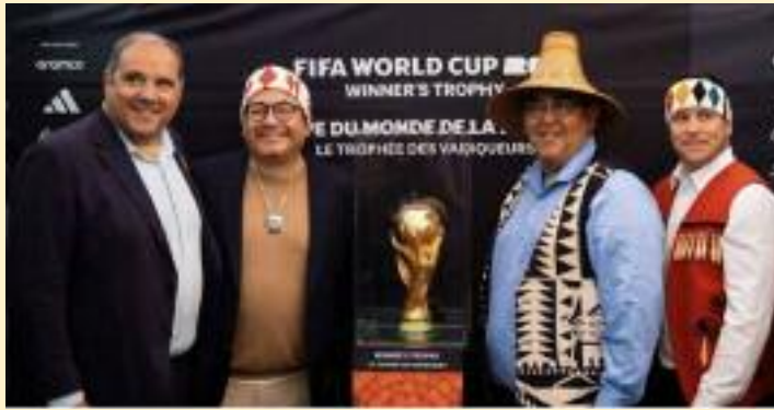
ਕੈਨੇਡਾ ਵਿੱਚ ਜਸ਼ਨੀ ਟੂਰ ਦੇ ਐਲਾਨ ਮੌਕੇ ਵਰਲਡ ਕੱਪ ਟਰਾਫੀ ਨਾਲ ਖੜ੍ਹੇ ਮਹਿਮਾਨ।

ਵਿੱਚ ਲਿਆਂਦਾ ਜਾਵੇਗਾ। ਇਸ ਟੂਰ ਦਾ ਮਕਸਦ ਫੁਟਬਾਲ ਪ੍ਰੇਮੀਆਂ ਵਿੱਚ ਜੋਸ਼ ਪੈਦਾ ਕਰਨਾ ਅਤੇ ਲੋਕਾਂ ਨੂੰ ਵਰਲਡ ਕੱਪ ਨਾਲ ਜੋੜਨਾ ਹੈ। ਟੂਰ ਦੌਰਾਨ ਵੱਖ-ਵੱਖ ਸ਼ਹਿਰਾਂ ਵਿੱਚ ਸੱਭਿਆਚਾਰਕ ਪ੍ਰੋਗਰਾਮ ਅਤੇ ਖੇਡ ਗਤੀਵਿਧੀਆਂ