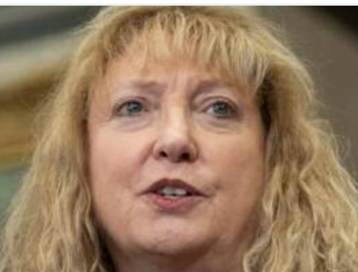
ਸਾਸਦ ਮੈਰਿਲਿਨ ਗਲਾਡੂ ਦੀ ਤਸਵੀਰ।