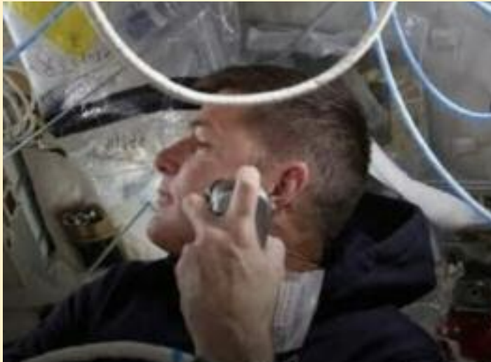
ਪੁਲਾੜ ਯਾਤਰਾ ਦੌਰਾਨ ਜੇਰੇਮੀ ਹੈਨਸਨ ਦੀ ਇੱਕ ਤਸਵੀਰ

ਗਿਆ ਜਦੋਂ ਉਹ ਨਾਸਾ ਦੇ 'ਆਰਟੇਮਿਸ-2' ਮਿਸ਼ਨ ਦੌਰਾਨ ਧਰਤੀ ਤੋਂ ਕਾਫ਼ੀ ਦੂਰ, ਚੰਦਰਮਾ ਦੇ ਨੇੜੇ ਆਪਣੀ ਯਾਤਰਾ ਕਰ ਰਹੇ ਹਨ। ਇਹ ਸੰਦੇਸ਼ ਈਮੇਲ ਰਾਹੀਂ ਭੇਜਿਆ ਗਿਆ, ਜਿਸਨੂੰ 'ਆਉਟ-ਆਫ-ਦਿਸ-ਵਰਲਡ' ਪਲ ਵਜੋਂ ਵੇਖਿਆ ਜਾ ਰਿਹਾ ਹੈ। ਦੱਸਿਆ ਜਾ ਰਿਹਾ ਹੈ ਕਿ