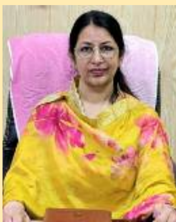
ਗਿਆ ਹੈ। ਜਿਸ ਦਾ ਮਕਸਦ ਲੋਕਾਂ ਨੂੰ ਵਿਗਿਆਨਕ

ਦਿਵਸ ਮਨਾਇਆ ਜਾਂਦਾ ਹੈ। ਜਿਸ ਦਾ ਮੁੱਖ ਉਦੇਸ਼ ਲੋਕਾਂ ਵਿੱਚ ਸਿਹਤ ਪ੍ਰਤੀ ਜਾਗਰੂਕਤਾ ਪੈਦਾ ਕਰਨਾ ਅਤੇ ਸਿਹਤਮੰਦ ਸਮਾਜ ਦੀ ਸਥਾਪਨਾ ਕਰਨਾ ਹੈ। ਉਨ੍ਹਾਂ ਦੱਸਿਆ ਕਿ ਇਸ ਸਾਲ ਵਿਸ਼ਵ ਹੈਲਥ ਦਿਵਸ ਦਾ ਥੀਮ "ਠੋਗਣਟਹਣਰ ਡੋਰ ਏਓਲਟਹ - ਸ਼ਟਓਨਦ ਟਿਹ ਗਈ। ਉਨ੍ਹਾਂ ਦੱਸਿਆ ਕਿ ਹਰ ਸ਼ਚਿਣਨਚਣ" (ਇਕੱਠੇ ਸਾਲ 7 ਅਪ੍ਰੈਲ ਨੂੰ ਵਿਸ਼ਵ ਸਿਹਤ ਲਈ — ਵਿਗਿਆਨ ਪੱਧਰ 'ਤੇ ਵਿਸ਼ਵ ਹੈਲਥ ਨਾਲ ਖੜ੍ਹੇ ਹੋਵੋ)** ਰੱਖਿਆ