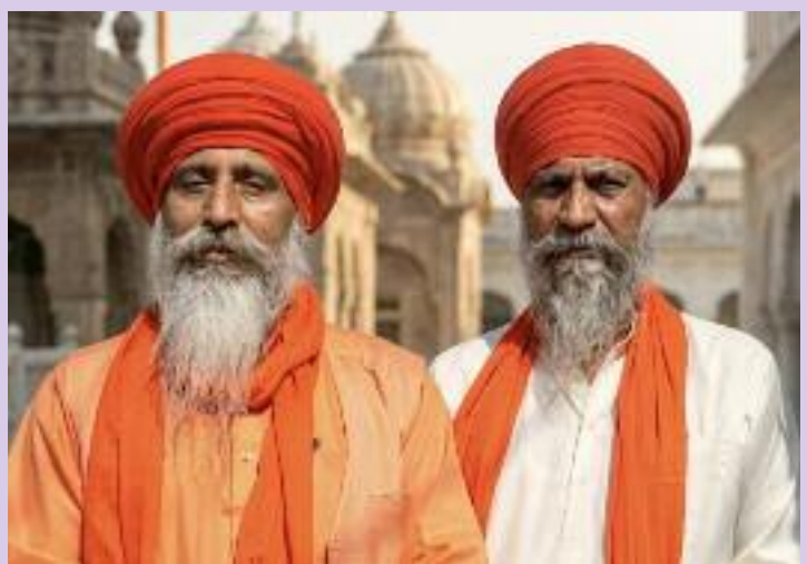
ਪਿੰਡਾਂ ਅਤੇ ਸ਼ਹਿਰਾਂ ਤੋਂ ਆਏ ਤਿਆਰੀਆਂ ਵਿੱਚ ਜੁਟੇ ਹੋਏ ਸੇਵਾਦਾਰ ਦਿਨ-ਰਾਤ ਹਨ। ਮੀਡੀਆ ਨਾਲ ਗੱਲਬਾਤ