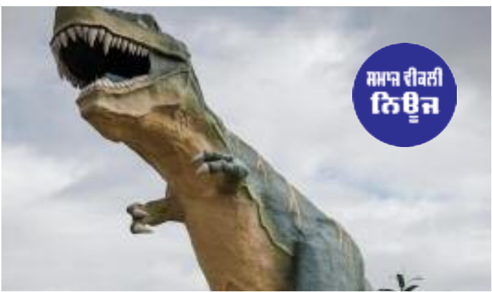
ਡਰਮਹੈਲਰ ਵਿੱਚ ਸਥਿਤ ਵਿਸ਼ਾਲ ਟੀ-ਰੈਕਸ ਮੂਰਤੀ, ਜੋ ਸੈਲਾਨੀਆਂ ਲਈ ਮੁੱਖ ਆਕਰਸ਼ਣ ਹੈ।