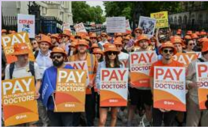
ਹੜਤਾਲ ਦੌਰਾਨ ਸਰਕਾਰ ਵਿਰੁੱਧ ਰੋਸ ਪ੍ਰਗਟ ਕਰਦੇ ਹੋਏ ਡਾਕਟਰ।

ਐਨਐਚਐਸ ਵੱਲੋਂ ਮਰੀਜ਼ਾਂ ਨੂੰ ਅਪੀਲ ਕੀਤੀ ਗਈ ਹੈ ਕਿ ਜੇਕਰ ਕਿਸੇ ਨੂੰ ਤੁਰੰਤ ਜਾਂ ਐਮਰਜੈਂਸੀ ਸਹਾਇਤਾ ਦੀ ਲੋੜ ਹੋਵੇ ਤਾਂ ਉਹ 999 ਜਾਂ 111 ਨੰਬਰਾਂ 'ਤੇ ਸੰਪਰਕ ਕਰਨ ਵਿੱਚ ਕੋਈ ਹਿਚਕਿਚਾਹਟ ਨਾ ਕਰਨ। ਜਿਨ੍ਹਾਂ ਮਰੀਜ਼ਾਂ ਦੀ ਪਹਿਲਾਂ ਤੋਂ