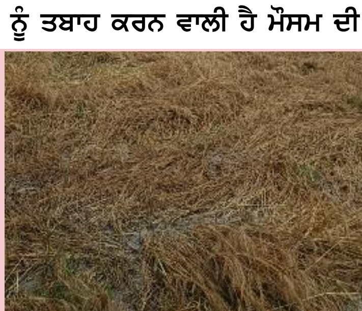
ਭਾਵੇਂ ਕਿ ਪਿਛਲੇ ਦਿਨੀਂ ਮੁੱਖ ਕਿਹਾ ਹੈ ਕਿ ਉਹ ਨੁਕਸਾਨੀਆਂ ਮੰਤਰੀ ਭਗਵੰਤ ਸਿੰਘ ਮਾਨ ਨੇ ਫ਼ਸਲਾਂ ਦਾ ਮੁਆਵਜ਼ਾ ਦੇਣਗੇ,

ਹੈ। ਦਿਹਾੜੀ ਦੱਪਾ ਕਰਨ ਵਾਲੇ ਲੋਕ ਪ੍ਰੇਸ਼ਾਨੀ ਵਿੱਚ ਹਨ। ਕਿਸਾਨ ਦੀ ਪੁੱਤਾਂ ਵਾਂਗ ਪਾਲੀ ਫ਼ਸਲ ਤਬਾਹ ਹੋ ਰਹੀ ਹੈ। ਦੱਸ ਦੇਈਏ ਕਿ ਭਲੂਰ ਦੇ ਆਸ-ਪਾਸ ਅੱਜ ਭਾਰੀ ਮੀਂਹ ਤੇ ਗੜ੍ਹੇਮਾਰੀ ਨੇ ਵੱਡਾ ਨੁਕਸਾਨ ਕੀਤਾ ਹੈ। ਹਾਲੇ ਵੀ ਸਿਰ 'ਤੇ ਕਾਲੇ ਬੱਦਲ ਮੰਡਰਾਉਂਦੇ ਫਿਰ ਰਹੇ ਹਨ। ਮੌਸਮ ਦਾ ਇਸ ਤਰ੍ਹਾਂ ਵਿਗੜ ਜਾਣਾ ਮੁਸੀਬਤ ਬਣ ਗਿਆ ਹੈ। ਇਸ ਦੀ ਭਰਪਾਈ ਕੌਣ ਕਰੇਗਾ ? ਕੀ ਸਰਕਾਰਾਂ ਲੋਕਾਂ ਲਈ ਸੰਜੀਦਾ ਹਨ ?