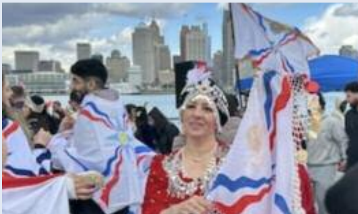
ਵਿੰਡਸਰ ਵਿੱਚ ਦਰਿਆ ਕਿਨਾਰੇ ਨਵੇਂ ਸਾਲ ਦੇ ਸਮਾਗਮ ਦੌਰਾਨ ਅਸੀਰੀਅਨ ਭਾਈਚਾਰੇ ਦੇ ਲੋਕ ਰਵਾਇਤੀ ਪਹਿਰਾਵਿਆਂ ਵਿੱਚ ਖੁਸ਼ੀ ਮਨਾਉਂਦੇ ਹੋਏ।

ਨੂੰ ਇੱਕ ਵਾਰ ਫਿਰ ਤਾਜ਼ਾ ਕਰ ਦਿੱਤਾ। ਵੇਰਵਿਆਂ ਮੁਤਾਬਕ 'ਖਾਬ ਨਿਸਾਨ' ਨਾਂ ਨਾਲ ਜਾਣੇ ਜਾਂਦੇ ਇਸ ਤਿਉਹਾਰ ਦੌਰਾਨ ਸੈਂਕੜਿਆਂ ਦੀ ਗਿਣਤੀ ਵਿੱਚ ਉਕਤ ਭਾਈਚਾਰੇ ਨਾਲ ਸੰਬੰਧਿਤ ਲੋਕ ਪਰਿਵਾਰਾਂ ਸਮੇਤ ਸ਼ਾਮਲ ਹੋਏ। ਲੋਕਾਂ ਨੇ ਰਵਾਇਤੀ ਪਹਿਰਾਵੇ ਪਾ ਕੇ ਨਾਚ-ਗਾਣੇ ਕੀਤੇ ਅਤੇ ਆਪਣੇ ਪੁਰਖਿਆਂ ਦੀ ਸੰਸਕ੍ਰਿਤੀ ਨੂੰ ਜ਼ਿੰਦਾ ਰੱਖਣ