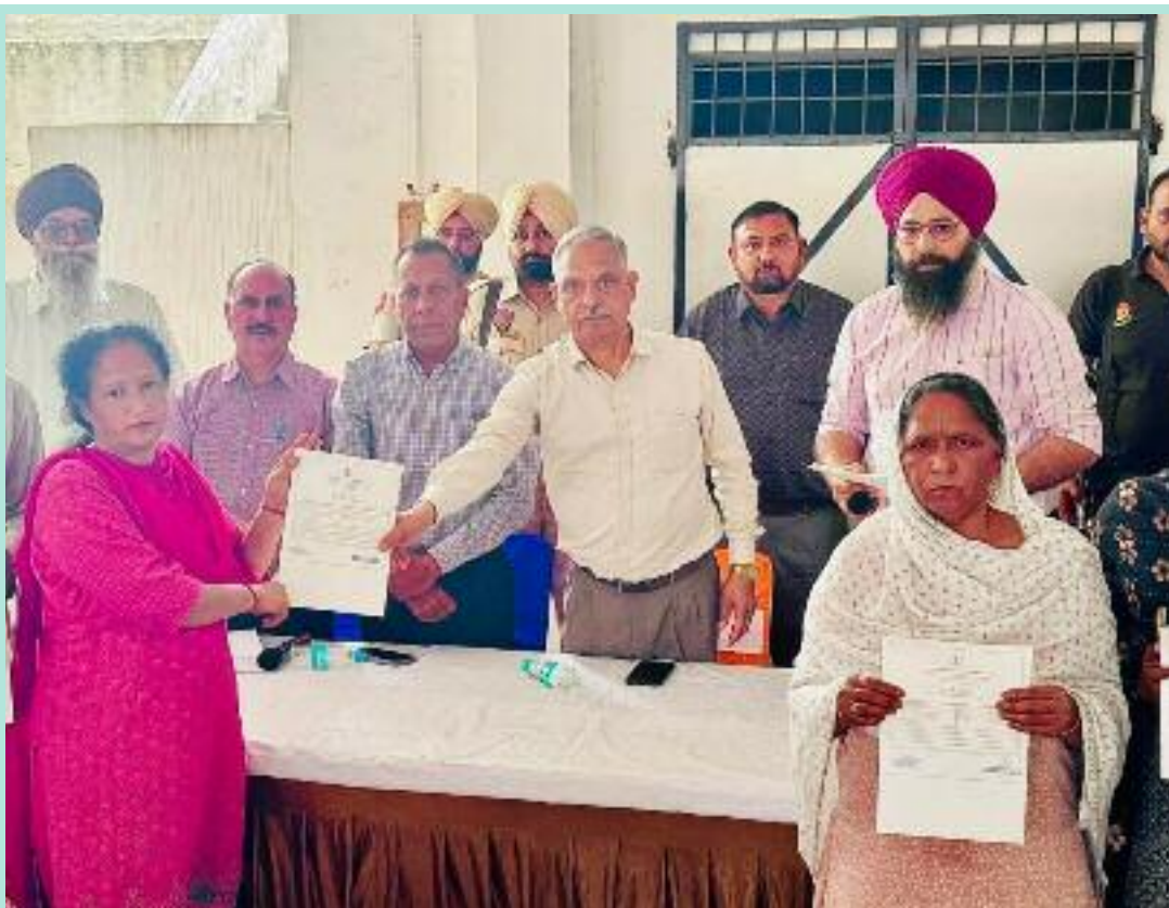
ਪਹਿਲਕਦਮੀ ਲੰਬੇ ਸਮੇਂ ਤੋਂ ਚੱਲ ਰਹੇ ਜਾਇਦਾਦ ਮਾਲਕੀ ਦੇ ਮੁੱਦਿਆਂ ਨੂੰ ਹੱਲ ਕਰਦੀ

ਗਿਰਵੀ ਰੱਖ ਕੇ ਆਰਥਿਕ ਸਹਾਇਤਾ ਪ੍ਰਾਪਤ ਕਰ ਸਕਣਗੇ ਅਤੇ ਆਪਣੇ ਜੀਵਨ ਪੱਧਰ ਨੂੰ ਹੋਰ ਸੁਧਾਰ ਸਕਣਗੇ। ਇਸ ਨਾਲ ਉਹਨਾਂ ਨੂੰ ਸਿਰਫ਼ ਸੁਰੱਖਿਆ ਹੀ ਨਹੀਂ ਮਿਲੇਗੀ, ਸਗੋਂ ਉਹ ਆਪਣੇ ਸੰਪਤੀ ਹੱਕ ਨੂੰ ਹੋਰ ਵੱਖ-ਵੱਖ ਤਰੀਕਿਆਂ ਨਾਲ ਵੀ ਵਰਤ ਸਕਣਗੇ। ਇਸ ਯੋਜਨਾ ਨਾਲ ਗਰੀਬ ਅਤੇ ਜ਼ਰੂਰਤਮੰਦ ਪਰਿਵਾਰਾਂ ਨੂੰ ਵੱਡੀ ਰਾਹਤ ਮਿਲੀ ਹੈ ਅਤੇ ਉਹਨਾਂ ਦੀ ਆਰਥਿਕ ਅਤੇ ਸਮਾਜਿਕ ਸਥਿਤੀ ਵਿੱਚ ਵੀ ਮਜ਼ਬੂਤੀ ਆਏਗੀ। ਪਿੰਡ ਵਾਸੀਆਂ ਵੱਲੋਂ ਇਸ ਉਪਰਾਲੇ ਦੀ ਖੂਬ ਸਰਾਹਨਾ ਕੀਤੀ ਗਈ ਅਤੇ ਇਸ ਨੂੰ ਲੋਕ-ਹਿਤੈਸ਼ੀ ਕਦਮ ਕਰਾਰ ਦਿੱਤਾ ਗਿਆ। ਉਨ੍ਹਾਂ ਕਿਹਾ ਕਿ ਇਹ ਇਤਿਹਾਸਕ