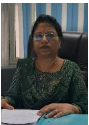
ਕਰਨ ਲਈ ਵਿਗਿਆਨਕ ਸੋਚ ਅਤੇ ਤੱਥਾਂ 'ਤੇ ਆਧਾਰਿਤ ਜਾਣਕਾਰੀ ਨੂੰ ਅਪਣਾਉਣਾ ਬਹੁਤ ਜ਼ਰੂਰੀ ਹੈ। ਉਨ੍ਹਾਂ ਦੱਸਿਆ ਕਿ ਟੀਕਾਕਰਨ, ਸਾਫ-ਸਫਾਈ,

ਕਿ ਵਿਸ਼ਵ ਸਿਹਤ ਦਿਵਸ ਸਾਨੂੰ ਇਹ ਸੰਦੇਸ਼ ਦਿੰਦਾ ਹੈ ਕਿ ਸਿਹਤ ਸਿਰਫ ਵਿਅਕਤੀਗਤ ਨਹੀਂ, ਸਗੋਂ ਸਮੂਹਿਕ ਜ਼ਿੰਮੇਵਾਰੀ ਵੀ ਹੈ। ਸਾਰਿਆਂ ਦੇ ਸਾਂਝੇ ਯਤਨਾਂ ਨਾਲ ਹੀ ਇੱਕ ਤੰਦਰੁਸਤ ਅਤੇ ਖੁਸ਼ਹਾਲ ਸਮਾਜ ਦੀ ਸਿਰਜਣਾ ਸੰਭਵ ਹੈ। ਉਨ੍ਹਾਂ ਦੱਸਿਆ ਕਿ ਮਨੁੱਖ ਦੀ ਸਭ ਤੋਂ ਵੱਡੀ ਦੌਲਤ ਸਿਹਤ ਹੁੰਦੀ ਹੈ ਅਤੇ ਜੇਕਰ ਅਸੀਂ ਸਿਹਤਮੰਦ ਹੋਵਾਂਗੇ ਤਾਂ ਹੀ ਆਪਣੀ ਜ਼ਿੰਦਗੀ ਦਾ ਆਨੰਦ ਮਾਣ ਸਕਾਂਗੇ। ਉਨ੍ਹਾਂ ਅੱਗੇ ਕਿਹਾ ਕਿ ਮੌਜੂਦਾ ਸਮੇਂ ਵਿੱਚ ਸਿਹਤ ਸਬੰਧੀ ਚੁਣੌਤੀਆਂ ਦਾ ਸਮਰਥਿਤ ਢੰਗ ਨਾਲ ਮੁਕਾਬਲਾ