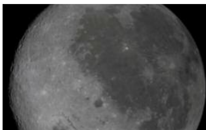
'ਆਰਟੇਮਿਸ-2' ਮਿਸ਼ਨ ਦੌਰਾਨ ਨੌੜਿਓਂ ਲਈ ਗਈ ਚੰਦਰਮਾ ਦੀ ਤਸਵੀਰ।

ਵੈਨਕੂਵਰ, 6 ਅਪ੍ਰੈਲ (ਮਲਕੀਤ ਸਿੰਘ) - ਨਾਸਾ ਦੇ 'ਆਰਟੇਮਿਸ-2' ਮਿਸ਼ਨ ਨਾਲ ਜੁੜੇ ਪੁਲਾੜ ਯਾਤਰੀਆਂ ਨੇ ਮਨੁੱਖੀ ਪੁਲਾੜ ਯਾਤਰਾ ਵਿੱਚ ਨਵਾਂ ਇਤਿਹਾਸ ਰਚਦਿਆਂ ਸਭ ਤੋਂ ਵੱਧ ਦੂਰੀ ਤੈਅ ਕਰਨ ਦਾ ਰਿਕਾਰਡ ਕਾਇਮ ਕਰ ਦਿੱਤਾ ਹੈ। ਚੰਦਰਮਾ ਦੀ ਪਰਿਕਰਮਾ ਕਰਨ ਤੋਂ ਬਾਅਦ ਹੁਣ ਟੀਮ ਸੁਰੱਖਿਅਤ ਤਰੀਕੇ ਨਾਲ ਧਰਤੀ ਵਾਪਸੀ ਵੱਲ ਵਧ ਰਹੀ ਹੈ। ਮਿਸ਼ਨ ਦੌਰਾਨ ਓਰਾਇਨ ਅੰਤਰਿਕਸ਼ ਯਾਨ ਨੇ ਉਹ ਦੂਰੀ ਪਾਰ ਕੀਤੀ ਜੋ ਇਸ ਤੋਂ ਪਹਿਲਾਂ ਕਿਸੇ ਵੀ ਮਨੁੱਖ ਵੱਲੋਂ ਤੈਅ ਨਹੀਂ ਕੀਤੀ ਗਈ ਸੀ। ਇਸ ਇਤਿਹਾਸਕ ਪਲ ਦੌਰਾਨ ਮਿਸ਼ਨ ਨੇ ਮਨੁੱਖੀ ਖੋਜ ਦੇ ਨਵੇਂ ਮਿਆਰ ਸਥਾਪਿਤ ਕੀਤੇ ਹਨ। ਮਿਸ਼ਨ ਦੌਰਾਨ ਪੁਲਾੜ ਯਾਤਰੀਆਂ ਨੇ ਚੰਦਰਮਾ ਦੇ ਨੇੜੇ ਤੋਂ ਲੰਘਦਿਆਂ ਉਸਦਾ ਪੂਰਾ ਚੱਕਰ ਲਗਾਇਆ ਅਤੇ ਇਸ ਦੌਰਾਨ ਉਨ੍ਹਾਂ ਨੇ ਪੁਲਾੜ ਤੋਂ ਧਰਤੀ ਅਤੇ ਚੰਦਰਮਾ ਦੇ ਅਦਭੁਤ ਦ੍ਰਿਸ਼ ਵੇਖੇ।