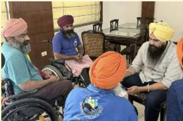
ਕਿ ਲੋਕਾਂ ਨਾਲ ਸਿੱਧਾ ਸੰਪਰਕ ਹੈ, ਕਿਉਂਕਿ ਇਸ ਨਾਲ ਬਣਾਈ ਰੱਖਣਾ ਬਹੁਤ ਜ਼ਰੂਰੀ ਹਕੀਕਤੀ ਸਮੱਸਿਆਵਾਂ ਦੀ