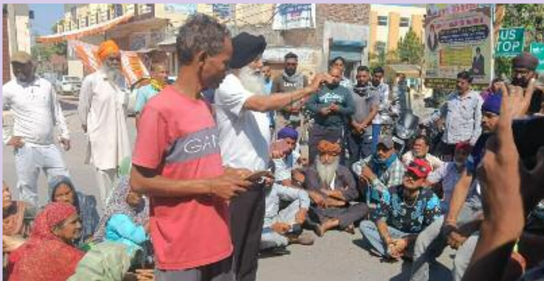
ਹਨ ਲੋਕਾਂ ਨੂੰ ਸਮੇਂ ਸਿਰ ਦੂਸਰੇ ਪਾਸੇ ਏਂਜੰਸੀ ਦੇ ਵੀ ਨਹੀਂ ਸਰਕ ਰਹੀ ਹੈ। ਸਪਲਾਈ ਮਿਲਣੀ ਚਾਹੀਦੀ ਕਰਮਚਾਰੀਆਂ ਦੇ ਕੰਨ ਤੇ ਜੂੰ ਭਾਰਤੀ ਕਿਸਾਨ ਯੂਨੀਅਨ ਦੇ

ਤਾਂ ਗੈਸ ਏਂਜੰਸੀ ਦੇ ਕਰਿੰਦੇ ਸਾਡੇ ਨਾਲ ਮਾੜਾ ਵਿਵਹਾਰ ਕਰੇ ਹਨ ਅਤੇ ਸਾਨੂੰ ਗੈਸ ਸਲੰਡਰ ਤਾਂ ਇੱਕ ਪਾਸੇ ਪਰਚੀ ਵੀ ਨਹੀਂ ਦੇ ਰਹੇ ਹਨ। ਉਨਾਂ ਇਹ ਵੀ ਕਿਹਾ ਕਿ ਅਸੀਂ ਇੱਥੇ ਗਰਮੀ ਵਿੱਚ ਸਲੰਡਰ ਲੈਣ ਲਈ ਜਦੋਂ ਜਹਿਦ ਕਰ ਰਹੇ ਹਾਂ ਦੂਸਰੇ ਪਾਸ ਮਹਿਤਪੁਰ ਦੇ ਫਾਸਟ ਫੂਡ ਵਾਲੀਆਂ ਰੇਹੜੀਆਂ ਤੇ ਘਰੇਲੂ ਗੈਸ ਆਮ ਚੱਲ ਰਹੇ ਹਨ ਪਤਾ ਨਹੀਂ ਇਹਨਾਂ ਰੇਹੜੀਆਂ ਵਾਲੀਆਂ ਨੂੰ ਘਰੇਲੂ ਗੈਸ ਸਲੰਡਰ ਕੌਨ ਸਪਲਾਈ ਕਰ ਰਿਹਾ ਹੈ। ਭਾਵੇਂ ਜਲੰਧਰ ਦੇ ਡਿਪਟੀ ਕਮਿਸ਼ਨਰ ਨੇ ਸਖਤ ਹਦਾਇਤਾਂ ਕੀਤੀਆਂ