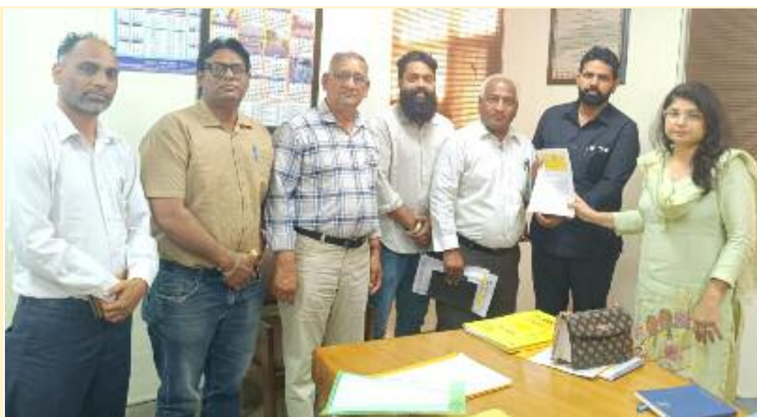
ਕਰਮਚਾਰੀਆਂ ਨੂੰ ਸਕੂਲ ਸਮੇਂ ਕੰਮ ਕਰਨ ਅਤੇ ਸੁਰੱਖਿਆ ਪ੍ਰਦਾਨ ਦੀ ਮੰਗ ਵੀ ਕੀਤੀ ਗਈ। ਆਉਣ ਵਾਲੀ ਜਨਗਣਨਾ ਲਈ ਮਹਿਲਾ ਕਰਮਚਾਰੀਆਂ ਦੀ ਡਿਊਟੀ ਨਾ ਲਗਵਾਉਣ ਸੰਬੰਧੀ ਮੰਗ ਰੱਖੀ ਗਈ। ਇਸ ਸੰਬੰਧੀ ਏਡੀਸੀ ਸਾਹਿਬ ਨੇ ਹਾਂ ਪੱਖੀ ਹੁੰਗਾਰਾ ਭਰਿਆ। ਐਸ ਆਈ ਆਰ ਦੇ ਕੰਮ ਦੇ ਕਾਰਨ ਬੀ ਐਲ ਓ ਉਪਰ ਪੈ ਰਹੇ ਮਾਨਸਿਕ ਦਬਾਅ ਦਾ ਮਸਲਾ ਅਤੇ ਉਹਨਾਂ ਨੂੰ ਇੱਕ ਕਰੋੜ ਦੇ ਬੀਮੇ ਹੇਠ ਕਵਰ ਕਰਨ ਦੀ ਗੱਲ ਰੱਖੀ ਗਈ। ਇਸ ਤੋਂ ਇਹ ਮੰਗ ਉੱਚ

ਲੜਕੀਆਂ, ਕਪਲ ਕੇਸ ਆਦਿ ਨੂੰ ਛੋਟ ਦੇਣ, ਬਾਬਾ ਸਾਹਿਬ ਅੰਬੇਡਕਰ ਜੀ ਦੇ ਬੁੱਤਾਂ ਨੂੰ ਸੁਰੱਖਿਅਤ ਰੱਖਣ ਲਈ ਸੁਰੱਖਿਆ ਪ੍ਰਧਾਨ ਕਰਵਾਉਣੀ, ਬੀ ਐਲ ਓ ਦੇ ਕੰਮ ਸੰਬੰਧੀ ਵਿਸਥਾਰ ਵਿੱਚ ਚਰਚਾ ਕੀਤੀ ਗਈ। ਮੀਟਿੰਗ ਦੌਰਾਨ ਜ਼ਿਲ੍ਹਾ ਪ੍ਰਧਾਨ ਜੀ ਵਲੋਂ ਡਰੱਗ ਸੋਸ਼ਲ ਸਰਵੇ ਵਿੱਚ ਅਧਿਆਪਕਾਂ ਦੀ ਜਬਰੀ ਡਿਊਟੀ ਨਾ ਲਗਵਾਉਣ ਸੰਬੰਧੀ ਮਸਲਾ ਰੱਖਿਆ ਗਿਆ ਅਤੇ ਜਿਥੋਂ ਤੱਕ ਹੋ ਸਕੇ ਘੱਟ ਤੋਂ ਘੱਟ ਅਧਿਆਪਕਾਂ ਦੀ ਡਿਊਟੀ ਲਗਾਉਣ ਦੀ ਮੰਗ ਕੀਤੀ ਗਈ। ਇਸ ਤੋਂ ਏ ਡੀ ਸੀ ਸਾਹਿਬ ਨੇ ਕਿਹਾ ਕਿ ਸਿਰਫ ਸਹਿਮਤੀ ਦੇਣ ਵਾਲੇ ਅਧਿਆਪਕ ਨੂੰ ਹੀ ਇਸ ਡਿਊਟੀ ਤੇ ਤਾਇਨਾਤ ਕੀਤਾ ਜਾਵੇਗਾ। ਇਸ ਤੋਂ ਇਲਾਵਾ ਇਸ ਸਰਵੇ ਦੌਰਾਨ