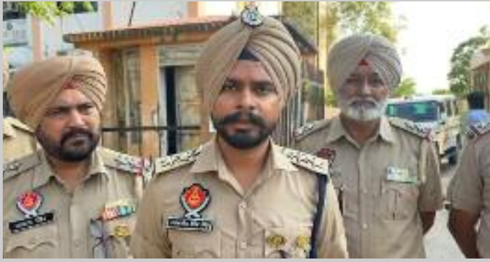
ਕੰਪਲੈਕਸ ਵਿੱਚ ਵਿਸ਼ੇਸ਼ ਅਤੇ ਐਂਟੀ ਸਾਬੋਟੇਜ ਜਾਂਚ ਸੁਰੱਖਿਆ ਪ੍ਰਬੰਧ ਕੀਤੇ ਗਏ ਮੁਹਿੰਮ ਚਲਾਈ ਗਈ। ਪੂਰੇ