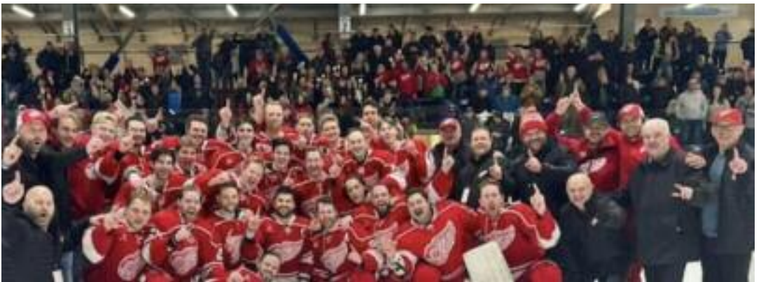
ਹਰਡਰ ਕੱਪ ਜਿੱਤਣ ਮਗਰੋਂ ਖੁਸ਼ੀ ਮਨਾਉਂਦੇ ਡੀਅਰ ਲੋਕ ਰੈੱਡ ਵਿੰਗਜ਼ ਦੇ ਖਿਡਾਰੀ।

ਸਰੀਰਕ ਤੰਦਰੁਸਤੀ ਬਣਾਈ ਰੱਖਣ ਅਤੇ ਸਰਗਰਮ ਰਹਿਣ ਲਈ ਉਹ ਸਾਲ ਭਰ ਸਾਈਕਲ ਚਲਾਉਂਦਾ ਹੈ। ਉਹ ਮੰਨਦਾ ਹੈ ਕਿ ਮੁਸ਼ਕਲ ਹਾਲਾਤਾਂ ਵਿੱਚ ਵੀ ਮਨੋਬਲ ਮਜ਼ਬੂਤ ਰੱਖਣਾ ਬਹੁਤ ਜ਼ਰੂਰੀ ਹੈ। ਇਸ ਘਟਨਾ ਨੇ ਸਥਾਨਕ ਲੋਕਾਂ ਵਿੱਚ ਵੀ ਕਾਫ਼ੀ ਪ੍ਰਭਾਵ ਛੱਡਿਆ ਹੈ ਅਤੇ ਕਈ ਲੋਕ ਉਸਦੀ ਹਿੰਮਤ ਨੂੰ ਸਲਾਮ ਕਰ ਰਹੇ ਹਨ। ਇਹ ਕਹਾਣੀ ਦਰਸਾਉਂਦੀ ਹੈ ਕਿ ਉਮਰ ਸਿਰਫ਼ ਇਕ ਅੰਕ ਹੈ ਅਤੇ ਦ੍ਰਿੜ ਇਰਾਦੇ ਨਾਲ ਹਰ ਚੁਣੌਤੀ ਨੂੰ ਪਾਰ ਕੀਤਾ ਜਾ ਸਕਦਾ ਹੈ।