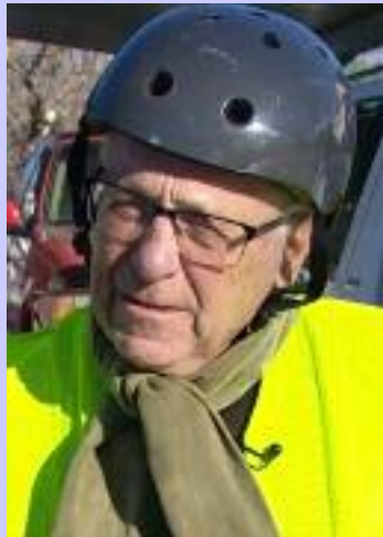
80 ਸਾਲਾ ਬਜ਼ੁਰਗ ਦੀ ਇੱਕ ਤਸਵੀਰ

ਵੈਨਕੂਵਰ, 6 ਅਪ੍ਰੈਲ (ਮਲਕੀਤ ਸਿੰਘ) - ਕੈਨੇਡਾ ਦੇ ਸਸਕੈਚਵਨ ਸੂਬੇ ਵਿੱਚ 80 ਸਾਲਾ ਇਕ ਬਜ਼ੁਰਗ ਵਿਅਕਤੀ ਆਪਣੀ ਹਿੰਮਤ ਅਤੇ ਜ਼ਿੰਦਗੀ ਨਾਲ ਲੋਕਾਂ ਲਈ ਪ੍ਰੇਰਣਾ ਬਣ ਰਿਹਾ ਹੈ, ਜੋ ਕੜਾਕੇ ਦੀ ਸਰਦੀ ਅਤੇ ਬਰਫੀਲੇ ਮੌਸਮ ਵਿੱਚ ਵੀ ਸਾਈਕਲ ਚਲਾ ਕੇ ਆਪਣੇ ਰੋਜ਼ਾਨਾ ਦੇ ਕੰਮ ਨਿਪਟਾ ਰਿਹਾ ਹੈ। ਪ੍ਰਾਪਤ ਵੇਰਵਿਆਂ ਅਨੁਸਾਰ ਇਹ ਬਜ਼ੁਰਗ ਹਰ ਰੋਜ਼ ਸਾਈਕਲ ਰਾਹੀਂ ਯਾਤਰਾ ਕਰਦਾ ਹੈ, ਭਾਵੇਂ ਤਾਪਮਾਨ ਜ਼ੀਰੋ ਤੋਂ ਕਾਫ਼ੀ ਹੇਠਾਂ ਹੀ ਕਿਉਂ ਨਾ ਹੋਵੇ। ਠੰਢੀ ਹਵਾਵਾਂ ਅਤੇ