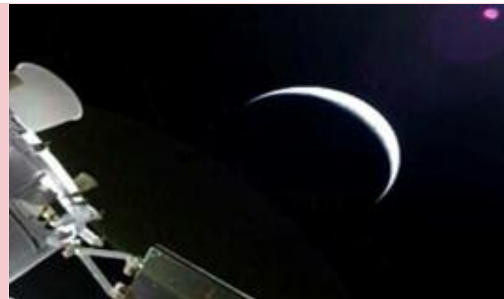
ਫੋਟੋ ਕੈਪਸ਼ਨ: ਅੰਤਰਿਕਸ਼ ਵਿੱਚ ਚੰਦ ਵੱਲ ਵਧਦਾ ਅੰਤਰਿਕਸ਼ ਯਾਨ।