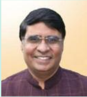
ਅਤੇ ਟ੍ਰਾਂਸਪੋਰਟ ਕਾਰੋਬਾਰੀਆਂ 'ਤੇ ਵਾਧੂ ਆਰਥਿਕ ਬੋਝ ਪੈਦਾ ਹੋ

ਲਿਖ ਕੇ ਤੁਰੰਤ ਦਖਲ ਦੀ ਮੰਗ ਕੀਤੀ ਹੈ। ਆਪਣੇ ਪੱਤਰ ਵਿੱਚ ਉਨ੍ਹਾਂ ਕਿਹਾ ਕਿ ਹਿਮਾਚਲ ਸਰਕਾਰ ਵੱਲੋਂ ਰਾਜ ਵਿੱਚ ਦਾਖਲ ਹੋਣ ਵਾਲੇ ਵਾਹਨਾਂ, ਸਮੇਤ ਰਾਸ਼ਟਰੀ ਰਾਜਮਾਰਗਾਂ 'ਤੇ ਚੱਲਣ ਵਾਲਿਆਂ 'ਤੇ ਵੀ ਐਂਟਰੀ ਟੈਕਸ ਲਗਾਇਆ ਜਾ ਰਿਹਾ ਹੈ। ਇਸ ਨਾਲ ਆਮ ਯਾਤਰੀਆਂ