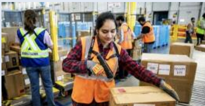
ਐਮਾਜ਼ਾਨ ਦੇ ਕਰਮਚਾਰੀਆਂ ਦੀ ਇੱਕ ਤਸਵੀਰ।

ਵੈਨਕੂਵਰ, (ਮਲਕੀਤ ਸਿੰਘ) - ਵਧ ਰਹੀਆਂ ਗਿਆ ਹੈ ਤੇਲ ਦੀਆਂ ਕੀਮਤਾਂ ਦੇ ਜਾਣਕਾਰੀ ਮੁਤਾਬਕ ਮਾ 'ਦੇ ਨ ਜ਼ ਰ ਕੰਪਨੀ ਵਲੋਂ 3.5 ਐਮਾਜ਼ਾਨ ਵਲੋਂ 17 ਫੀਸਦੀ ਦਾ ਅਪ੍ਰੈਲ ਤੋਂ ਕੈਨੇਡਾ ਸਰਚਾਰਜ ਲਾਗੂ ਅਤੇ ਅਮਰੀਕਾ ਦੇ ਕੀਤਾ ਜਾਵੇਗਾ, ਜੋ ਵਿਕਰੇਤਾਵਾਂ ਲਈ ਨਵਾਂ ਖਾਸ ਤੌਰ 'ਤੇ ਉਹਨਾਂ ਫਿਊਲ ਸਰਚਾਰਜ ਲਾਗੂ ਵਿਕਰੇਤਾਵਾਂ 'ਤੇ ਲਾਗੂ