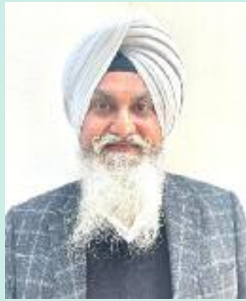
ਤੋੜ-ਫੋੜ ਦੀ ਦੂਜੀ ਘਟਨਾ ਹੈ,

ਰਾਜ ਵਿੱਚ ਕਈ ਵਾਰ ਬਾਬਾ ਸਾਹਿਬ ਅੰਬੇਡਕਰ ਦੀ ਦੇ ਬੁੱਤ ਦਾ ਅਪਮਾਨ ਕੀਤਾ ਗਿਆ ਹੈ। ਇਸ ਤੋਂ ਸਾਫ਼ ਹੈ ਕਿ ਪੰਜਾਬ ਦੀ ਕਾਨੂੰਨ ਵਿਵਸਥਾ ਇਸ ਸਰਕਾਰ ਦੇ ਵੱਸ ਦੀ ਗੱਲ ਨਹੀਂ ਰਹੀ। ਉਨ੍ਹਾਂ ਕਿਹਾ ਕਿ ਜੇ ਸਰਕਾਰ ਪ੍ਰਤਿਮਾਵਾਂ ਦੀ ਸੁਰੱਖਿਆ ਨਹੀਂ ਕਰ ਸਕਦੀ, ਉਸ ਤੋਂ ਆਮ ਜਨਤਾ ਆਪਣੀ ਸੁਰੱਖਿਆ ਦੀ ਉਮੀਦ ਕਿਵੇਂ ਕਰ ਸਕਦੀ ਹੈ। ਉਹਨਾਂ ਕਿਹਾ ਕਿ ਇਸ ਥਾਂ 'ਤੇ ਇਹ