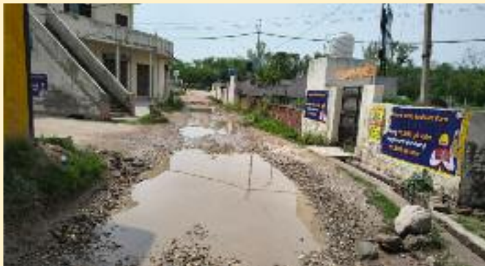
ਪਿੰਡ ਜੀਓਵਾਲ-ਬੱਛੂਆਂ ਦੀ ਖਸਤਾ ਹਾਲ ਲਿੰਕ ਸੜਕ ਦੀ ਤਸਵੀਰ।

ਰਿਹਾ ਅਤੇ ਬੁਰੀ ਤਰ੍ਹਾਂ ਟੁੱਟ ਚੁੱਕੀ ਇਸ ਸੜਕ ਵਿੱਚ ਥਾਂ-ਥਾਂ ਡੂੰਘੇ ਖੰਡੇ ਬਣੇ ਹੋਏ ਹਨ ਜਿਨ੍ਹਾਂ ਵਿੱਚ ਜਦੋਂ ਪਾਣੀ ਜਮਾਂ ਹੋ ਜਾਂਦਾ ਹੈ ਤਾਂ ਸਥਿਤੀ ਹੋਰ ਵੀ ਮਾੜੀ ਹੋ ਜਾਂਦੀ ਹੈ। ਖਸਤਾ ਹਾਲ ਇਸ ਸੜਕ ਤੋਂ ਲੰਘਦੇ ਦੋਪਹੀਆ ਵਾਹਨ ਚਾਲਕਾਂ ਨੂੰ ਜਿੱਥੇ ਸੌਟਾਂ ਦਾ ਡਰ ਰਹਿੰਦਾ ਹੈ ਉੱਥੇ ਹੀ ਪਿੰਡਾਂ ਦੇ ਵਸਨੀਕਾਂ ਦਾ ਲੰਘਣਾ ਕਿਸੇ ਮੁਸੀਬਤ ਤੋਂ ਘੱਟ ਨਹੀਂ।