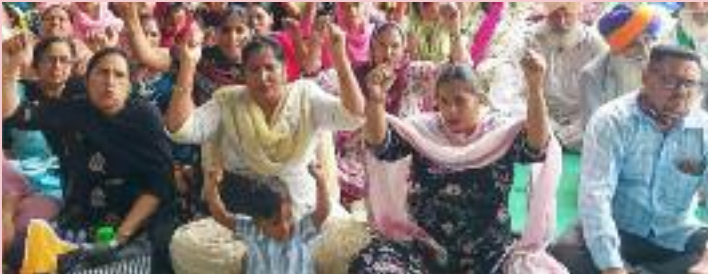
ਦੀ ਥਾਂ ਕੰਮ ਘੱਟ 8 ਤੋਂ 12 ਘੰਟੇ ਦੀ ਦਿਹਾੜੀ ਹੋਵੇਗੀ। ਆਗੂਆਂ ਨੇ ਜੀ ਰਾਮ ਜੀ ਕਾਨੂੰਨ ਦੀ ਥਾਂ ਮਗਨਰੇਗਾ ਲਾਗੂ ਕਰਨ, ਕੱਚੇ ਅਤੇ ਸਕੀਮ ਵਰਕਰ ਪੱਕੇ ਕਰਨ, ਪੁਰਾਣੀ ਪੈਨਸ਼ਨ ਸਕੀਮ ਬਹਾਲ

ਸਰਕਾਰ ਕਾਰਪੋਰੇਟ ਘਰਾਣਿਆਂ ਤੇ ਦੇਸ਼ੀ ਵਿਦੇਸ਼ੀ ਸਰਮਾਏਦਾਰਾਂ ਨੂੰ ਖੁਸ਼ ਕਰਨ ਲਈ ਮਜ਼ਦੂਰਾਂ ਤੋਂ ਯੂਨੀਅਨ ਬਣਾਉਣ ਤੇ ਸੰਘਰਸ਼ ਕਰਨ ਵਰਗੇ ਬੁਨਿਆਦੀ ਹੱਕ ਖੋਹਣ ਲਈ ਕੇਂਦਰ ਸਰਕਾਰ ਮਜ਼ਦੂਰ ਪੱਖੀ 29 ਲੇਬਰ ਕਾਨੂੰਨਾਂ ਨੂੰ ਖ਼ਤਮ ਕਰਕੇ 4 ਲੇਬਰ ਕੋਡ ਲਾਗੂ ਕਰ ਰਹੀ ਹੈ। ਉਨ੍ਹਾਂ ਕਿਹਾ ਕਿ ਇਹ ਕੋਡ ਲਾਗੂ ਹੋਣ ਨਾਲ ਮਜ਼ਦੂਰਾਂ ਕੋਲ ਆਪਣੇ ਅਧਿਕਾਰਾਂ ਨੂੰ ਸੁਰੱਖਿਅਤ ਕਰਨ ਅਤੇ ਪ੍ਰਾਪਤ ਕਰਨ ਲਈ ਯੂਨੀਅਨ ਬਣਾਉਣ ਅਤੇ ਸੰਘਰਸ਼ ਕਰਨ ਦਾ ਜਮਹੂਰੀ ਅਧਿਕਾਰ ਖ਼ਤਮ ਹੋ ਜਾਵੇਗਾ। ਕੰਮ ਦਾ ਮਿਹਨਤਨਾ ਵਧਾਉਣ