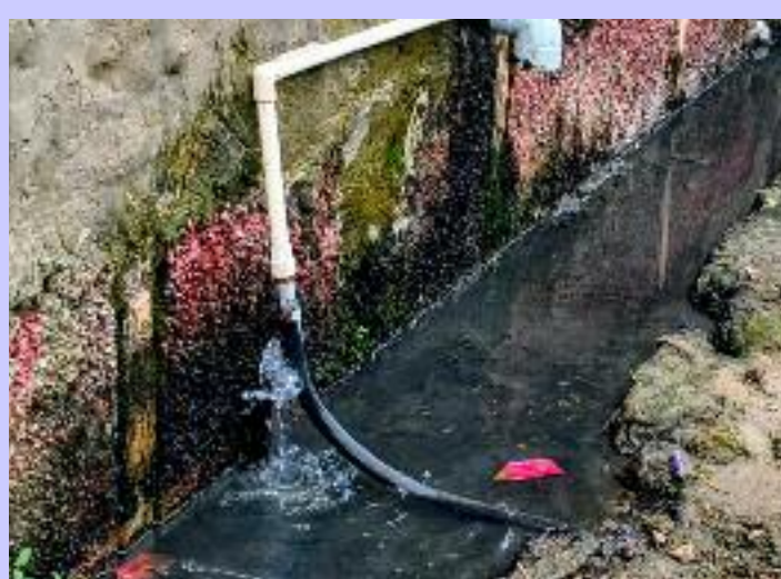
ਲੰਘਦੇ ਗੰਦੇ ਪਾਣੀ ਦੇ ਨਿਕਾਸੀ ਕਥਿਤ ਜਾਣਕਾਰੀ ਤੋਂ ਇਹ ਵੀ ਨਾਲੇ ਵਿੱਚ ਜਾ ਰਿਹਾ ਹੈ। ਪਤਾ ਲੱਗਾ ਹੈ ਕਿ ਟੁੱਟੇ ਹੋਏ

ਦਿਨ ਪ੍ਰਤੀ ਦਿਨ ਗੰਭੀਰ ਹੋ ਰਹੀ ਹੈ। ਪਿੰਡ ਟੌਂਸਾ ਵਿੱਚ ਪੀਣ ਵਾਲੇ ਸਾਫ ਪਾਣੀ ਦੀ ਬਰਬਾਦੀ ਦਾ ਇੱਕ ਵੱਖਰਾ ਹੀ ਤਰੀਕਾ ਸਾਹਮਣੇ ਆਇਆ ਹੈ। ਪਿੰਡ ਦੇ ਸੇਵਾ ਕੇਂਦਰ ਨੂੰ ਜਾਣ ਵਾਲੀ ਗਲੀ ਵਿੱਚ ਇੱਕ ਅਜਿਹਾ ਘਰ ਹੈ ਜਿਸ ਵਿੱਚ ਪੀਣ ਵਾਲੇ ਪਾਣੀ ਦੇ ਕਨੈਕਸ਼ਨ ਚੱਲ ਰਹੇ ਹਨ ਅਤੇ ਇਹਨਾਂ ਕਨੈਕਸ਼ਨਾਂ ਵਿੱਚੋਂ ਕਿਸੇ ਕਾਰਨ ਇੱਕ ਕਨੈਕਸ਼ਨ ਦੀ ਪਾਈਪ ਟੁੱਟੀ ਹੋਈ ਹੈ ਅਤੇ ਉਸ ਦਾ ਸਾਫ ਪਾਣੀ ਬੀਤੇ ਕਈ ਮਹੀਨਿਆਂ ਤੋਂ ਘਰ ਦੇ ਨਾਲੋਂ