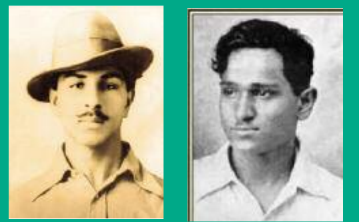
ਬਿਲ' ਅਤੇ ਟਰੇਡ ਡਿਸਪਿਊਟ ਬਿਲ ਦੇ ਨਾਂਅ ਹੇਠ ਕਾਲੇ ਕਾਨੂੰਨਾਂ ਦੇ ਦੰਦ ਤਿੱਖੇ ਕੀਤੇ ਜਾ ਰਹੇ ਹਨ ਜਿਸ ਖ਼ਿਲਾਫ਼ ਆਵਾਜ਼ ਨੂੰ ਆਵਾਜ਼ ਬੁਲੰਦ ਕਰਨ ਲਈ ਅੱਗੇ ਆਉਣ ਦੀ ਲੋੜ ਹੈ। ਭਗਤ ਸਿੰਘ ਅਤੇ ਬੁਟਕੇਸ਼ਵਰ ਦੱਤ ਨੇ ਅਸੈਂਬਲੀ ਵਿੱਚ ਇੱਕ ਵਿਸ਼ੇਸ਼ ਮੰਤਵ ਨਾਲ