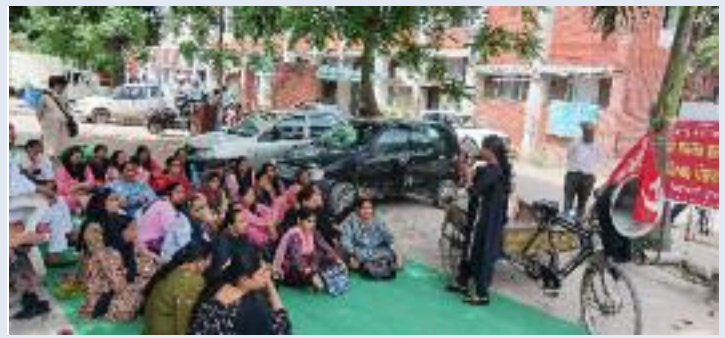
ਵਲੋਂ ਲਹੂ ਵੀਟਵੇ ਸ਼ੰਘਰਸ਼ਾ ਨਾਲ ਬਣਾਏ ਕਿਰਤ ਕਾਨੂੰਨ ਬਹਾਲ ਕੀਤੇ ਜਾਣ ਉਨ੍ਹਾਂ ਅੱਗੇ ਕਿਹਾ ਕਿ ਘੱਟੋ