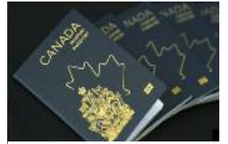
ਕੈਨੇਡੀਅਨ ਪਾਸਪੋਰਟ ਜੋ ਨਾਗਰਿਕਤਾ ਨਾਲ ਸੰਬੰਧਿਤ ਦਸਤਾਵੇਜ਼ਾਂ ਦੀ ਮਹੱਤਤਾ ਦਰਸਾਉਂਦਾ ਹੈ

ਨੋਵਾ ਸਕੋਸ਼ੀਆ 'ਚ ਅਰਜ਼ੀਆਂ ਜਮਾ ਕਰਾਉਣ ਦਾ ਸਿਲਸਿਲਾ ਤੇਜ਼ ਵੈਨਕੂਵਰ, 28 ਮਾਰਚ (ਮਲਕੀਤ ਸਿੰਘ) - ਕੈਨੇਡਾ ਵਿੱਚ ਨਾਗਰਿਕਤਾ ਕਾਨੂੰਨ ਵਿੱਚ ਕੀਤੀਆਂ ਨਵੀਆਂ ਸੋਧਾਂ ਤੋਂ ਬਾਅਦ ਨੋਵਾ ਸਕੋਸ਼ੀਆ ਸੂਬੇ ਵਿੱਚ ਵੰਸ਼ਾਵਲੀ ਰਿਕਾਰਡ (ਪੁਰਖਿਆਂ ਦੇ ਦਸਤਾਵੇਜ਼) ਪ੍ਰਾਪਤ ਕਰਨ ਲਈ ਅਰਜ਼ੀਆਂ ਵਿੱਚ ਅਚਾਨਕ ਵਾਧਾ ਇਕਦਮ ਤੇਜ਼ ਹੋ ਗਿਆ ਹੈ ਜਾਣਕਾਰੀ ਅਨੁਸਾਰ ਪਿਛਲੇ ਦਸੰਬਰ ਤੋਂ ਲਾਗੂ ਹੋਏ ਨਵੇਂ ਫੈਡਰਲ ਕਾਨੂੰਨ ਦੇ ਕਾਰਨ ਉਥੋਂ ਦੇ ਲੋਕ ਆਪਣੇ ਕੈਨੇਡੀਅਨ ਵੰਸ਼ ਨੂੰ ਸਾਬਤ ਕਰਨ ਲਈ ਪੁਰਾਣੇ ਰਿਕਾਰਡ ਖੰਗਾਲ ਰਹੇ ਹਨ, ਜਿਸ ਨਾਲ ਆਰਕਾਈਵਜ਼ ਅਤੇ ਵੰਸ਼ਾਵਲੀ ਵਿਦਵਾਨਾਂ ਕੋਲ ਪੁੱਛਗਿੱਛ ਵਿੱਚ ਕਾਫ਼ੀ ਵਾਧਾ ਹੋਇਆ ਹੈ। ਇੱਥੇ ਜ਼ਿਕਰਯੋਗ ਹੈ ਕਿ ਸਿਟੀਜ਼ਨਸ਼ਿਪ ਐਕਟ ਵਿੱਚ ਸੋਧ ਕਰਕੇ ਬਿੱਲ ਸੀ-3 ਦੇ ਤਹਿਤ ਪਹਿਲੀ ਪੀੜ੍ਹੀ ਦੀ ਸੀਮਾ ਹਟਾਈ ਗਈ ਹੈ, ਜਿਸ ਨਾਲ ਉਥੋਂ ਦੇ ਕਈ ਲੋਕਾਂ ਲਈ ਕੈਨੇਡੀਅਨ ਨਾਗਰਿਕਤਾ ਪ੍ਰਾਪਤ ਕਰਨ ਦੇ ਨਵੇਂ ਮੌਕੇ ਖੁੱਲ੍ਹਣ ਦੀ ਆਸ ਹੈ ਮਾਹਿਰਾਂ ਨੇ ਲੋਕਾਂ ਨੂੰ ਸਲਾਹ ਦਿੱਤੀ ਹੈ ਕਿ ਉਹ ਸਿਰਫ਼ ਅਧਿਕਾਰਕ ਅਤੇ ਭਰੋਸੇਯੋਗ ਰਿਕਾਰਡਾਂ 'ਤੇ ਹੀ ਨਿਰਭਰ ਕਰਨ ਅਤੇ ਸਹੀ ਜਾਣਕਾਰੀ ਦੇ ਆਧਾਰ 'ਤੇ ਅਰਜ਼ੀਆਂ ਦਾਖਲ ਕਰਨ।