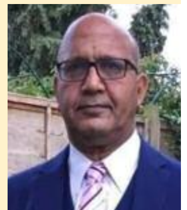
Bal Ram Sampla Geopolitics

ing to invest in the freedom that famous line promises. References 1. https://fullfact.org/politics/keir-starmer-270-billion-defence/ 2. https://ukdefencejournal.org.uk/royal-navy-starts-2026-with-seven-frigates/ 3. https://ukdefencejournal.org.uk/top-defence-spending-priorities-for-keir-starmer/ 4. https://www.portsmouth.co.uk/news/defence/royal-navy-hms-dragon-germany-replacement-nato-mission-6295479 5. https://www.forces-news.com/services/navy/royal-navy-command-nato-force-german-flagship-hms-dragon-sent-cyprus