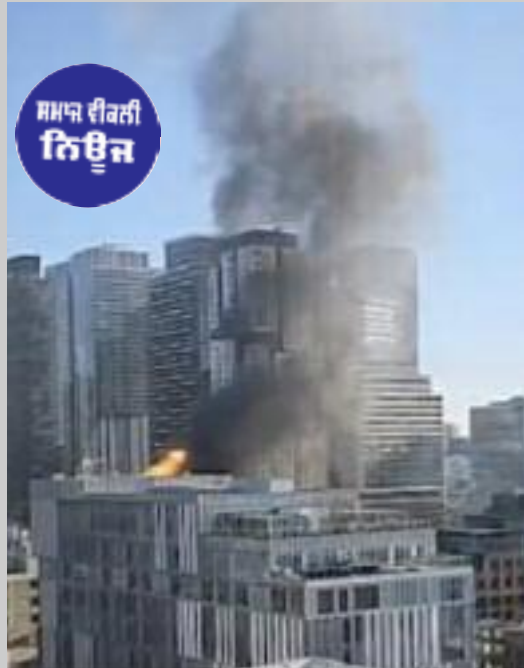
ਡਾਊਨਟਾਊਨ ਟੋਰਾਂਟੋ ਵਿੱਚ ਨਿਰਮਾਣ ਅਧੀਨ ਇਮਾਰਤ ਦੀ ਛੱਤ 'ਤੇ ਲੱਗੀ ਅੱਗ ਦੌਰਾਨ ਉੱਠਦਾ ਧੂੰਆਂ।

ਵੈਨਕੂਵਰ, (ਮਲਕੀਤ ਸਿੰਘ) - ਕੈਨੇਡਾ ਦੇ ਟੋਰਾਂਟੋ ਸ਼ਹਿਰ ਦੇ ਡਾਊਨਟਾਊਨ ਇਲਾਕੇ ਵਿੱਚ ਇੱਕ ਇਮਾਰਤ ਵਿੱਚ ਸੰਭਾਵਿਤ ਧਮਾਕੇ ਮਗਰੋਂ ਲੱਗੀ ਅੱਗ 'ਤੇ ਅੱਗ ਬੁਝਾਉ ਦਲ ਵੱਲੋਂ ਕਾਬੂ ਪਾ ਲਿਆ ਗਿਆ ਹੈ। ਪ੍ਰਾਪਤ ਜਾਣਕਾਰੀ ਅਨੁਸਾਰ ਇਹ ਅੱਗ ਰਿਚਮੰਡ ਸਟਰੀਟ ਵੈਸਟ ਅਤੇ ਜਾਨ ਸਟਰੀਟ ਨੇੜੇ ਇੱਕ ਨਿਰਮਾਣ ਅਧੀਨ ਵਪਾਰਕ ਇਮਾਰਤ ਦੀ ਛੱਤ 'ਤੇ ਲੱਗੀ ਸੀ। ਪੁਲਿਸ ਮੁਤਾਬਕ ਇਹ ਧਮਾਕਾ ਸ਼ੁੱਕਰਵਾਰ ਸ਼ਾਮ ਵੇਲੇ ਹੋਇਆ ਹੋਣ ਦੀ ਸੰਭਾਵਨਾ ਹੈ। ਅੱਗ ਬੁਝਾਉ ਅਧਿਕਾਰੀਆਂ ਨੇ ਮੌਕੇ 'ਤੇ ਪਹੁੰਚ ਕੇ ਕਾਰਵਾਈ ਕਰਦਿਆਂ ਅੱਗ ਨੂੰ ਬੁਝਾ ਦਿੱਤਾ ਅਤੇ ਹੁਣ ਇਲਾਕੇ ਨੂੰ ਸੁਰੱਖਿਅਤ ਕਰ ਦਿੱਤਾ ਗਿਆ ਹੈ। ਪੁਲਿਸ ਅਤੇ ਹੋਰ ਐਮਰਜੈਂਸੀ ਸੇਵਾਵਾਂ ਵੱਲੋਂ ਮਾਮਲੇ ਦੀ ਜਾਂਚ ਜਾਰੀ ਹੈ ਅਤੇ ਧਮਾਕੇ ਦੇ ਕਾਰਨਾਂ ਬਾਰੇ ਅਜੇ ਤੱਕ ਕੋਈ ਅਧਿਕਾਰਕ ਪੁਸ਼ਟੀ ਨਹੀਂ ਕੀਤੀ ਗਈ।