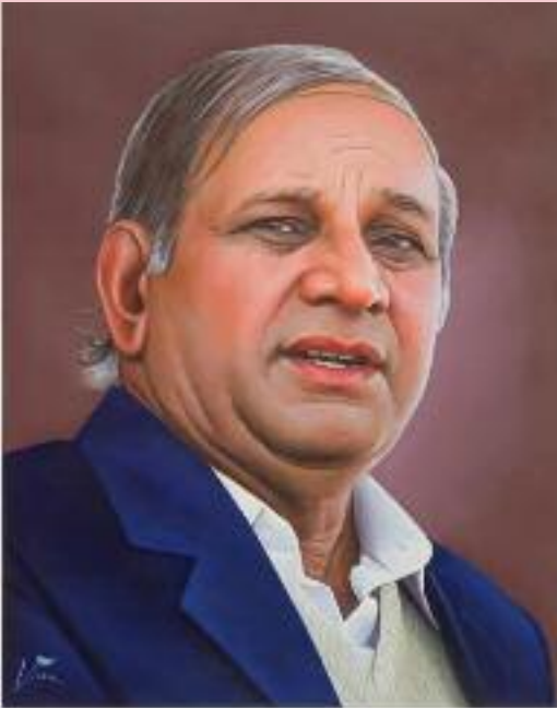
Saheb Kanshi Ram 15/03/1934 - 09/10/2006 Founder : SAMCEF, DS 4, BSP

ਗੰਭੀਰ ਹੋਣਗੇ, ਜੋ ਸਾਡੀਆਂ ਆਉਣ ਵਾਲੀਆਂ ਨਸਲਾਂ ਨੂੰ ਵੀ ਭੁਗਤਣੇ ਪੈਣਗੇ। ਫਿਰ ਸਾਡੇ ਕੋਲ ਕੁਛ ਨਹੀਂ ਬਚੇਗਾ। ਸਰਕਾਰੀ ਨੌਕਰੀਆਂ, ਰਿਜ਼ਰਵੇਸ਼ਨ, ਐਜੂਕੇਸ਼ਨ ਤੁਹਾਡੇ ਕੋਲੋਂ ਚੁੱਪ ਚੁਪੀਤੇ ਖੋਹੀ ਜਾ ਰਹੀ ਹੈ। ਸਰਕਾਰੀ ਹਸਪਤਾਲ ਵਿੱਚ ਤੁਹਾਡੇ ਲਈ ਇਲਾਜ ਨਹੀਂ ਹੈ। ਉਥੇ ਦਵਾਈਆਂ, ਚੰਗੇ ਡਾਕਟਰਾਂ ਦੀ ਕਮੀ ਹਮੇਸ਼ਾ ਬਣੀ ਰਹਿੰਦੀ ਹੈ। ਨਸ਼ਿਆਂ ਨਾਲ ਦੇਸ਼ ਦਾ ਨੌਜਵਾਨ ਸਿਵਿਆਂ ਵੱਲ ਜਾ ਰਿਹਾ ਹੈ। ਸ਼ਰੇਆਮ ਦਲਿਤਾਂ 'ਤੇ ਜ਼ੁਲਮ ਹੋ ਰਹੇ ਹਨ। ਜਿਹੜੇ ਰਿਜ਼ਰਵ ਸੀਟਾਂ 'ਤੇ ਜਿੱਤੇ ਹੋਏ ਉਮੀਦਵਾਰ ਹਨ। ਉਹ ਪਾਰਟੀਆਂ ਦੇ ਗੁਲਾਮ ਹੋਣ ਕਰਕੇ ਮੂੰਹ ਨਹੀਂ ਖੋਲ ਰਹੇ, ਜੁਬਾਨ ਨੂੰ ਤਾਲੇ ਲੱਗੇ ਹੋਏ ਹਨ। ਕੋਈ ਨਿਆ ਨਹੀਂ। ਸਭ ਪਾਸੇ ਝੂਠ ਦਾ ਪਸਾਰਾ ਹੈ, ਫੋਕੀ ਸ਼ੋਹਰਤ ਹੈ, ਝੂਠੇ ਵਾਅਦੇ ਹਨ। ਤੁਹਾਡੀ ਕੋਈ ਸਾਰ ਲੈਣ ਵਾਲਾ ਨਹੀਂ। ਜ਼ਰਾ ਸੋਚੋ! ਆਪਣੇ ਨਿੱਜੀ ਸਵਾਰਥਾਂ ਤੋਂ ਉੱਪਰ ਉੱਠ ਕੇ ਤੁਹਾਨੂੰ ਆਪਸੀ ਏਕੇ ਦਾ ਸਬੂਤ ਦੇਣਾ ਹੋਵੇਗਾ। ਸਾਹਿਬ ਸ਼੍ਰੀ ਕਾਂਸ਼ੀ ਰਾਮ ਜੀ ਜਦੋਂ ਪੂਨੇ ਵਿੱਚ ਸਰਕਾਰੀ ਜੋਬ ਕਰਦੇ ਸਨ। ਤਾਂ ਉਹਨਾਂ ਨੇ ਬਾਬਾ ਸਾਹਿਬ ਡਾ. ਅੰਬੇਡਕਰ ਜੀ ਦੀ ਲਿਖੀ ਹੋਈ ਕਿਤਾਬ "ਜਾਤ -ਪਾਤ ਦਾ ਬੀਜ ਨਾਸ਼ " ਪੜ੍ਹੀ। ਉਸ ਕਿਤਾਬ ਨੇ ਸਾਹਿਬ ਸ਼੍ਰੀ ਕਾਂਸ਼ੀ ਰਾਮ ਜੀ ਦੀ ਜ਼ਿੰਦਗੀ ਹੀ ਬਦਲ ਦਿੱਤੀ। ਸਾਹਿਬ ਸ਼੍ਰੀ ਕਾਂਸ਼ੀ ਰਾਮ ਜੀ ਨੇ ਪ੍ਰਣ ਕੀਤਾ ਕਿ ਉਹ ਸ਼ਾਦੀ ਨਹੀਂ ਕਰਵਾਏਗਾ। ਮੇਰੇ ਨਾਂ 'ਤੇ ਕੋਈ ਬੈਂਕ ਬੈਲੰਸ ਨਹੀਂ ਹੋਵੇਗਾ। ਸਰਕਾਰੀ ਨੌਕਰੀ ਵੀ ਨਹੀਂ ਕਰਾਂਗਾ। ਮੇਰਾ ਬਹੁਜਨ ਸਮਾਜ ਹੀ ਪਰਿਵਾਰ ਹੋਵੇਗਾ। ਉਹੀ ਮੇਰਾ ਦੁੱਖਾਂ ਸੁੱਖਾਂ ਦਾ ਦਰਦੀ ਹੋਵੇਗਾ। ਫਿਰ ਕੀ ਸੀ ? ਸਾਹਿਬ ਸ਼੍ਰੀ ਕਾਂਸ਼ੀ ਰਾਮ ਜੀ ਨੇ ਦੋ ਪੈਰਾਂ ਅਤੇ ਸਾਇਕਲ ਦੇ ਦੋ ਪਹੀਆ ਨਾਲ ਮੀਲਾਂ ਬੱਧੀ ਸਫਰ ਤੈਅ ਕੀਤਾ ਅਤੇ ਲੋਕਾਂ ਨੂੰ ਲਾਮਬੰਦ ਕੀਤਾ। ਬਾਮਸੇਵ, ਡੀਐਸ ਫੋਰ, ਬਹੁਜਨ ਸਮਾਜ ਪਾਰਟੀ ਆਦਿ ਬਣਾਈ