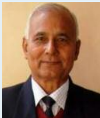
SR Darapuri I.P.S.(Retd)

The Question of Minority Representation One of the central themes in Ambedkar's political thought