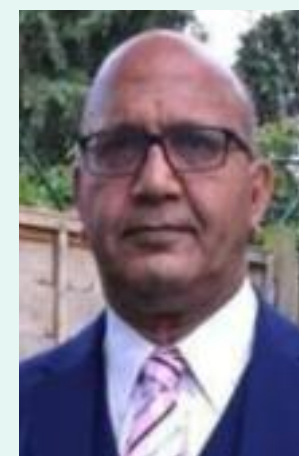
Bal Ram Sampla Bal Ram Sampla Geopolitics

126031100085_1.html 3. https://www.businesstoday.in/world/us-story/trump-thanks-india-reliance-for-backing-historic-300-billion-us-refinery-project-in-texas-520005-2026-03-11 4. https://www.bloombergr.com/news/articles/2026-03-10/trump-says-us-to-get-new-oil-refinery-with-reliance-backing 5. https://www.thequint.com/amp/story/news/breaking-news/trump-reliance-investment-texas-oil-refinery-announced