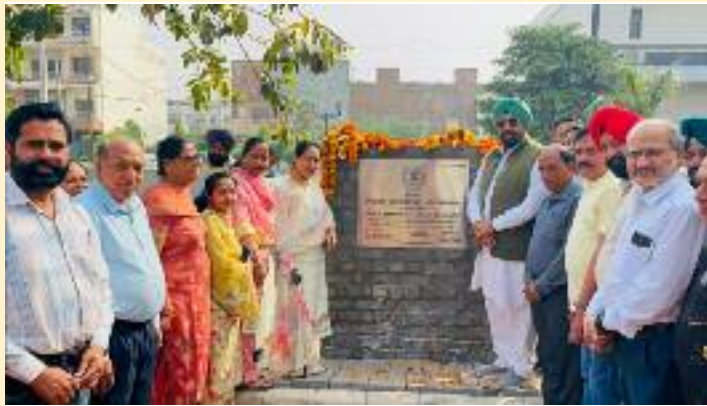
ਕਰਵਾਏ ਜਾ ਰਹੇ ਹਨ। ਉਨ੍ਹਾਂ ਕਿਹਾ ਕਿ ਡੇਰਾਬੱਸੀ ਹਲਕੇ ਦੇ