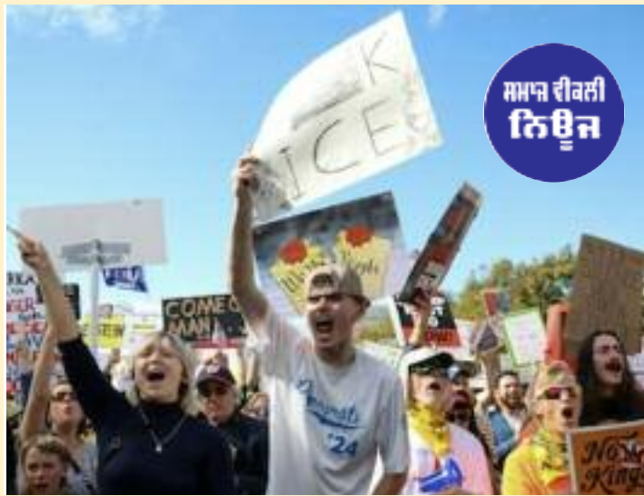
ਟੋਰਾਂਟੋ ਵਿੱਚ ਅਮਰੀਕੀ ਕੌਂਸਲੇਟ ਬਾਹਰ 'ਨੋ ਕਿੰਗਜ਼' ਪ੍ਰਦਰਸ਼ਨ ਦੌਰਾਨ ਨਾਅਰੇਬਾਜ਼ੀ ਕਰਦੇ ਲੋਕ।