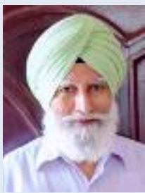
ਸਮਾਜ ਵੀਰਲੀ ਨਿਊਜ਼

ਗੁੱਡੀ ਅੱਧ ਅਸਮਾਨ ਚੜ੍ਹਾ ਕੇ , ਡੋਰ ਫਿਰ ਆਪੇ ਵੱਢ ਗਿਆ । ਖੁਦ ਹੀ ਦਿਲ ਦੇ ਵਿੱਚ ਵਸਾ ਕੇ , ਵਾਲ ਮੱਖਣ 'ਚੋਂ ਕੱਢ ਗਿਆ । ਉਸ ਨੂੰ ਮਾੜਾ ਨਈਂ ਕਹਿ ਸਕਦੇ , ਪਰ ਉਹ ਚੰਗਾ ਰਿਹਾ ਨਹੀਂ ; ਕਿਸ ਨੂੰ ਕੀ ਕਿੱਦਾਂ ਕੁੱਝ ਕਹੀਏ , ਕੋਈ ਵਿਚਾਲੇ ਛੱਡ ਗਿਆ ।