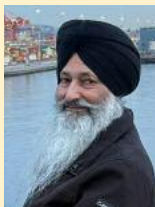
ਸਮਾਜ ਵੀਰਲੀ ਨਿਊਜ਼