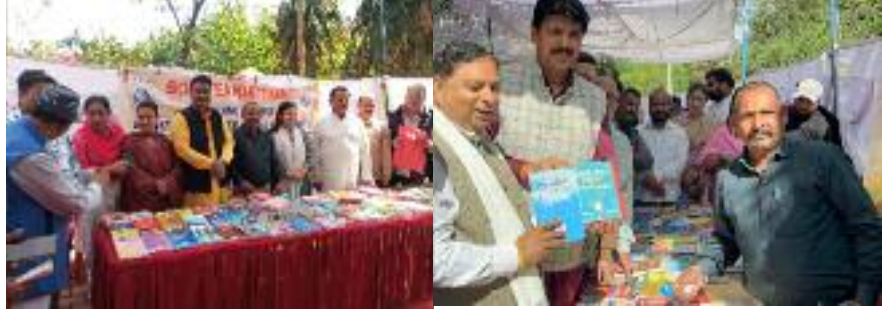
ਐਂਡ ਟਰਸਟ, ਜੰਮੂ ਵੱਲੋਂ ਆਯੋਜਿਤ ਕੀਤਾ ਜਾ ਰਿਹਾ ਹੈ। ਮਾਣਯੋਗ ਸੰਸਦ ਮੈਂਬਰ ਸ਼੍ਰੀ ਸਤ ਪਾਲ ਸ਼ਰਮਾ ਜੀ ਨੇ 21-03-2026 ਨੂੰ ਇਸ ਦੇ ਦਿਨਾਂ ਮੇਲੇ ਦਾ ਉਦਘਾਟਨ ਕੀਤਾ। ਇਸ

ਜੰਮੂ (ਚੰਡੀਹੌਕ): ਜੰਮੂ ਅਤੇ ਕਸ਼ਮੀਰ ਅਕੈਡਮੀ ਆਫ ਆਰਟ, ਕਲਚਰ ਐਂਡ ਲੈਂਗਵੇਜਜ਼ ਵੱਲੋਂ ਬਾਬਾ ਕੈਲਾਸ਼ ਨਾਥ, ਠੱਠਰ ਬੰਤਲਾਬ, ਜੰਮੂ ਵਿਖੇ “ਵੇਕਲ ਫਾਰ ਲੋਕਲ” ਦੇ ਨਾਅਰੇ ਹੇਠ ਆਯੋਜਿਤ ਕੀਤੇ ਜਾ ਰਹੇ ਕਿਸਾਨ ਮੇਲੇ ਦੌਰਾਨ ਦੋ ਦਿਨਾਂ ਪੁਸਤਕ ਪ੍ਰਦਰਸ਼ਨੀ ਲਗਾਈ ਗਈ। ਇਹ ਮੇਲਾ ਸੋਹਨ ਲਾਲ ਸੋਸ਼ਲ ਰੀਫਾਰਮਜ਼