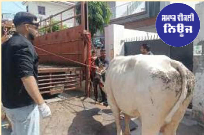
ਜ਼ਖ਼ਮੀ ਹੋ ਰਹੇ ਹਨ । ਕਿਸਾਨ ਵੀ ਫਸਲਾਂ ਦੇ ਨੁਕਸਾਨ ਕਾਰਨ

ਜ਼ਿਕਰਯੋਗ ਹੈ ਕਿ ਸੰਗਰੂਰ ਵਿਖੇ ਮੌਜੂਦਾ ਮੁੱਖ ਮੰਤਰੀ ਭਗਵੰਤ ਮਾਨ ਨੇ ਮੈਂਬਰ ਪਾਰਲੀਮੈਂਟ ਹੋਣ ਸਮੇਂ ਅਵਾਰਾ ਪਸ਼ੂਆਂ ਦੇ ਮੁੱਦੇ ਨੂੰ ਲੈ ਕੇ ਕਈ ਵਾਰ ਧਰਨਿਆਂ ਵਿੱਚ ਸ਼ਿਰਕਤ ਕੀਤੀ ਸੀ ਅਤੇ ਇਸਨੂੰ ਲੋਕਾਂ ਦੀ ਸੁਰੱਖਿਆ ਨਾਲ ਜੁੜਿਆ ਵੱਡਾ ਮਸਲਾ ਦੱਸਿਆ ਸੀ ਪਰ ਹੁਣ ਸਰਕਾਰ ਬਣਨ ਤੋਂ ਬਾਅਦ ਵੀ ਇਸ ਸਮੱਸਿਆ ਦਾ ਕੋਈ ਢੰਗ ਦਾ ਹੱਲ ਨਜ਼ਰ ਨਹੀਂ ਆ ਰਿਹਾ । ਪਿੰਡਾਂ ਤੇ ਸ਼ਹਿਰਾਂ ਦੀਆਂ ਸੜਕਾਂ 'ਤੇ ਅਵਾਰਾ ਪਸ਼ੂਆਂ ਦੀ ਭਰਮਾਰ ਕਾਰਨ ਹਰ ਰੋਜ਼ ਹਾਦਸੇ ਵਾਪਰ ਰਹੇ ਹਨ , ਜਿਨ੍ਹਾਂ ਵਿੱਚ ਕਈ ਲੋਕ