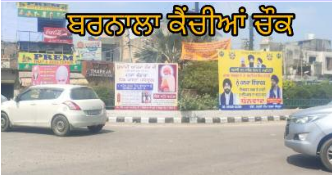
ਬਰਨਾਲਾ ਕੈਂਚੀਆਂ ਚੌਕ