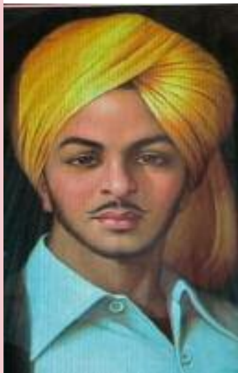
ਦੇਸ਼ ਵਿੱਚ ਰੋਹ ਉੱਠ ਖੜਾ ਹੋਇਆ।

ਉਸ ਰਾਤ ਲਾਹੌਰ ਦੀਆਂ ਗਲੀਆਂ ਵਿੱਚ ਲੋਕਾਂ ਦੀਆਂ ਅੱਖਾਂ ਤੋਂ ਅੱਥਰੂ ਵਹਿ ਰਹੇ ਸਨ। ਇੱਕ 23 ਸਾਲਾ ਨੌਜਵਾਨ ਨੇ ਆਪਣੀ ਜਾਨ ਦੇ ਕੇ ਇੱਕ ਅਜਿਹਾ ਆਦਰਸ਼ ਛੱਡਿਆ ਸੀ ਜਿਸ ਨੇ ਸਦੀਆਂ ਤੱਕ ਲੋਕਾਂ ਨੂੰ ਪ੍ਰਭਾਵਿਤ ਕਰਦੇ ਰਹਿਣਾ ਸੀ। ਉਸਨੇ ਲਿਖਿਆ ਸੀ - “ਮੈਂ ਆਜ਼ਾਦੀ ਲਈ ਨਹੀਂ, ਇਨਸਾਨੀਅਤ ਲਈ ਲੜਿਆ ਹਾਂ।” ਉਸਨੇ ਇੱਕ ਅਜਿਹਾ ਭਾਰਤ ਚਾਹਿਆ ਸੀ ਜਿੱਥੇ ਅਮੀਰ-ਗਰੀਬ, ਉੱਚ-ਨੀਚ ਦਾ ਭੇਦ ਨਾ ਰਹੇ, ਜਿੱਥੇ ਨਫਰਤ ਨਾ ਹੋਵੇ, ਸਿਰਫ ਇੱਕਤਾ ਅਤੇ ਇਨਸਾਫ ਹੋਵੇ।