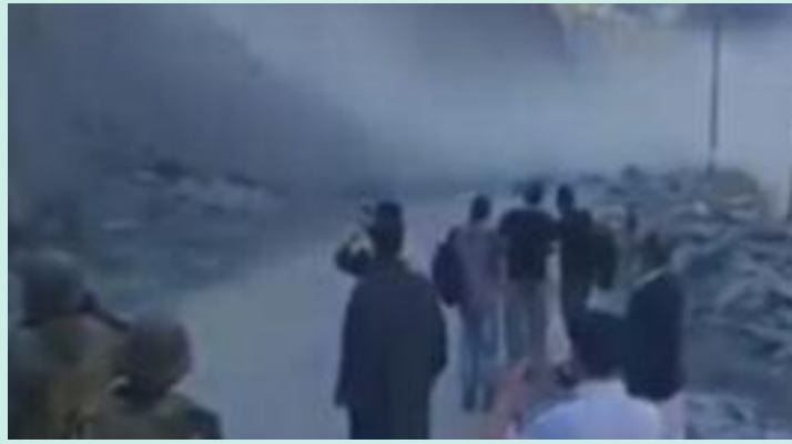
ਮਾੜੀ ਯੋਜਨਾਬੰਦੀ ਅਤੇ ਅਣਗਹਿਲੀ ਦਾ ਨਤੀਜਾ ਸੀ। "ਜਦੋਂ ਇਸ ਹਾਈਵੇਅ 'ਤੇ ਨਿਯਮਿਤ ਤੌਰ 'ਤੇ ਜ਼ਮੀਨ ਖਿਸਕਦੀ ਹੈ, ਤਾਂ ਲੋਕ ਜਲਦੀ ਹੀ ਆਪਣੇ ਘਰ ਛੱਡਣ ਤੋਂ ਡਰ

ਆਵਾਜਾਈ ਠੱਪ ਹੋ ਗਈ। ਅਧਿਕਾਰੀਆਂ ਨੇ ਕਿਹਾ ਕਿ ਮਲਬਾ ਹਟਾਉਣ ਲਈ ਆਦਮੀਆਂ ਅਤੇ ਮਸ਼ੀਨਰੀ ਨੂੰ ਮੌਕੇ 'ਤੇ ਭੇਜਿਆ ਗਿਆ। ਘਟਨਾ ਵਿੱਚ ਕੋਈ ਜਾਨੀ ਜਾਂ ਮਾਲੀ ਨੁਕਸਾਨ ਨਹੀਂ ਹੋਇਆ। ਹਾਲਾਂਕਿ, ਨਾਕਾਬੰਦੀ ਨੇ ਬੁਨਿਆਦੀ ਢਾਂਚੇ ਦੀ ਸੁਰੱਖਿਆ ਅਤੇ ਪ੍ਰਸ਼ਾਸਨਿਕ ਨਿਗਰਾਨੀ 'ਤੇ ਜਨਤਕ ਸ਼ਿਕਾਇਤਾਂ ਨੂੰ ਮੁੜ ਸੁਰਜੀਤ ਕੀਤਾ। ਫਸੇ ਹੋਏ ਯਾਤਰੀਆਂ ਨੇ ਦੋਸ਼ ਲਗਾਇਆ ਕਿ ਇਸ ਰਸਤੇ 'ਤੇ ਅਕਸਰ ਜ਼ਮੀਨ ਖਿਸਕਣ