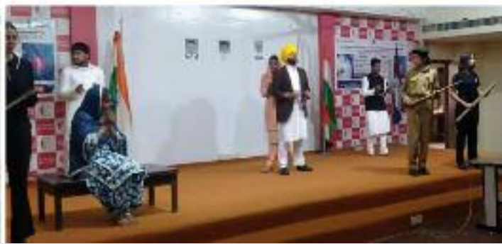
ਭਗਤ ਸਿੰਘ ਦੇ ਜੀਵਨ 'ਤੇ ਇੱਕ ਨਾਟਕ ਸਟੇਜ 'ਤੇ।

ਦਾ ਜਨਮ 28 ਸਤੰਬਰ , 1907 ਉਨ੍ਹਾਂ ਦਾ ਜਨਮ ਪਾਕਿਸਤਾਨ ਦੇ ਲਾਇਲਪੁਰ ਜ਼ਿਲ੍ਹੇ (ਹੁਣ ਫੈਸਲਾਬਾਦ) ਦੇ ਪਿੰਡ ਬੰਗਾ ਵਿੱਚ ਹੋਇਆ ਸੀ। ਉਨ੍ਹਾਂ ਦਾ ਜੱਦੀ ਪਿੰਡ ਪੰਜਾਬ ਦੇ ਸ਼ਹੀਦ