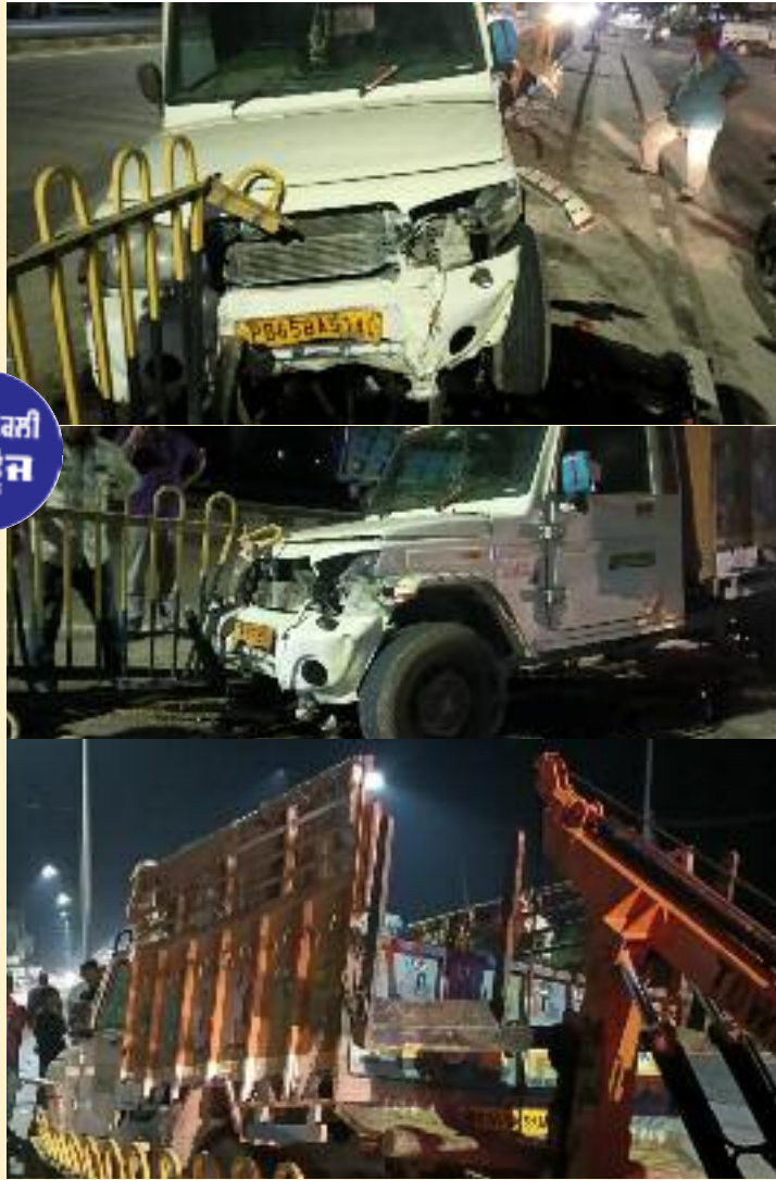
ਗਈ ਅਤੇ ਜਾਨੀ ਨੁਕਸਾਨ ਦਾ ਬਚਾਅ ਹੋ ਗਿਆ।

ਨਵਾਂਸ਼ਹਿਰ /ਕਾਠਗੜ੍ਹ 22 ਮਾਰਚ (ਜਤਿੰਦਰ ਪਾਲ ਸਿੰਘ ਕਲੇਰ ) ਰੋਪੜੂ ਬਲਾਚੌਰ ਨੈਸ਼ਨਲ ਹਾਈਵੇ ਤੇ ਨੇੜੇ ਪਿੰਡ ਰੈਲਮਾਜਰਾ ਦੇ ਅੱਡੇ ਬਲੈਰੋ ਪਿੱਕਅਪ ਜੀਪ ਦਾ ਐਕਸੀਡੈਂਟ ਹੋਣ ਦਾ ਸਮਾਚਾਰ ਪ੍ਰਾਪਤ ਹੋਇਆ ਹੈ। ਇਸ ਸਬੰਧੀ ਜਾਣਕਾਰੀ ਦਿੰਦੇ ਹੋਏ ਸੁਰਿੰਦਰ ਸ਼ਿੰਦਾ ਪ੍ਰਧਾਨ ਰੈਲਮਾਜਰਾ ਨੇ ਦੱਸਿਆ ਕਿ ਬਲੈਰੋ ਪਿੱਕਅਪ ਜੀਪ ਜਿਸ ਦਾ ਨੰਬਰ ਪੀ ਬੀ 65 ਬੀ ਏ 5140 ਜੋ ਬਲਾਚੌਰ ਸਾਇਡ ਤੋਂ ਰੋਪੜੂ ਸਾਇਡ ਜਾ ਰਹੀ ਜਦੋਂ ਇਹ ਜੀਪ ਰੈਲਮਾਜਰਾ ਦੇ ਅੱਡੇ ਦੇ ਕੋਲ ਪਹੁੰਚੀ ਤਾਂ ਅਚਾਨਕ ਇਸ ਜੀਪ ਅੱਗੇ ਬੇਸਹਾਰਾ ਪਸ਼ੂ ਆ ਗਿਆ ਜਿਸ ਨੂੰ ਬਚਾਉਣ ਲਈ ਡਰਾਈਵਰ ਨੇ ਬ੍ਰੇਕ ਮਾਰੀ ਤਾਂ ਜੀਪ ਦਾ ਸਤੰਨਲ ਵਿਗੜ ਗਿਆ ਜਿਸ ਜੀਪ ਬੈਕਾਬੂ ਹੋ ਕਿ ਡਿਵਾਈਡਰ ਤੇ ਜਾ ਚੜ੍ਹੀ ਅਤੇ ਰੇਲਿੰਗ ਨਾਲ ਜਾ ਟਕਰਾਈ ਜਿਸ ਨਾਲ ਕਾਫੀ ਦੂਰ ਤੱਕ ਰੇਲਿੰਗ ਟੁੱਟ ਗਈ ਅਤੇ ਜੀਪ ਦੇ ਡਰਾਈਵਰ ਦੇ ਮਾਮੂਲੀ ਸੱਟਾਂ ਵੱਜੀਆਂ ਅਤੇ ਗੱਡੀ ਬੁਰੀ ਤਰ੍ਹਾਂ ਨਾਲ ਨੁਕਸਾਨੀ