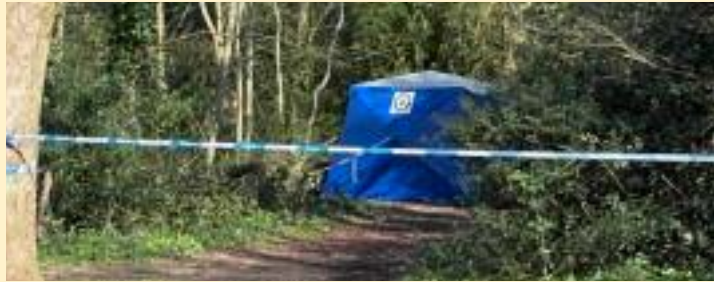
ਘਟਨਾ ਵਾਲੀ ਜਗਾ ਜਿਸ ਕੂੜੇ ਦੇ ਡੱਬੇ ਚੋਂ ਲਾਸ਼ ਮਿਲੀ!

ਲੈਸਟਰ (ਇੰਗਲੈਂਡ), 16 ਮਾਰਚ (ਸੁਖਜਿੰਦਰ ਸਿੰਘ ਢੱਡੇ)- ਇੰਗਲੈਂਡ ਦੇ ਸ਼ਹਿਰ ਕੋਵੈਂਟਰੀ ਵਿੱਚ ਇੱਕ ਪਾਰਕ ਵਿੱਚੋਂ ਕੂੜੇ ਦੇ ਡੱਬੇ (ਵੀਲੀ ਬਿਨ) ਵਿੱਚੋਂ ਇੱਕ ਵਿਅਕਤੀ ਦੀ ਲਾਸ਼ ਮਿਲਣ ਤੋਂ ਬਾਅਦ ਪੁਲਿਸ ਨੇ ਤਿੰਨ ਲੋਕਾਂ ਨੂੰ ਗ੍ਰਿਫ਼ਤਾਰ ਕੀਤਾ ਹੈ। ਵੈਸਟ ਮਿਡਲੈਂਡਜ਼ ਪੁਲਿਸ ਮੁਤਾਬਕ ਇੱਕ ਪੁਰਸ਼ ਅਤੇ ਇੱਕ ਔਰਤ ਜੋ ਦੋਵੇਂ ਚਾਲੀ ਸਾਲ ਦੇ ਕਰੀਬ ਹਨ ਅਤੇ ਇੱਕ ਨੌਜਵਾਨ ਜੋ ਵੀਹਾਂ ਸਾਲਾਂ ਵਿੱਚ ਹੈ, ਨੂੰ ਕਤਲ ਦੇ ਸ਼ੱਕ ਅਤੇ ਅਪਰਾਧੀ ਦੀ ਮਦਦ ਕਰਨ ਦੇ ਦੋਸ਼ਾਂ ਹੇਠ ਹਿਰਾਸਤ ਵਿੱਚ ਲਿਆ ਗਿਆ ਹੈ। ਪੁਲਿਸ ਅਨੁਸਾਰ ਇਹ ਤਿੰਨੋਂ ਸ਼ੱਕੀ ਵਿਅਕਤੀ ਬਲੈਕਪੂਲ ਤੋਂ ਗ੍ਰਿਫ਼ਤਾਰ ਕੀਤੇ ਗਏ ਹਨ ਅਤੇ ਉਨ੍ਹਾਂ ਨਾਲ ਪੁੱਛਗਿੱਛ ਕੀਤੀ ਜਾ ਰਹੀ ਹੈ। ਪੁਲਿਸ ਨੇ ਦੱਸਿਆ ਕਿ ਮ੍ਰਿਤਕ ਵਿਅਕਤੀ ਦੀ ਪਛਾਣ ਕਰਨ ਅਤੇ ਮੌਤ ਦੇ ਅਸਲ ਕਾਰਨਾਂ ਦਾ ਪਤਾ ਲਗਾਉਣ ਲਈ ਜਾਂਚ ਜਾਰੀ ਹੈ। ਜਾਣਕਾਰੀ ਅਨੁਸਾਰ ਸ਼ੁੱਕਰਵਾਰ ਸ਼ਾਮ ਕਰੀਬ 5 ਵਜੇ ਇੱਕ ਆਮ ਨਾਗਰਿਕ ਵੱਲੋਂ ਪੁਲਿਸ ਨੂੰ ਕੋਵੈਂਟਰੀ ਦੇ ਡਾਈਮਲਰ ਰੋਡ ਨੇੜੇ ਸਥਿਤ ਕੈਸ਼ ਪਾਰਕ ਤੋਂ ਸੂਚਨਾ ਦਿੱਤੀ ਗਈ ਸੀ। ਪੁਲਿਸ ਜਦੋਂ ਮੌਕੇ 'ਤੇ ਪਹੁੰਚੀ ਤਾਂ ਉਨ੍ਹਾਂ ਨੂੰ ਇੱਕ ਕੂੜੇ ਦੇ ਡੱਬੇ