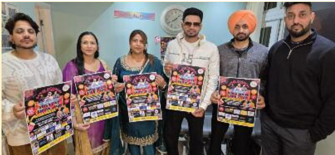
ਮਾਂ ਦਿਵਸ ਅਤੇ ਵਿਸਾਖੀ ਦੇ ਸਬੰਧ 'ਚ ਹੋ ਰਹੇ ਸਮਾਗਮ ਦਾ ਪੋਸਟਰ ਜਾਰੀ ਕਰਦੇ ਹੋਏ ਪ੍ਰਬੰਧਕ ਅਤੇ ਪੰਜਾਬ ਤੋਂ ਪੁੱਜੇ ਪੰਜਾਬੀ ਕਲਾਕਾਰ!

ਪ੍ਰਬੰਧਕਾਂ ਵੱਲੋਂ ਅੱਜ ਇਸ ਸਬੰਧੀ ਪੋਸਟਰ ਜਾਰੀ ਕਰਦਿਆਂ ਦੱਸਿਆ ਕਿ ਇਸ ਵਿਸ਼ੇਸ਼ ਸਮਾਗਮ ਦਾ ਮੁੱਖ ਮਕਸਦ ਵਿਦੇਸ਼ ਦੀ ਧਰਤੀ 'ਤੇ ਪੰਜਾਬੀ ਸੱਭਿਆਚਾਰ, ਰਿਵਾਇਤਾਂ ਅਤੇ ਵਿਰਸੇ ਨੂੰ ਉਭਾਰਨਾ ਅਤੇ ਨਵੀਂ ਪੀੜ੍ਹੀ ਨੂੰ ਆਪਣੇ ਮੂਲਾਂ ਨਾਲ ਜੋੜਨਾ ਹੈ। ਹਰ ਸਾਲ ਦੀ ਤਰ੍ਹਾਂ ਇਸ ਵਾਰ ਵੀ ਪ੍ਰੋਗਰਾਮ ਨੂੰ ਵਿਸ਼ਾਲ ਪੱਧਰ 'ਤੇ ਮਨਾਉਣ ਲਈ ਖਾਸ ਤਿਆਰੀਆਂ ਕੀਤੀਆਂ ਜਾ ਰਹੀਆਂ ਹਨ ਅਤੇ ਦਰਸ਼ਕਾਂ ਲਈ ਮਨੋਰੰਜਨ ਭਰਪੂਰ ਪ੍ਰੋਗਰਾਮ ਪੇਸ਼ ਕੀਤਾ ਜਾਵੇਗਾ। ਇਸ ਸਮਾਗਮ ਵਿੱਚ ਰੰਗ ਭਰਨ ਲਈ ਪੰਜਾਬ ਤੋਂ ਖਾਸ ਤੌਰ 'ਤੇ ਪ੍ਰਸਿੱਧ ਪੰਜਾਬੀ ਗਾਇਕ ਧੀਰਾ ਗਿੱਲ,