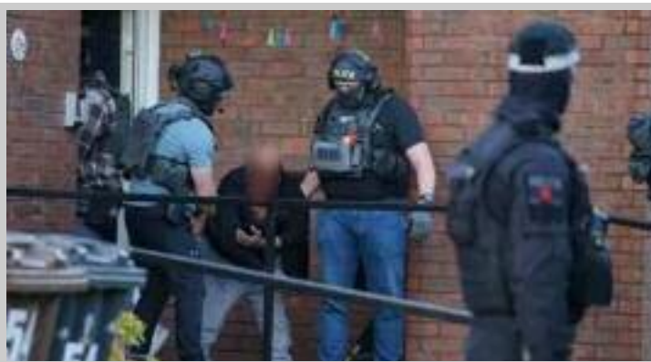
ਈਰਾਨ ਲਈ ਜਾਸੂਸੀ ਦੇ ਸ਼ੱਕ 'ਚ ਵਿੱਚ ਕੀਤੀ ਗਈ ਕਾਰਵਾਈ ਦੌਰਾਨ ਤਲਾਸ਼ੀ ਕਰਦੀ ਹੋਈ ਪੁਲਿਸ ।

ਕਰੀਬ 1 ਵਜੇ ਬਾਰਨੇਟ ਅਤੇ ਵਾਟਫੋਰਡ ਖੇਤਰਾਂ ਵਿੱਚ ਕੀਤੀਆਂ ਗਈਆਂ। ਗ੍ਰਿਫਤਾਰ ਹੋਣ ਵਾਲਿਆਂ ਵਿੱਚ ਇੱਕ ਇਰਾਨੀ ਨਾਗਰਿਕ ਅਤੇ ਤਿੰਨ ਦੋਹਰੇ ਬ੍ਰਿਟਿਸ਼-ਇਰਾਨੀ ਨਾਗਰਿਕ ਸ਼ਾਮਲ ਹਨ। ਪੁਲਿਸ ਮੁਤਾਬਕ 40 ਸਾਲਾ ਅਤੇ 55 ਸਾਲਾ ਦੋ ਵਿਅਕਤੀਆਂ ਨੂੰ ਬਾਰਨੇਟ ਖੇਤਰ ਵਿੱਚੋਂ ਗ੍ਰਿਫਤਾਰ ਕੀਤਾ ਗਿਆ, ਜਦਕਿ 52 ਸਾਲਾ ਇੱਕ ਹੋਰ ਵਿਅਕਤੀ ਨੂੰ ਵਾਟਫੋਰਡ ਵਿੱਚੋਂ ਕਾਬੂ ਕੀਤਾ ਗਿਆ। ਚੌਥੇ ਸ਼ੱਕੀ 22 ਸਾਲਾ ਨੌਜਵਾਨ ਨੂੰ ਹੋਰ ਖੇਤਰ ਵਿੱਚੋਂ ਗ੍ਰਿਫਤਾਰ ਕੀਤਾ ਗਿਆ। ਪੁਲਿਸ ਵੱਲੋਂ ਬਾਰਨੇਟ ਅਤੇ