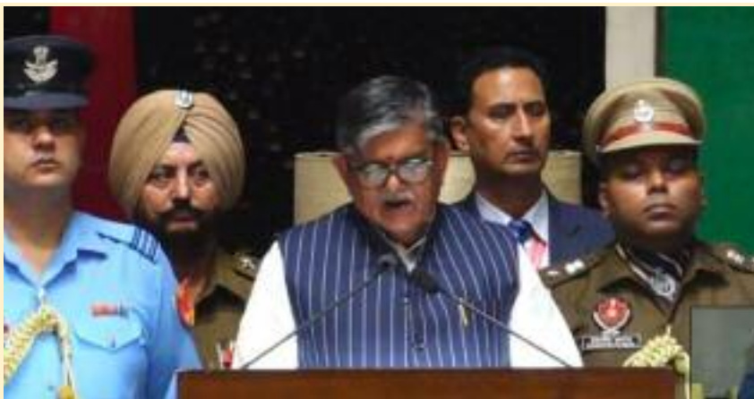
ਕੀਤਾ ਹੈ। ਇਸ ਤਬਦੀਲੀ ਦੇ ਕੇਂਦਰ ਵਿੱਚ 881 ਆਮ ਆਦਮੀ ਕਲੀਨਿਕ ਹਨ, ਜੋ ਕਿ ਇੱਕ ਵੱਡੀ ਪਹਿਲ ਹੈ। ਉਹ ਇੱਕ ਵਿਸ਼ਵ ਪੱਧਰੀ ਮਾਡਲ ਵਜੋਂ

ਲੇ ਹੀ ਉਨ੍ਹਾਂ ਨੂੰ ਟੋਕ ਦਿੱਤਾ ਤੇ ਕਿਹਾ ਕਿ ਤੁਸੀਂ ਆਪਣੇ ਮੁੱਦੇ ਬਾਅਦ ਵਿਚ ਚੁੱਕਣਾ। ਰਾਜਪਾਲ ਗੁਲਾਬ ਚੰਦ ਕਟਾਰੀਆ ਨੇ ਕਿਹਾ ਹੈ ਕਿ ਪੰਜਾਬ ਮੁੱਖ ਮੰਤਰੀ ਕੈਂਸਰ ਰਾਹਤ ਯੋਜਨਾ ਤਹਿਤ ਕੈਂਸਰ ਦੇ ਇਲਾਜ ਦੀ ਪੇਸ਼ਕਸ਼ ਕਰਨ ਵਾਲਾ ਪਹਿਲਾ ਸੂਬਾ ਬਣ ਗਿਆ ਹੈ। ਇਹ ਯੋਜਨਾ 10 ਸਰਕਾਰੀ ਹਸਪਤਾਲਾਂ ਰਾਹੀਂ ਚਲਾਈ ਜਾਂਦੀ ਹੈ। ਇਹ ਯੋਜਨਾ 11 ਨਿੱਜੀ ਹਸਪਤਾਲਾਂ ਵਿੱਚ ਵੀ ਕੰਮ ਕਰਦੀ ਹੈ, ਉੱਥੇ ਵਿੱਤੀ ਸਹਾਇਤਾ ਪ੍ਰਦਾਨ ਕੀਤੀ ਜਾਂਦੀ ਹੈ। ਰਾਜਪਾਲ ਕਟਾਰੀਆ ਨੇ ਕਿਹਾ ਹੈ ਕਿ ਸਰਕਾਰ ਨੇ ਸਿਹਤ ਸੰਭਾਲ ਨੈੱਟਵਰਕ ਨੂੰ ਮਜ਼ਬੂਤ