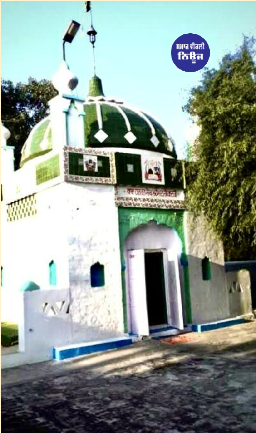
ਦਰਗਾਹ ਹਜ਼ਰਤ ਸ਼ੇਖ ਮੁਹੰਮਦ ਸਾਹਿਬ ਪਿੰਡ ਹਿੱਸੋਵਾਲ

ਬੜੇ ਹੀ ਹੈਰਾਨ ਕਰਨ ਵਾਲੇ ਮੈਸੇਜ ਆਏ, ਇੱਕ ਨੇ ਲਿਖਿਆ 'ਮੈਨੂੰ ਉਣੰਜਾ ਸਾਲ ਹੋ ਗਏ ਪਿੰਡ ਤੋਂ ਗਏ ਪਰ ਏਹ ਪਿੰਡ ਮੇਰਾ ਵੀ ਹੈ।' ਕਿਸੇ ਨੇ ਲਿਖਿਆ, 'ਵੀਰ, ਮੈਂ ਪਿੰਡ ਦੀ ਕੁੜੀ ਹਾਂ, ਫੇਰ ਕੀ ਆ ਵਿਦੇਸ਼ ਰਹਿੰਦੀ ਹਾਂ ਪਰ ਇਹ ਪਿੰਡ