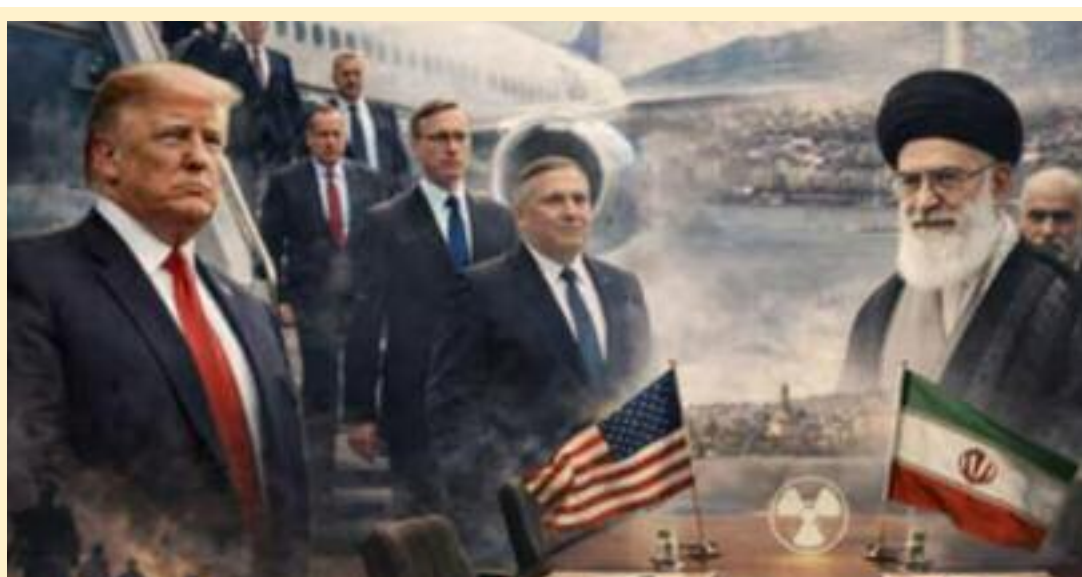
ਜੇਕਰ ਅਮਰੀਕਾ ਹਮਲਾ ਏਸ਼ੀਆ ਵਿੱਚ ਸਾਰੇ ਅਮਰੀਕੀ ਬਣਾਇਆ ਜਾਵੇਗਾ। ਈਰਾਨ ਕਰਦਾ ਹੈ, ਤਾਂ ਪੱਛਮੀ ਫੌਜੀ ਠਿਕਾਣਿਆਂ ਨੂੰ ਨਿਸ਼ਾਨਾ ਦੇ ਵਿਦੇਸ਼ ਮੰਤਰੀ ਅੱਬਾਸ

ਜਿਨੇਵਾ: ਈਰਾਨ ਅਤੇ ਅਮਰੀਕਾ ਨੇ ਵੀਰਵਾਰ ਨੂੰ ਤਹਿਰਾਨ ਦੇ ਪ੍ਰਮਾਣੂ ਪ੍ਰੋਗਰਾਮ ਬਾਰੇ ਜਿਨੇਵਾ ਵਿੱਚ ਘੰਟਿਆਂਬੱਧੀ ਗੱਲਬਾਤ ਕੀਤੀ। ਇਸ ਨੂੰ ਕੂਟਨੀਤੀ ਲਈ ਇੱਕ ਆਖਰੀ ਮੌਕੇ ਵਜੋਂ ਦੇਖਿਆ ਜਾ ਰਿਹਾ ਹੈ, ਕਿਉਂਕਿ ਅਮਰੀਕਾ ਨੇ ਈਰਾਨ 'ਤੇ ਸਮਝੌਤੇ ਲਈ ਦਬਾਅ ਪਾਉਣ ਲਈ ਪੱਛਮੀ ਏਸ਼ੀਆ ਵਿੱਚ ਜਹਾਜ਼ਾਂ ਅਤੇ ਜੰਗੀ ਜਹਾਜ਼ਾਂ ਦਾ ਬੇੜਾ ਤਾਇਨਾਤ ਕੀਤਾ ਹੈ। ਪਿਛਲੇ ਸਾਲ ਜੂਨ ਤੋਂ ਬਾਅਦ ਅਮਰੀਕਾ ਅਤੇ ਈਰਾਨ