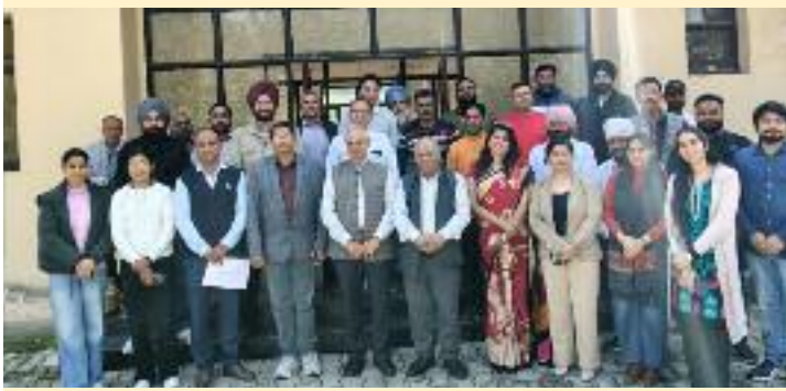
ਨਵਾਂਸ਼ਹਿਰ, (ਮਨੋਰੰਜਨਕਾਲੀਆ/ਜਤਿੰਦਰ ਪਾਲ ਸਿੰਘ ਕਲੇਰ)

ਜ਼ਿਲ੍ਹਾ ਉਦਯੋਗ ਕੇਂਦਰ ਦੇ ਸਹਿਯੋਗ ਨਾਲ ਕਰਵਾਇਆ ਸਮਾਗਮ