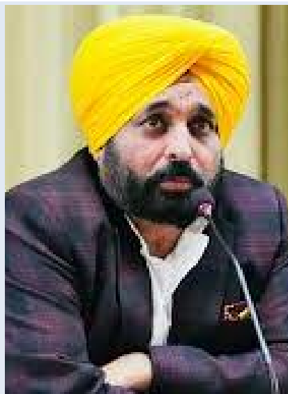
ਟੀਚਾ ਮਿੱਥਿਆ ਸੀ; ਅਗਲੇ ਵਿੱਤੀ ਸਾਲ 2026-27 ਦੌਰਾਨ 12,500 ਕਰੋੜ ਰੁਪਏ ਤੋਂ ਵੱਧ

ਸ਼ਾਮਲ ਕੀਤਾ ਗਿਆ, ਜਿਨ੍ਹਾਂ ਨੂੰ ਵਿਚਾਰਨ ਤੋਂ ਬਾਅਦ ਰਸਮੀ ਪ੍ਰਵਾਨਗੀ ਦਿੱਤੀ ਜਾਵੇਗੀ। ਪੰਜਾਬ ਸਰਕਾਰ ਵੱਲੋਂ ਪਿਛਲੇ ਕਈ ਮਹੀਨਿਆਂ ਤੋਂ ਨਵੀਂ ਆਬਕਾਰੀ ਨੀਤੀ ਬਣਾਉਣ ਲਈ ਤਿਆਰੀਆਂ ਕੀਤੀਆਂ ਜਾ ਰਹੀਆਂ ਹਨ। ਪੰਜਾਬ ਸਰਕਾਰ ਨੇ ਅਗਲੇ ਵਿੱਤੀ ਸਾਲ ਦੌਰਾਨ ਆਬਕਾਰੀ ਨੀਤੀ 'ਚੋਂ 8 ਤੋਂ 10 ਫ਼ੀਸਦ ਤੱਕ ਮਾਲੀਆ ਵਧਾਉਣ ਦਾ ਟੀਚਾ ਮਿੱਥਿਆ ਹੈ। ਪੰਜਾਬ ਸਰਕਾਰ ਨੇ ਵਿੱਤੀ ਸਾਲ 2024-25 ਲਈ ਆਬਕਾਰੀ ਤੋਂ 10,145 ਕਰੋੜ ਅਤੇ ਵਿੱਤੀ ਸਾਲ 2025-26 ਲਈ 11,200 ਕਰੋੜ ਰੁਪਏ ਮਾਲੀਆ ਇਕੱਠਾ ਕਰਨ ਦਾ