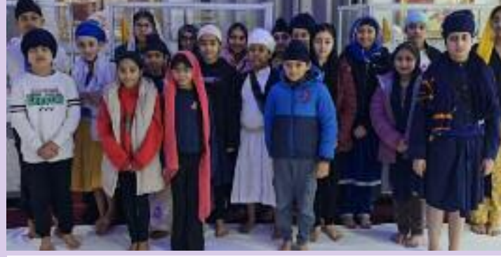
ਦੋ ਰੋਜ਼ਾ ਸਿੱਖੀ ਕੈਂਪ ਵਿੱਚ ਸ਼ਾਮਲ ਇੰਗਲੈਂਡ ਦੇ ਜੰਮਪਲ ਨੰਨੇ ਮੁੰਨੇ ਬੱਚੇ।

ਕਰਵਾਈ ਗਈ। ਬੱਚਿਆਂ ਦੀ ਰੁਚੀ ਅਤੇ ਮਨੋਰੰਜਨ ਨੂੰ ਧਿਆਨ ਵਿੱਚ ਰੱਖਦਿਆਂ ਪ੍ਰਬੰਧਕਾਂ ਵੱਲੋਂ ਖੇਡਾਂ ਅਤੇ ਮਨੋਰੰਜਕ ਗਤੀਵਿਧੀਆਂ ਦਾ ਵੀ ਖਾਸ ਪ੍ਰਬੰਧ ਕੀਤਾ ਗਿਆ। ਗੁਰਦੁਆਰਾ ਸਾਹਿਬ ਦੇ ਪ੍ਰਗਣ ਵਿੱਚ ਬੁਲੇ ਅਤੇ ਹੋਰ ਖੇਡ ਸਮੱਗਰੀ ਲਗਾਈ ਗਈ, ਜਿਸ ਨਾਲ ਬੱਚਿਆਂ ਨੇ ਖੁਸ਼ੀ ਅਤੇ ਉਤਸ਼ਾਹ ਨਾਲ ਸਮਾਂ ਬਿਤਾਇਆ। ਕੈਂਪ ਦੇ ਆਖਰੀ ਦਿਨ ਸਮਾਪਤੀ ਸਮਾਗਮ ਦੌਰਾਨ ਬੱਚਿਆਂ ਨੂੰ ਗੁੱਡੀ ਬੈਂਗ ਭੇਟ ਕਰਕੇ ਸਨਮਾਨਿਤ ਕੀਤਾ ਗਿਆ ਅਤੇ ਉਨ੍ਹਾਂ ਨੂੰ ਭਵਿੱਖ