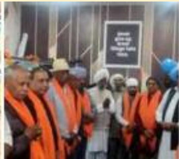
ਪੱਤਰਕਾਰ, ਸਰਪੰਚ, ਨੰਬਰਦਾਰ ਅਤੇ ਕਈ ਸਾਥੀ ਐਨ ਆਰ ਆਈ ਵੀ ਇਸ ਮੌਕੇ ਉਨ੍ਹਾਂ ਨੂੰ ਵਧਾਈਆਂ ਦੇਣ ਲਈ ਆਏ ਹੋਏ ਸਨ।